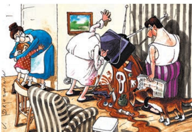
ИЛЛЮСТРАЦИЯ ВЕНДИ ДУРЭЙНИЧУ/САТКОСОВА/АНТРО

В среду в стране был праздник. Не будем в очередной раз ерничать по поводу его названия и смысла, но констатируем факт: это был праздник для всех. На страничке календаря с красной цифрой так и написано – День народного единства. Звездочек со сносками, что подразумевается под словом «народ», нет. Стало быть, имеются в виду все граждане РФ без исключения.