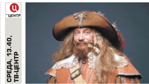
СРЕДА, 13.40, ТВ-ЦЕНТР

10 ноября страна поздравляет сотрудников органов внутренних дел России с профессиональным праздником. Концерт к этому дню всегда грандиозен, поэтому самые лучшие артисты, певцы и юмористы считают честью в нем участвовать и стараются порадовать зрителей.