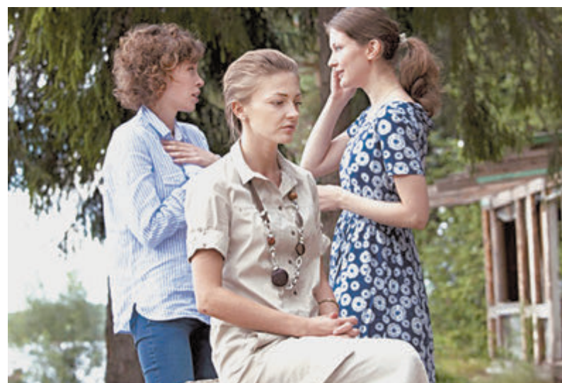
Сериал «Взрослые дочери».

Первый канал продолжает показ сериала «Взрослые дочери». Очень достойная работа, надо сказать, хорошие актерские работы. Однако ее начало навело и на грустные размышления. Почему, если в первых эпизодах отечественных сериалов появляется счастливая семья – любящие родители, прекрасные дети, то в следующих она оказывается разрушенной? Это прямо как ружье у Чехова, которое непременно должно выстрелить. Почему маленькие герои у нас обязательно страдают? Теряют папу или маму. Или вообще всю родню. Оказываются в детдомах и на улице. Их крадут, берут в заложники, ими шантрапят. Уж не провести ли нам грядущий День защиты детей под лозунгом «Сценаристы, руки прочь от подрастающего поколения!»?