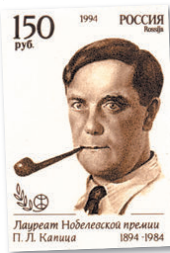
Лауреат Нобелевской премии П. Л. Капица 1894-1984