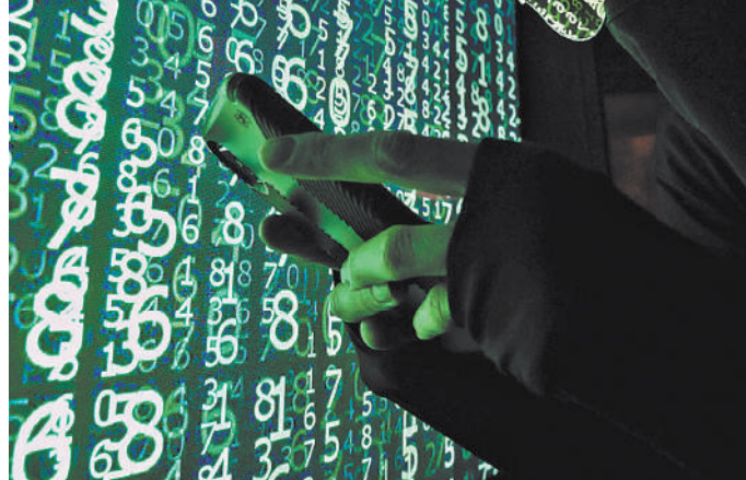
В полиции считают, что надо не только ловить мошенников, но и разоблачать с теми, на чьем «поле» они играют, — операторами связи.