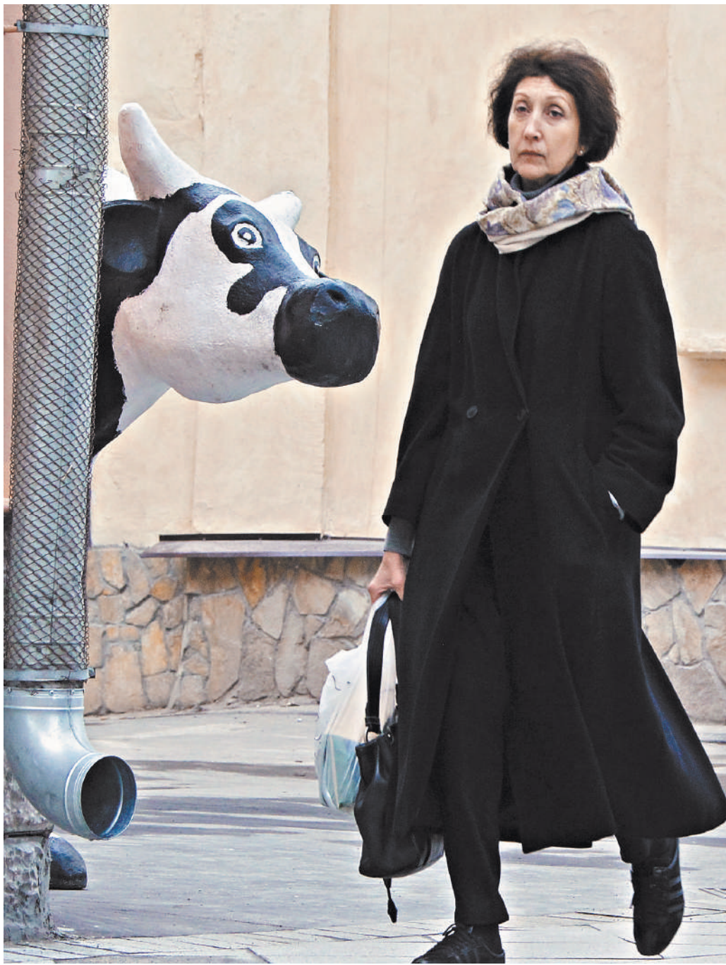
В прошлом году молочная продукция подорожала меньше чем на 10%, а те же корма — чуть ли не в полтора раза.

«При этом рост себестоимости не компенсировался ростом цены на полке и на ферме. Молоко и молочная продукция относятся к социально значимой категории товаров, и производителю не так просто пережить рост себестоимости продукции в цену на полке, особенно в условиях сокращения реально располагаемых доходов населения. Производители до текущего момента предпочитали жертвовать своей рентабельностью, но сохранять потребление. Однако в этом году у многих закончился этот буфер, и эта ситуация будет неизбежно оказывать давление на цены», — пояснил эксперт.