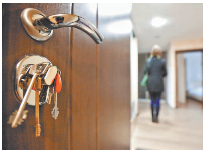
Порой апартменты появляются в зданиях, где их быть просто не может.

Федеральные власти уже давно ведут дискуссии о том, что апартментам нужно придать внятный правовой статус, поскольку фактически их используют как жилые, а юридически они им не являются. Но пока решение не принято. ●