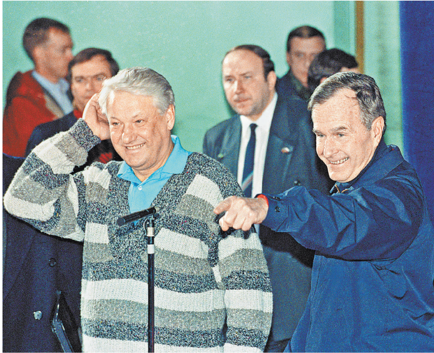
Свитер Бориса Ельцина и куртка Джорджа Буша-старшего в Кэмп-Дэвиде подчеркивали: время вражды с Америкой позади, настает время дружбы.

Буквально на днях британский премьер-министр Бо-