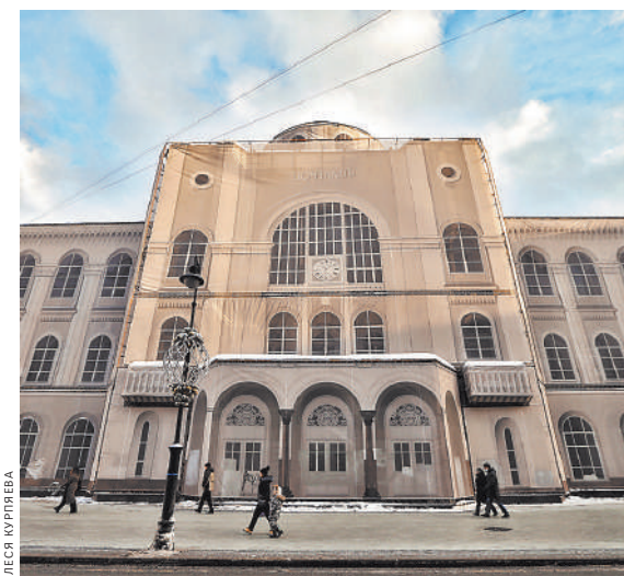
Еще пять лет — и Московский Императорский почтамт будет как новый.