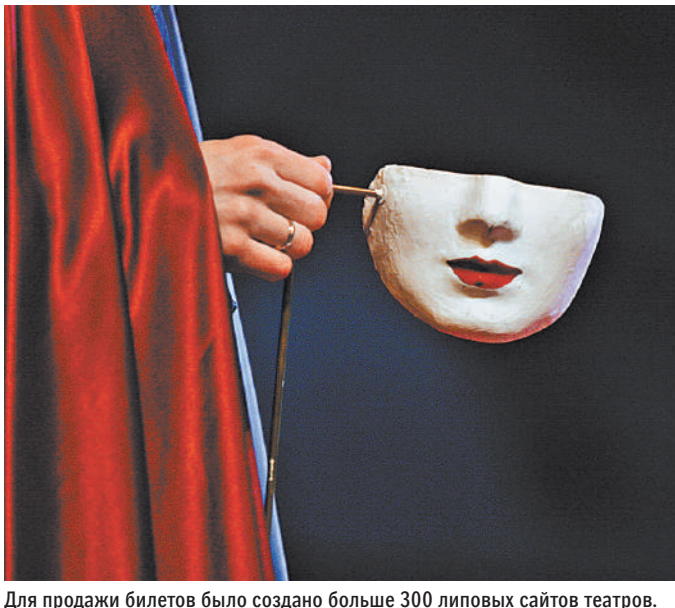
Для продажи билетов было создано больше 300 липовых сайтов театров.

— Читайте на сайте: Top-5 трендов потребления, которые спровоцировала пандемия rg.ru/art/2256242