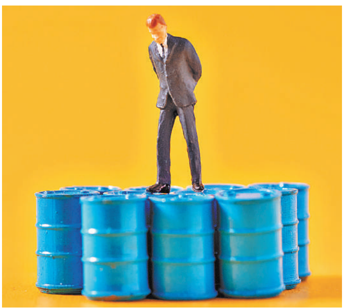
Россия занимает около 12% на мировом нефтяном рынке.