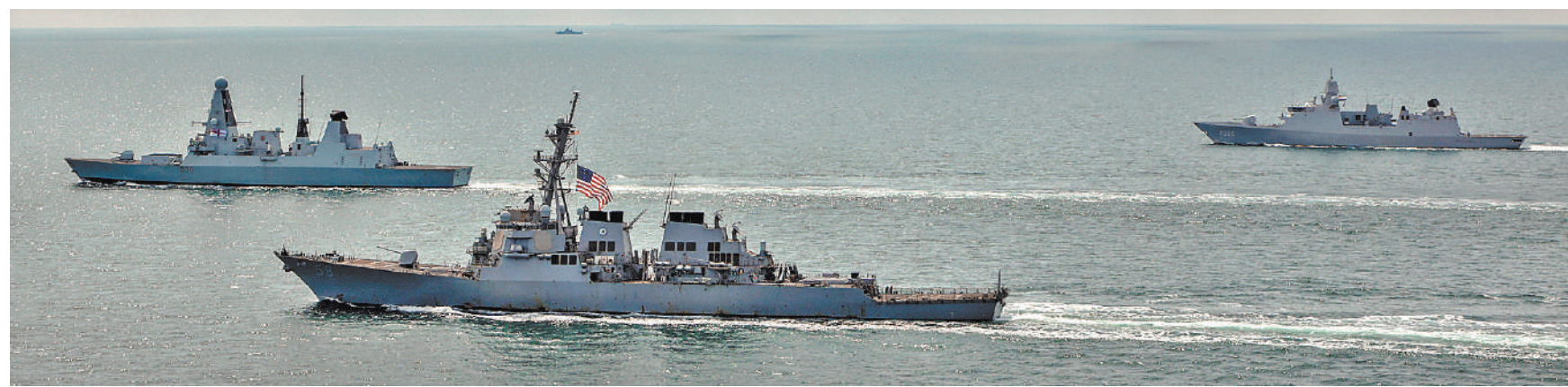
2022 год. Спустя тридцать лет после начала «новых взаимоотношений» с Москвой американцы считают, что это теперь они хозяева Черного моря у чужих берегов.