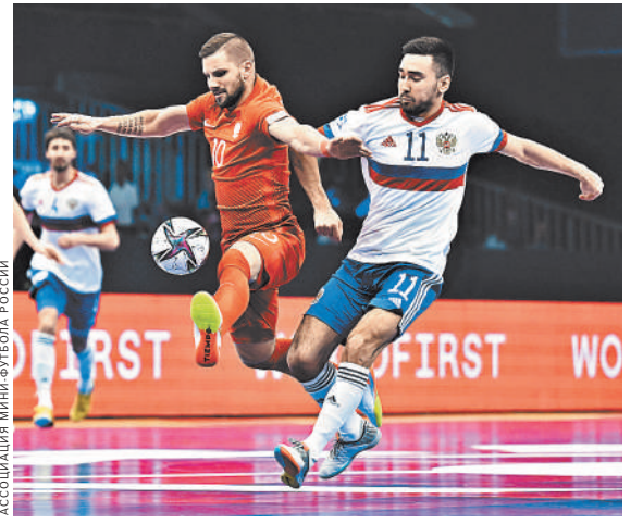
На групповой стадии Евро российская команда одержала три победы в трех матчах с разницей мячей 16-2.

18.55. Четвертьфинал чемпионата Европы по футболу. Россия — Грузия. Прямая трансляция.