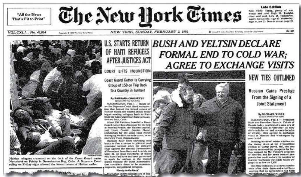
Февральский выпуск The New York Times: Первого февраля 1992 года Буш и Ельцин объявили о формальном конце «холодной войны».