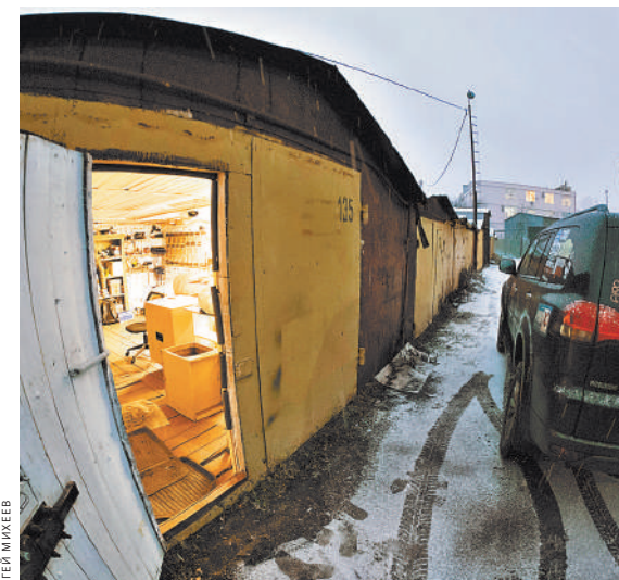
Если пай в ГСК выплачен, гараж становится собственностью. И владелец вправе использовать его по своему усмотрению.

Право собственности гражданина на недвижимость возникает сразу же после полной выплаты пая