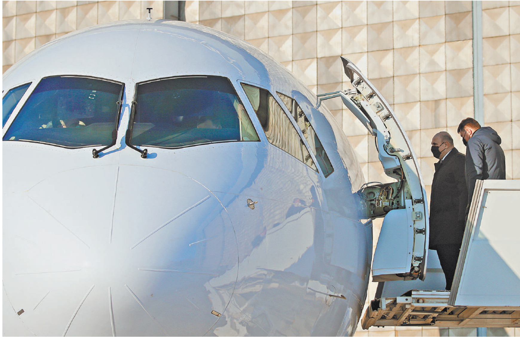
Михаил Мишустин во время посещения ПАО «Воронежское акционерное самолетостроительное общество».

Для поддержки наших предприятий самолетостроения правительство утвердило программу государственного за-