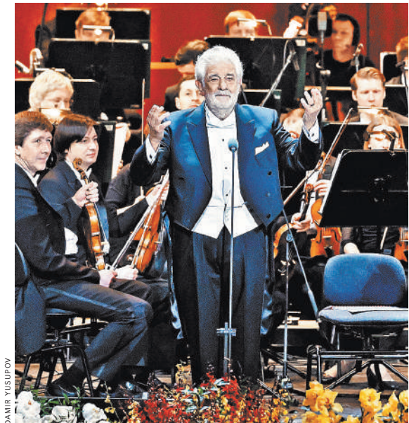
Пласидо Доминго: Выходя на сцену Большого, я чувствую такую же любовь публики, как и полвека назад.

ПЛАСИДО ДОМИНГО: И должен признать, это гораздо ответственнее, чем петь. Певец несет ответственность только за себя, а когда ты занимаешь место за дирижерским пультом, то несешь ответственность за все, что происходит и на сцене, и в оркестровой яме. И хочешь быть уверен, что все будет хорошо, притом что полдюжины репетиций постоянно не хватает, а на спектакле что-то да происходит. Концентрация дирижера должна быть абсолютной каждую секунду спектакля.