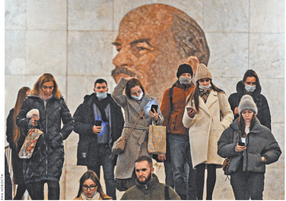
Стереть изображения нетрудно, но вычеркнуть из истории фигуру и уроки Ленина не выйдет.