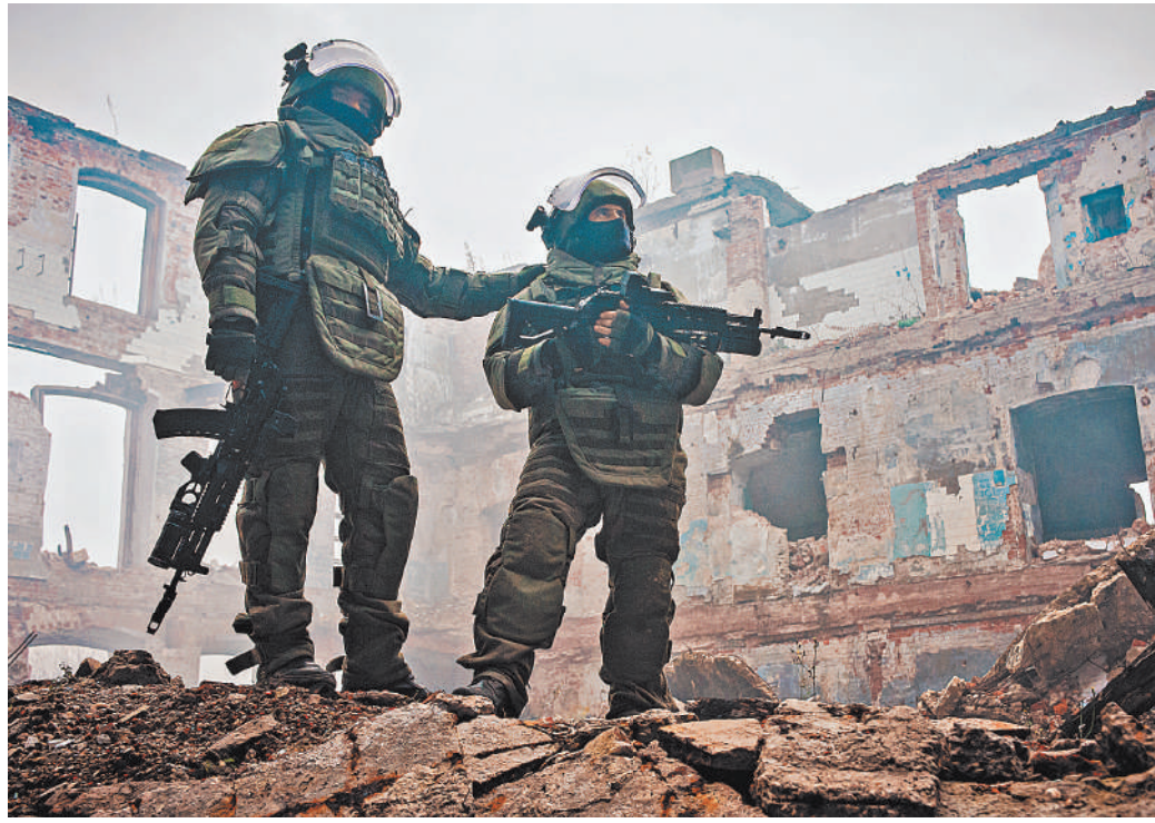
В Инженерных войсках даже есть свой спецназ — подразделения штурма и разграбления.

Особая миссия Инженерных войск — помощь мирному населению. И это не только разминирование. Мосты в районе природных бедствий наводи-