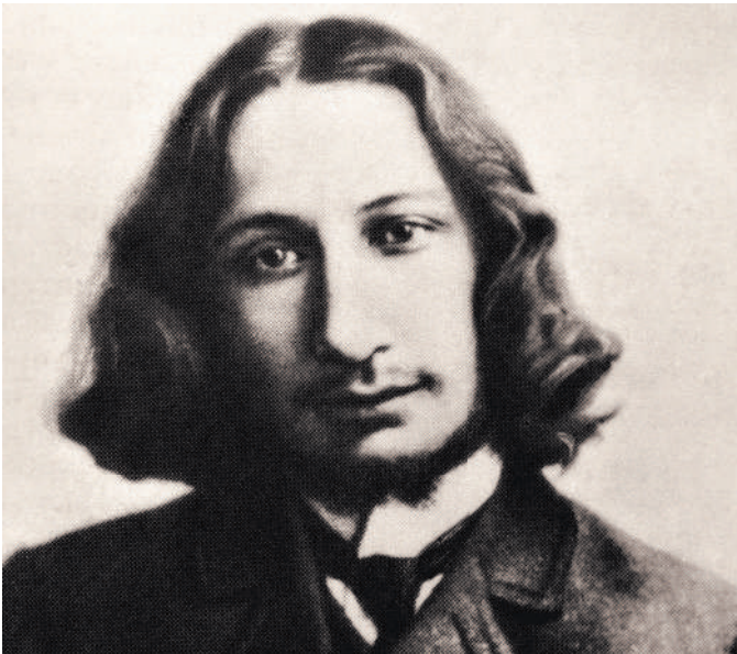
ВЕЩАТЕЛЬСКОЕ ФОТОГРАФИИ НАС

25 ноября 1937 года особой «тройкой» НКВД он был приговорен к высшей мере наказания и расстрелян в до сих пор не установленном месте. Неизвестно и место его захоронения. Его называют русским Леонардо да Винчи. Диапазон его интересов был столь широк, что с трудом укладывается в сознание. Множество богословских трудов, среди которых классическое сочинение «Стоп и утверждение истины» с попыткой объяснить, почему Божественная справедливость в «лучшем из миров» согласна с существованием мирового зла — вопрос, волновавший философов и богословов с незапамятных времен. Профессор философии Московской духовной академии и редактор журнала «Богословский вестник», он в то же время являлся преподавателем знаменитой художественной школы ВХУТЕМАС. После революции — ученический секретарь государственной комиссии по охране памятников искусства Троице-Сергиевой лавры, пытавшийся на основе закрытого большевиками монастыря создать «живой музей». И в то же время — инженер, один из разработчиков ленинского плана ГОЭЛРО по электрификации всей страны. Он был обладателем более десятка авторских свидетельств на изобретения в области химии, изучал вопросы электрических полей и диалектиков. И одновременно написал книгу «Мнимости в геометрии», в которой с помощью