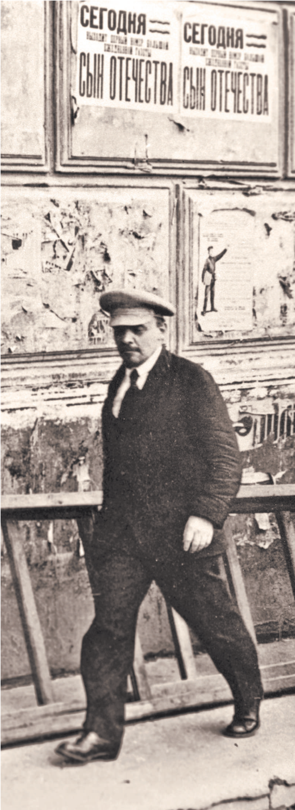
Универсального кода к Ленину нет: биограф уверяет — важнее, какая из его сторон актуальнее «здесь и сейчас».