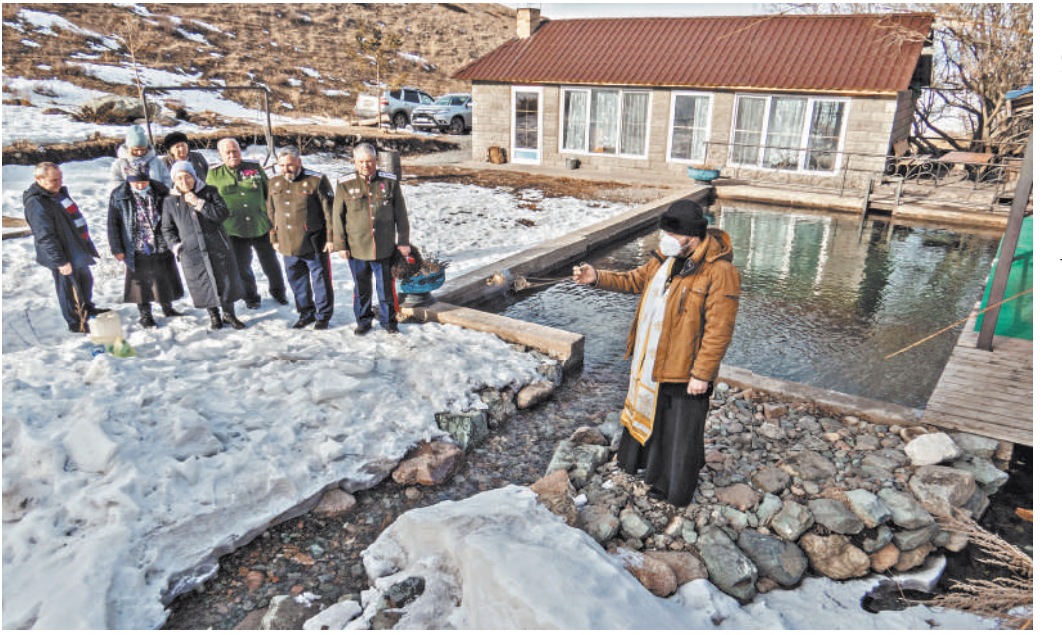
Казахам пандемия не помешала соблюсти традицию крещенского купания.

«На Масленицу устраивали гуляния, жгли чучело, угощали всех блинами», — говорит она. — Последние годы, правда, стало сложнее — пандемия, да и молодежи много разъехало». ●