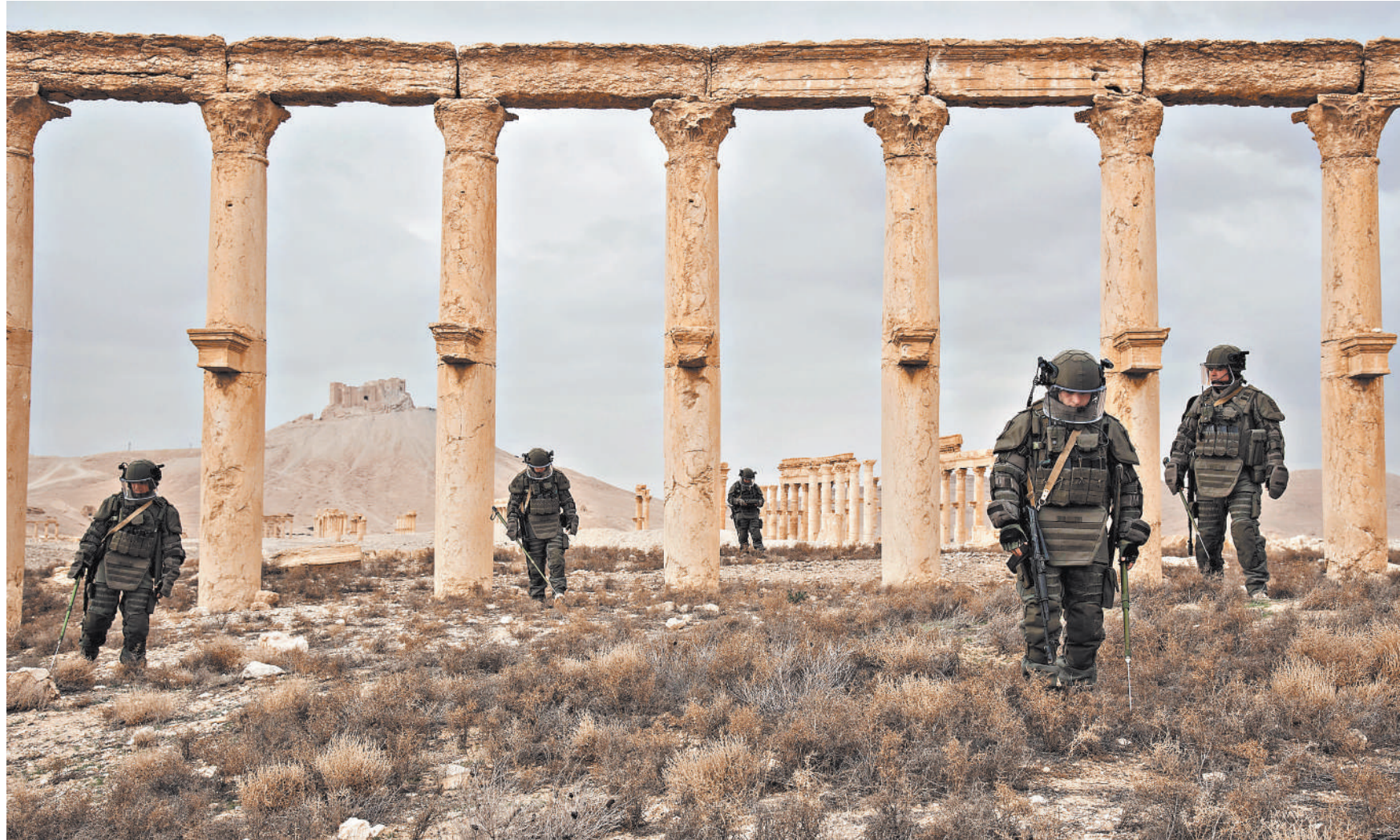
Все группы саперов во время боевой работы используют общевойсковой комплект разминирования ОВР-2-02. Он может спасти жизнь не только при взрыве, но и при обстреле.

В системах управления перспективных инженерных робототехнических комплексов разведки, минирования и разминирования собираются внедрять элементы искусственно интеллекта с функциями распознавания изображений, видеопотока и речи. Искусственный интеллект, построенный на принципе нейронных сетей, применим для управления манипуляторами роботов-саперов легкого класса. В перспективных автоматизированных системах управления войсками оперативного и тактического звена, а также в роботизированных комплексах группового управления искусственный интеллект можно внедрить в систему поддержки принятия ре-