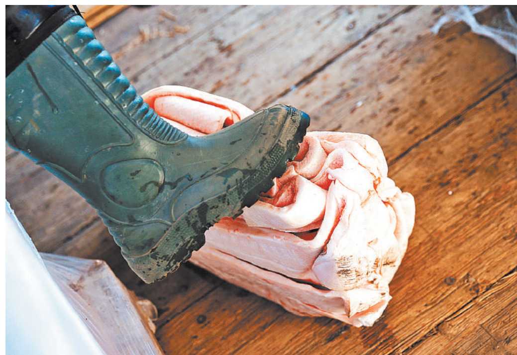
Как ни печально, но домашние вкусности подлежат уничтожению на границе стран ЕАЭС.

По закону штраф может составить от половины до дву-