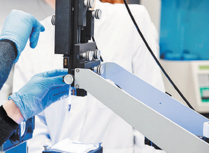
МАРИЯ БУХАНОВСКАЯ / ГЛОБАЛNEWS

Говоря образно, вы намерены создать вокруг вуза бизнес-экосистему. А у вас уже есть такой опыт? Ведь пока бизнес не удается вовлечь в нашу науку.