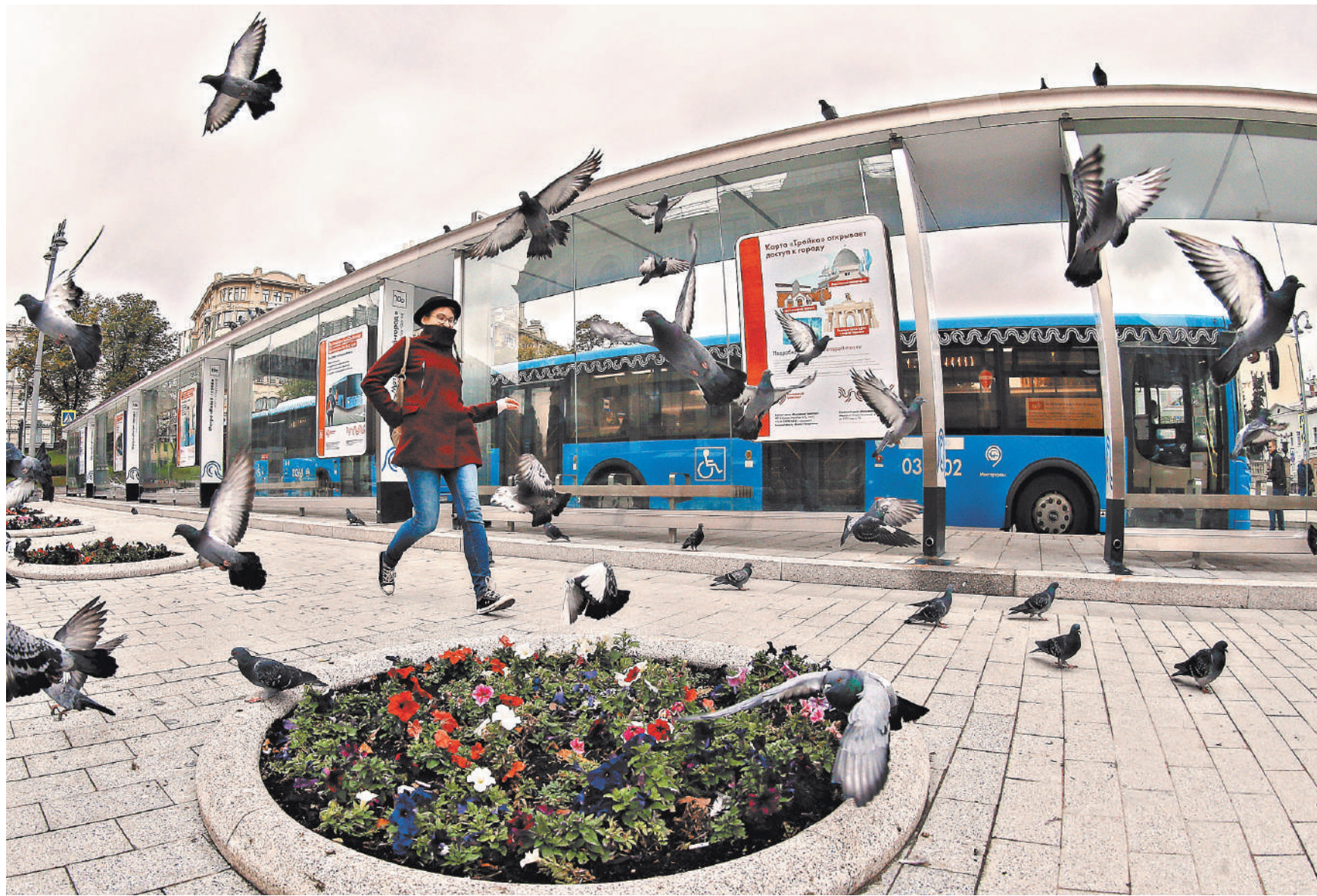
Изменения коснутся автобусных маршрутов в центре и на юге города. Главная цель — ускорить общественный транспорт.