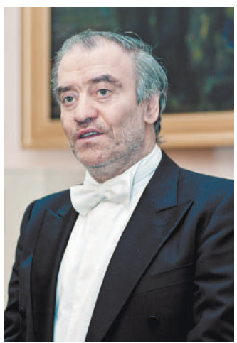
Для первого концерта в новом зале Валерий Гергиев выбрал интереснейшую программу.

Именно через этот холл Е публика попадает в новый концертный зал.