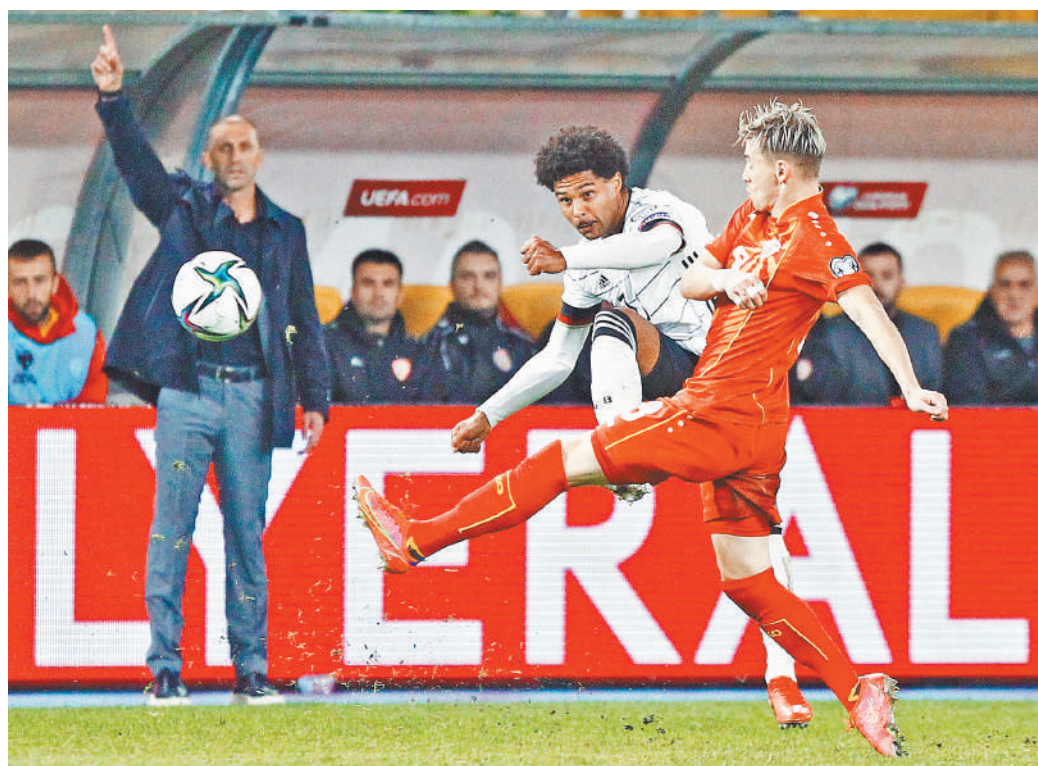
После неудачи на Евро-2020 сборная Германии потихоньку возвращается на прежний уровень.

Первое место в опросе занял российский вратарь «Тампы» Андрей Василевский. Следом расположились: Коннор Хеллбайк («Виннипег»), Марк-Андре Флери («Чикаго»), Кэри Прайс («Монреаль»), Джон Гибсон («Анахайм»).