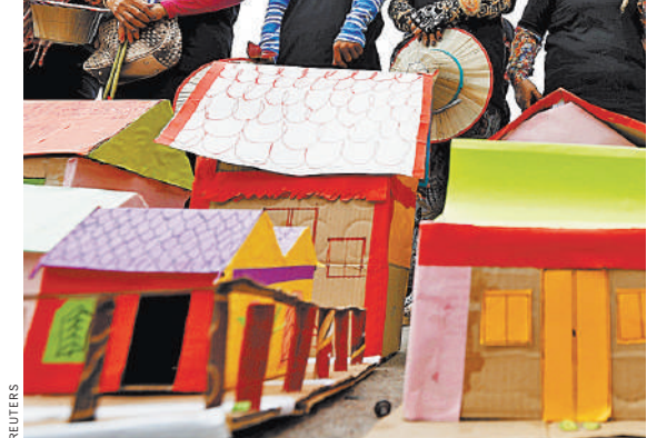
При покупке вторичного жилья лучше сначала подписать акт о передаче его в собственность, а затем — зарегистрировать.

Суд решил, что права истицы нарушил не факт торгов и договора с новым покупателем, а регистрация права собственности. «Она была осуществлена безосновательно и привела к тому, что юридическая судьба квартиры была решена вопреки воле собственника, оставшегося лишь фактическим владельцем», — сказано в определении. По мнению ВС права собственности нового владельца на квартиру никогда не возникло. Постановления судов апелляционной инстанции и округа полностью отменили, а определение первой инстанции отменили в части: требование о признании права собственности нашей героини на квартиру суд направил на новое рассмотрение. Там суд предстоит привлечь в качестве ответчика последнего правообладателя квартиры, оценить его действия в рамках очередной сделки с имуществом уже в процессе суда и разрешить вопрос о признании права собственности первоначальному владельцу на спорное жилье.