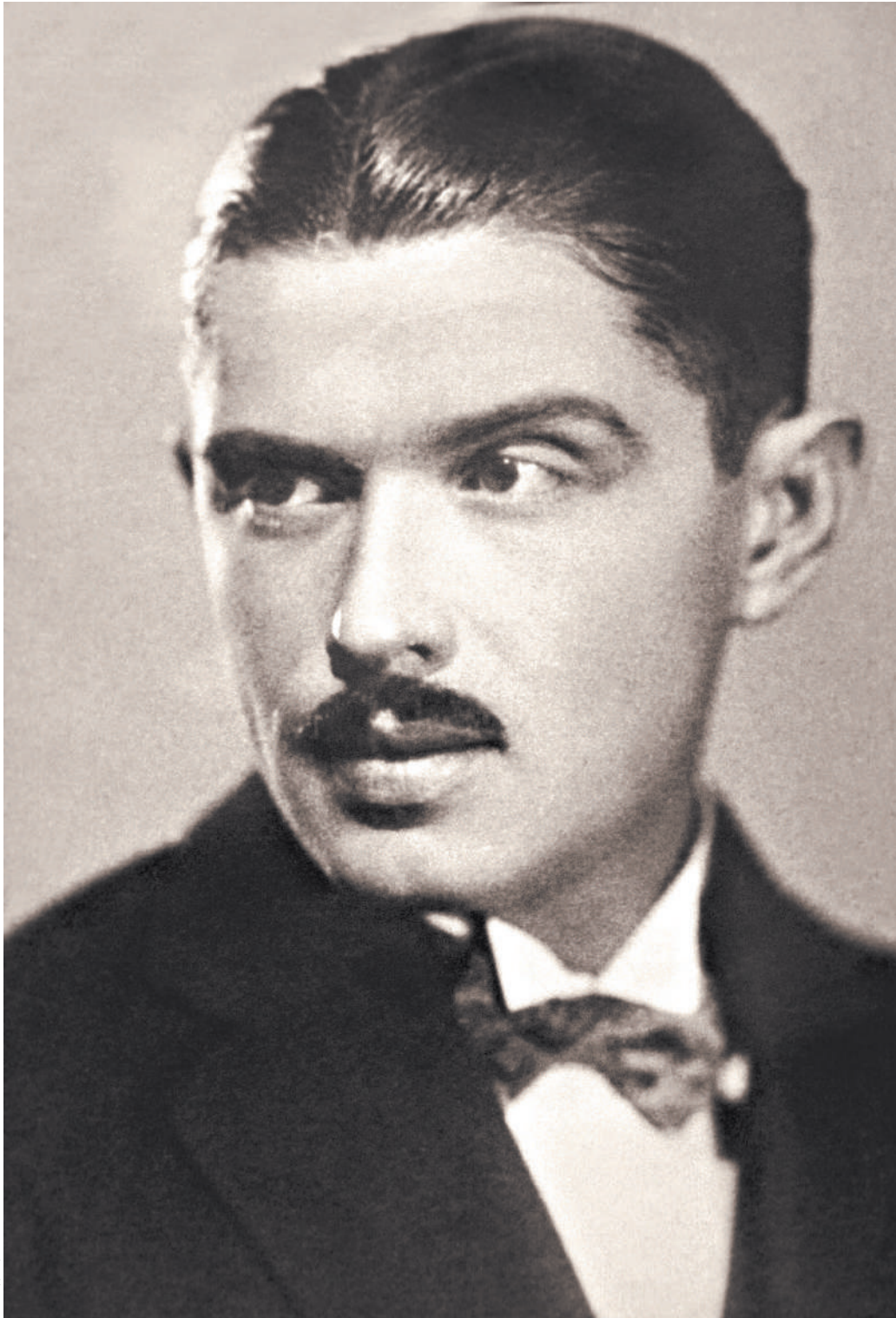
Разведчик, писатель, художник, врач — и это все он, Дмитрий Быстролетов.

В Челябинске открыт памятник ранее абсолютно неизвестному герою — нелегалу Исхаку Ахмерову. Что он сделал? А если скажу, что во многом предвосхитил нападение Японии на СССР в предвоенные годы? В