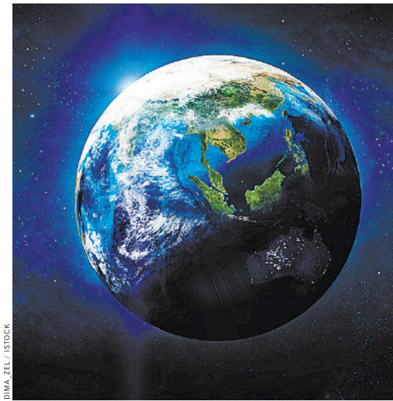
Странное потемнение Земли тревожит специалистов, так как может быть связано с климатическими явлениями.