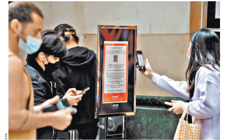
В торговые центры австралийского Сиднея QR-коды только после подтверждения вакцинации через систему ПЦР-кодов.