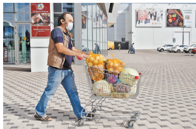
От роста мировых цен на продовольствие нам никуда не деться. Но минимизировать их для отечественного рынка власти пытаются.