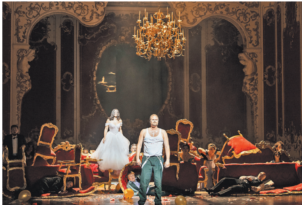
Считать со сцены не только сюжет романа Толстого, но и оперу Прокофьева затруднительно.

Дирижерская работа аргентинца, что с первых аккордов отличается киксами духовых, ахиллесова пята постановки. Он руководит оркестром так, словно музыка Прокофьева — легкая оперетта с незначительными вариациями. Гремучая смесь фальши будто нарочно «маскирует» глубинные смыслы и, по сути, беззащитную искренность прокофьевской музыки, что делает ее запредельно пронзительной: мажор неизбежно поглотит каждого. ●