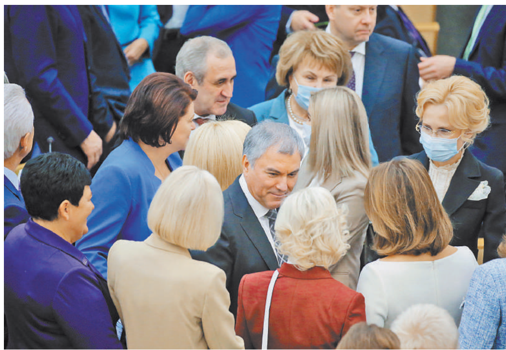
Вячеслав Володин снова избран спикером Госдумы. За его кандидатуру проголосовали 360 депутатов из 450.