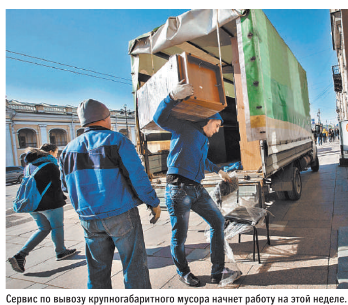
Сервис по вывозу крупногабаритного мусора начнет работу на этой неделе.

Кстати, пока городской сервис не заработал, заказать контейнер на 8 кубометров для вывоза крупногабаритного мусора той же мебельной стенкой обойдется минимум в 7 тысяч рублей. Если мусора больше, контейнер погрузкой на 20 кубометров будет стоить уже 16 тысяч рублей.