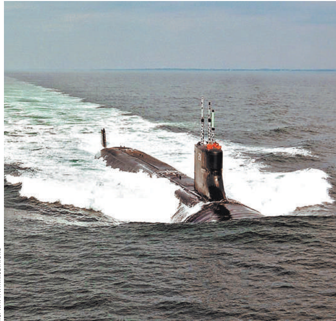
Весь экипаж вновь собран на подлодке, сохранившей реакторный отсек в рабочем состоянии.

Двум из 11 моряков, пострадавших во время тарана Connecticut (предположительно затонувшего судна, грузового контейнера или подводной горы), пришлось оказывать медпомощь на берегу. Утверждается, что в настоящее время