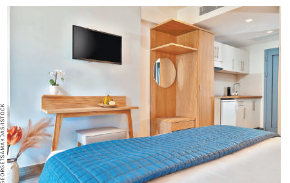
Миниатюрные студии часто похожи на стандартные гостиничные номера.