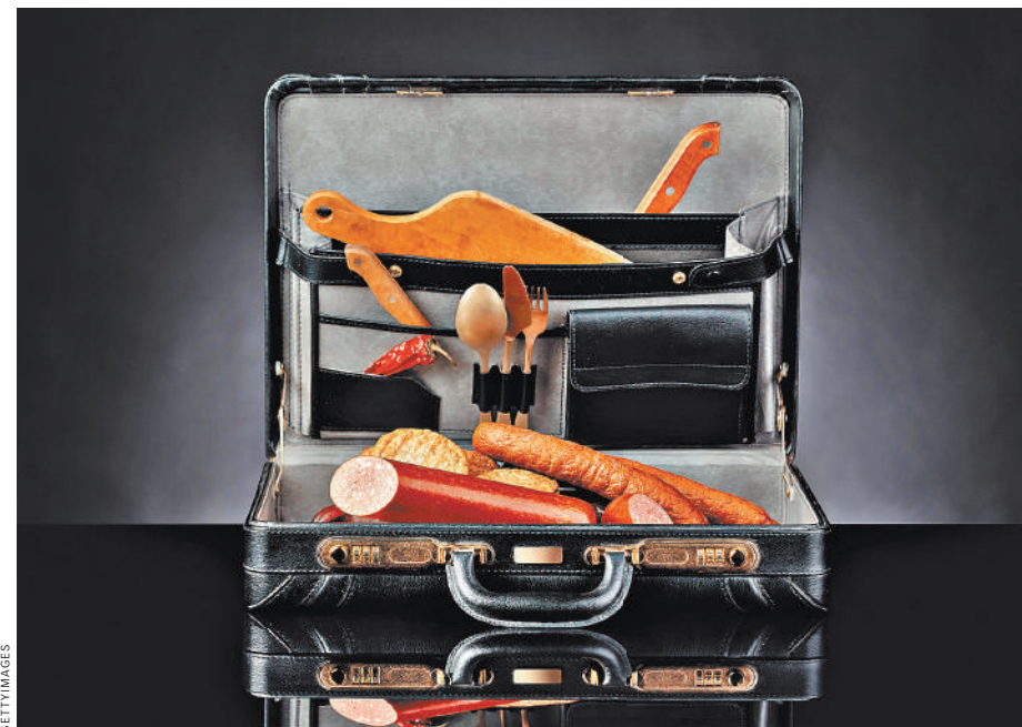
Чемодан с домашними вкусностями запрещено ввозить в Россию из стран, не входящих в ЕАЭС.