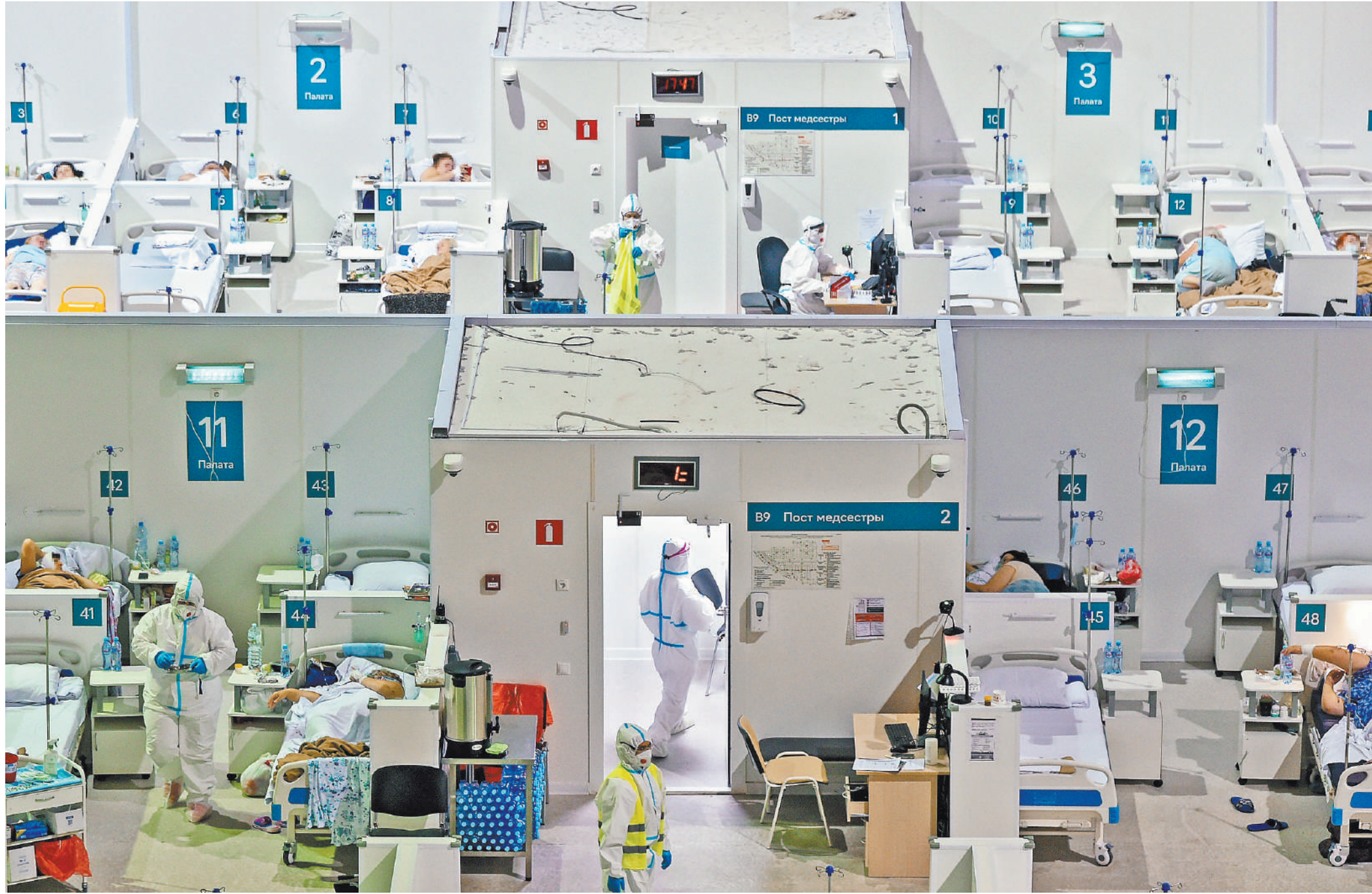
Ситуация с ковидом в Москве остается сложной: за последние две недели заболеваемость выросла в полтора раза, а число госпитализаций удвоилось.

Заболевших коронавирусом опять стало больше, и российские регионы вынуждены ужесточать антиковидный режим. При этом вводить полный локдаун никто не собирается. Пока санитарные власти ограничиваются обязательной вакцинацией, QR-кодами, переводом на удаленку школьников, студентов, пенсионеров.