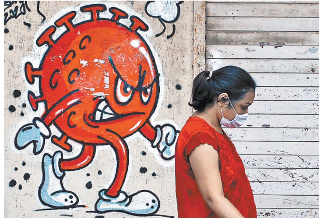
Прививка защищает от тяжелого течения болезни, но не может служить защитой от заражения.