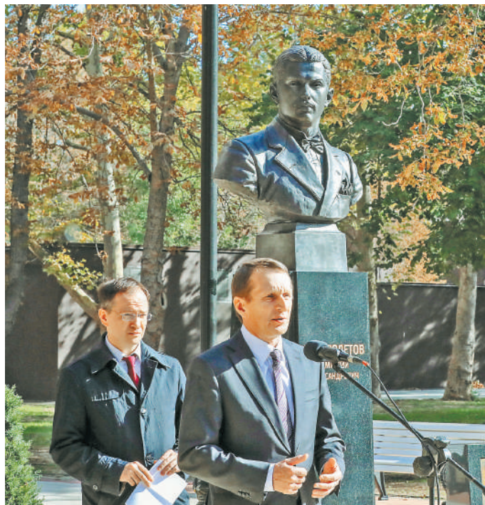
В открытии памятника легендарному советскому разведчику Дмитрию Быстролетову в Симферополе приняли участие председатель Российского исторического общества, директор Службы внешней разведки России Сергей Нарышкин, глава Российского военно-исторического общества и помощник президента РФ Владимир Медведский (слева) и другие почетные гости.

Благодаря ему Дмитрий Быстролетов, прошедший все круги радости и ада, дожил почти до 75 лет. И возвращается к нам книгами, пусть и малыми тиражами, но издающимися. А теперь вот и памятником. ●