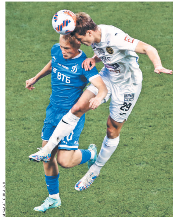
Футболисты «Динамо» смогли одержать волевою победой над земляками армейцами.

* Без учета матча «Сочи» — «Урал» (состоялся вечером).