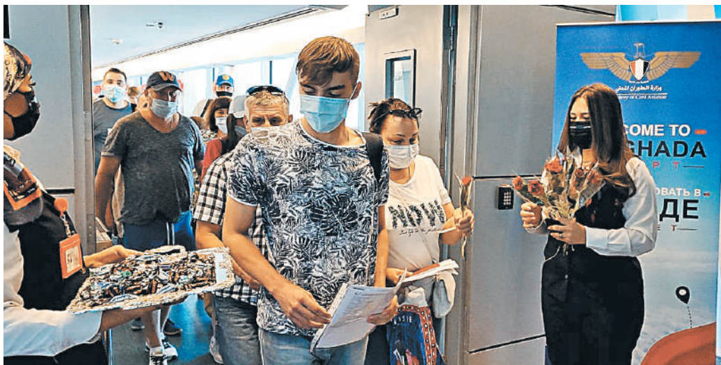
В аэропорту Хургады прилетевшим туристам дарили цветы и всех гостей угощали конфетами.