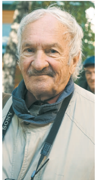
Каждый, кто читал Лихоносова, знает, что его проза сродни поэзии.

Почему именно в этой рубрике? Каждый, кто читал книги Лихоносова, согласится, что его проза сродни поэзии. Это та же музыка слова, которая пленяет нас в Пушкине и Бунине. Не случайно вдова Бу-