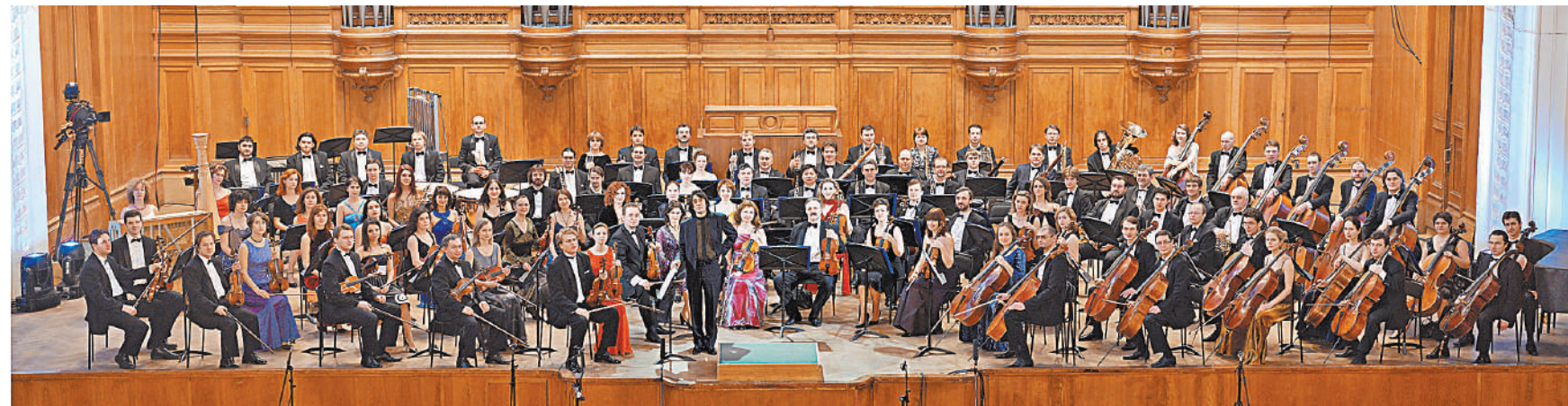
Оркестр «Новая Россия» и Юрий Башмет: Мы берем за основу нашей версии «Онегина» только хиты из этой оперы — хотя именно у Чайковского проходных нот не бывает.

ЮРИЙ БАШМЕТ. Идея такого синтеза, когда это и не театр, и не опера, и не стихи, и не музыка в чистом виде, — сама по себе оригинальна. Весь спектакль прекрасно театрализован талантливейшим, музыкально одаренным Костей Хабенским. Что может увидеть юное поколение? Прежде всего они узнают, кто кого любил и кто кого убил. Кто еще не готов «проглотить» эту великую музыку и великий текст — тот уже будет по крайней мере заинтересован!