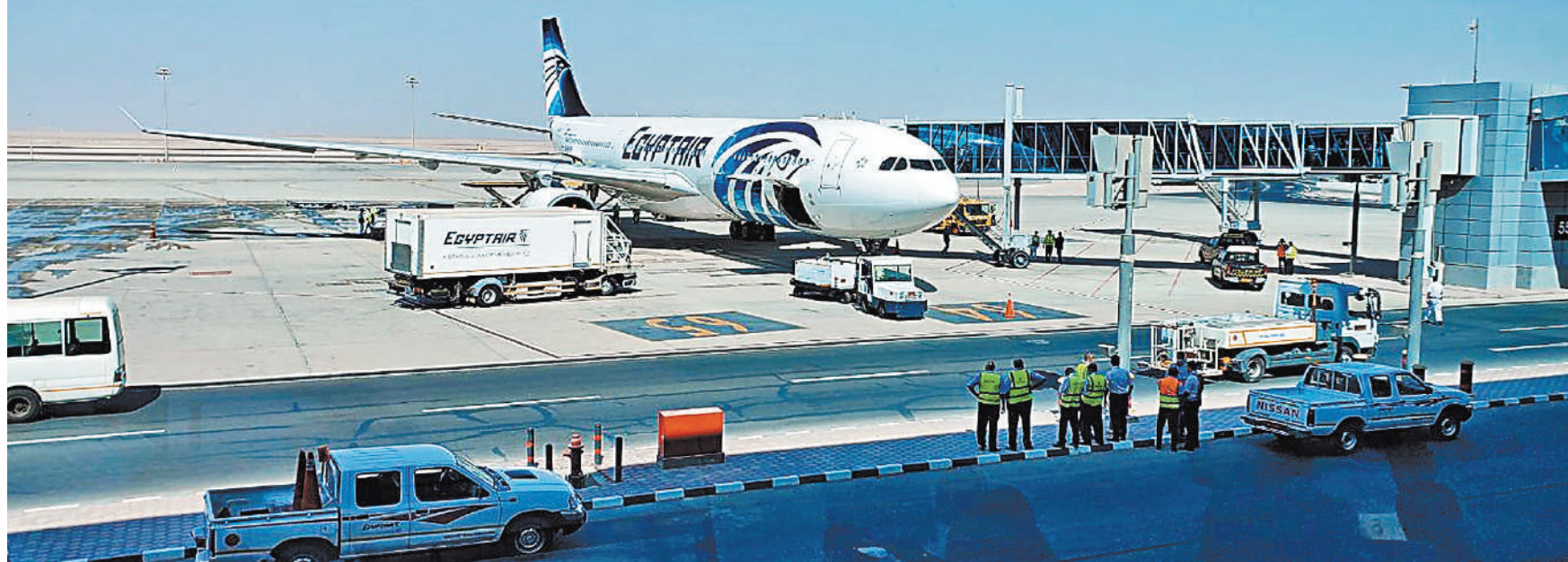
Рейсы в Египет на паритетной основе пока выполняют два перевозчика: с нашей стороны авиакомпания «Россия», а с принимающей — Egyptair.

В июле президент Владимир Путин отменил указ, запрещавший полеты на египетские курорты. Также сняты рекомендации туроператорам и агентствам воздержаться от продажи туров. Первый рейс в Шарм-эш-Шейх тоже прибыл 9 августа. Как рассказали представители туристической индустрии, свободных мест на первых отправившихся на Красное море самолетах нет. При этом на самом курорте пока раздолье: по словам отельеров, отели заполнены на 30–40%, по ощущениям туристов — на 10–15%. Все меры безопасности строго соблюдаются: персонал не снимает масок, их, как и санитайзеров, вдоволь на каждом углу. В ресторанах, где «все включено», еду невозможно набрать самостоятельно, ее подают сотрудники ресторана.