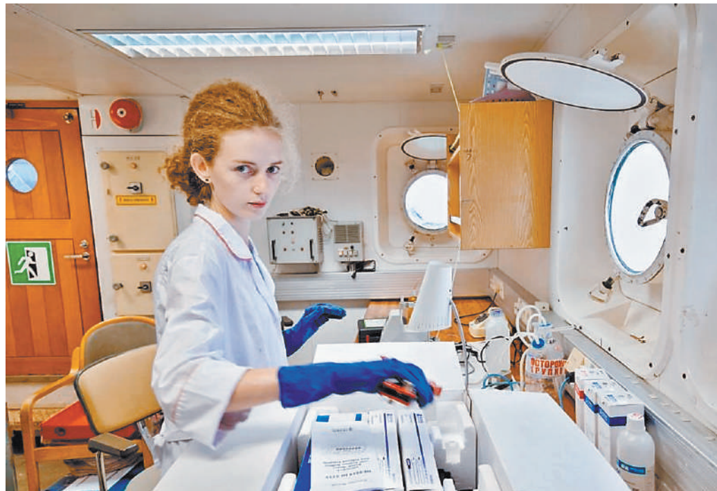
Непредвиденная задержка в порту Архангельска внесла коррективы, но не поменяла рабочих планов экспедиции.