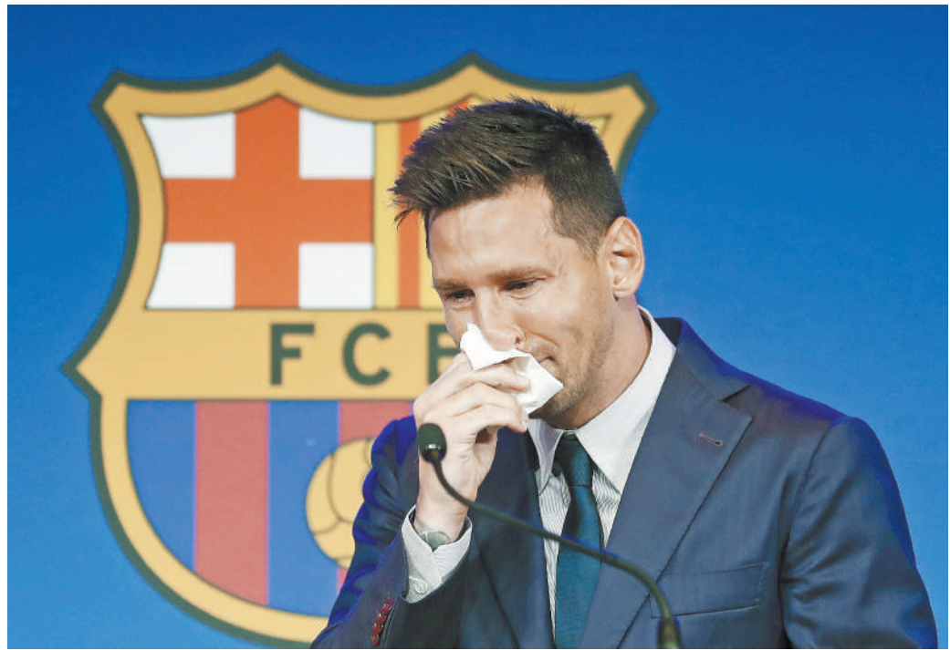
Лионель Месси оформил развод с «Барселоной». Теперь его ждут в Париже.

Месси подтвердил. «У клуба накопился долг, руководство не хочет уступать. Я прило-