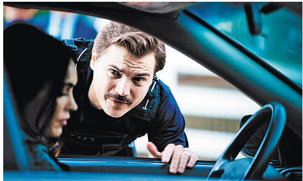
Эмиль Хирш в роли копа Байрона и Меган Фокс в роли пуленепробиваемой агентессы ФБР Ребекки Ломбардо.

всем этим наслаждаться. Не фильм, а коллекция перверсий. Изобретатели сего сюжета много видели разного кино, накопили впечатлений и стереотипов, но очень мало умеют. В результате герои постоянно попадают в ловушки собственной глупости. Самоуверенная и на взгляд пуленепробиваемая оказывается жертвой, как бы решительный герой Эмиль Хирша демонстрирует все качества растапы — и все это не потому, что так задумано, а потому, что авторы не умеют просчитать на два хода вперед и разработать логику характеров. Уже поэтому с этими персонажами невыразимо скучно. Хотя мощь наших условных рефлексов, выработанных обещанием с триллерами-хоррорами, такова, что даже сознавая всю бредовость ситуаций, все равно внутренне сжимаешься, едва слыша сверхнизкие частоты пугающей музыки и страшные шорохи прося в полутьме. Называется — саспенс.