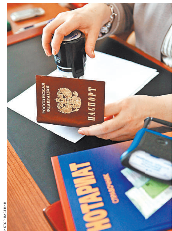
Верховный суд подчеркнул — невнимательность нотариуса может обойтись ему очень дорого.

Пришлось просить суд о помощи, и этот труд взяла на себя опекушка нашего героя, так как его болезнь вернулась. Вот что всплыло в суде. Оказалось, что к петербургскому нотариусу пришел некий мужчина. У него на руках был поддельный паспорт хозяина акций. Выяснилось, что документа с такими данными не существует. Да и подпись в этом ненастоящем паспорте была похожа на настоящую подпись потерпевшего.