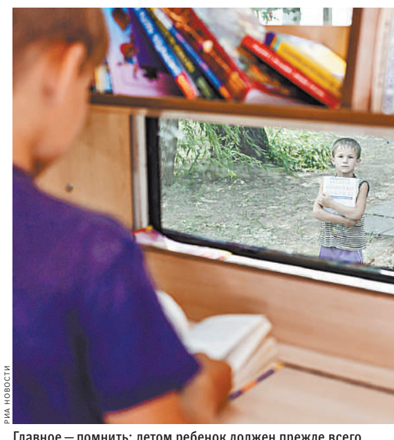
Главное — помнить: летом ребенок должен прежде всего отдыхать. Гулять, бегать, прыгать.