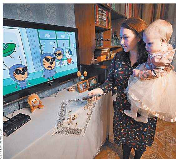
Психологи советуют показывать детям больше мультфильмов. И желать позитивных.

Психологи МЧС России рекомендуют родителям для более легкой адаптации детей к самоизоляции в условиях пандемии коронавируса создать им островки постоянства и разрешить подольше посмотреть любимые мультфильмы. Это помогает адаптироваться к непривычной ситуации.