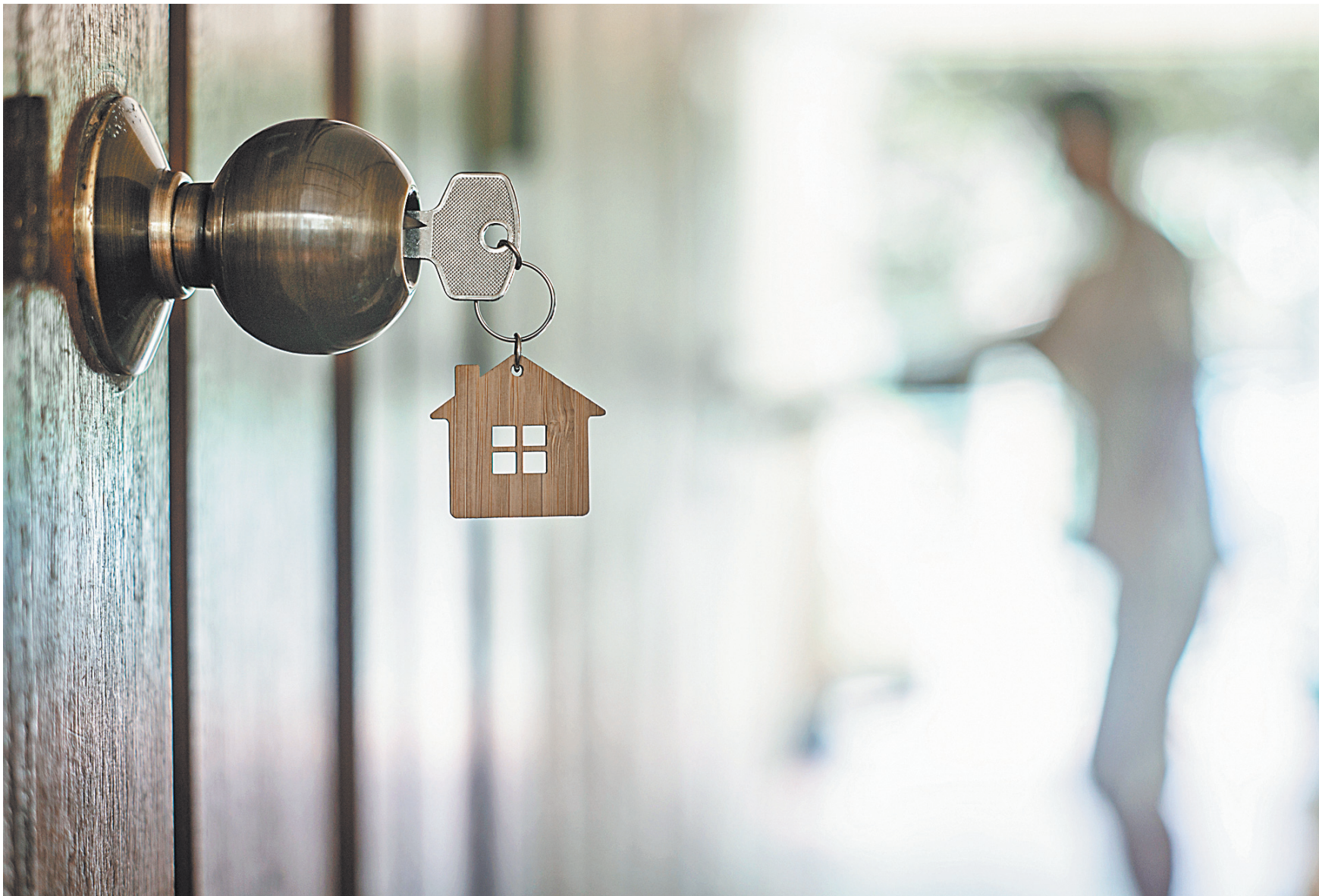
Последние сто лет Россия шла по пути уплотнения и централизации городов, пандемия коронавируса возродит концепцию распределения населения по средним и мелким городам.

Впрочем, в условиях пандемии коронавируса возможности госпрограммы ограничены. В начале апреля правительство подготовило пакет постановлений о корректировке отдельных госпрограмм. Увеличение финансирования подразумевает по тем из них, которые касаются поддержки отраслей, пострадавших от пандемии коронавиурса.