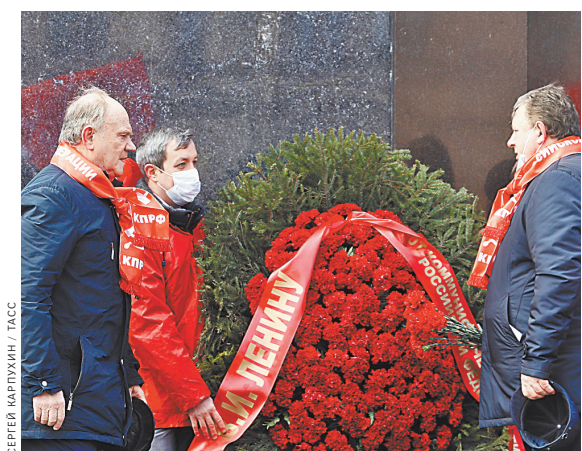
Геннадий Зюганов и участвовал в возложении венков и цветов к Мавзолею Ленина на Красной площади.

Сайт КПРФ сообщает о юбилейных мероприятиях и в регионах. Так, партийцы вывешивали из окон квартир и домов красные флаги, проводили одиночные памятные акции с возложением цветов к памятникам Ленина, а также слеты в онлайн-формате. Накануне этой даты Геннадий Зюганов провел Всеобщее торжественное собрание, посвященное юбилею Ленина в формате видеоконференции. ●