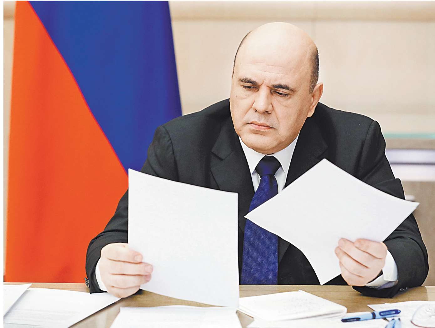
Михаил Мишустин заявил, что в некоторых регионах есть проблемы с медоборудованием.

Для этого также должны быть сформированы специальные медицинские бригады, укрупненные достаточным количеством врачей и