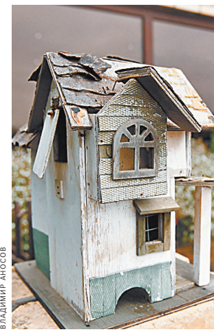
Те, кто еще вчера не представлял свою жизнь без городской суеты, сегодня присматривают себе дома.

По мнению архитектора, очевидно, что после эпидемии возрастает ценность пригородного жилья — со сниженной этажностью и пониженной плотностью населения. «В Москве продают квартиры площадью 11 метров. Вы представляете, как провести в такой квартире самоизоляцию? А на те же деньги в маленьком городе можно построить дом», — говорит эксперт.