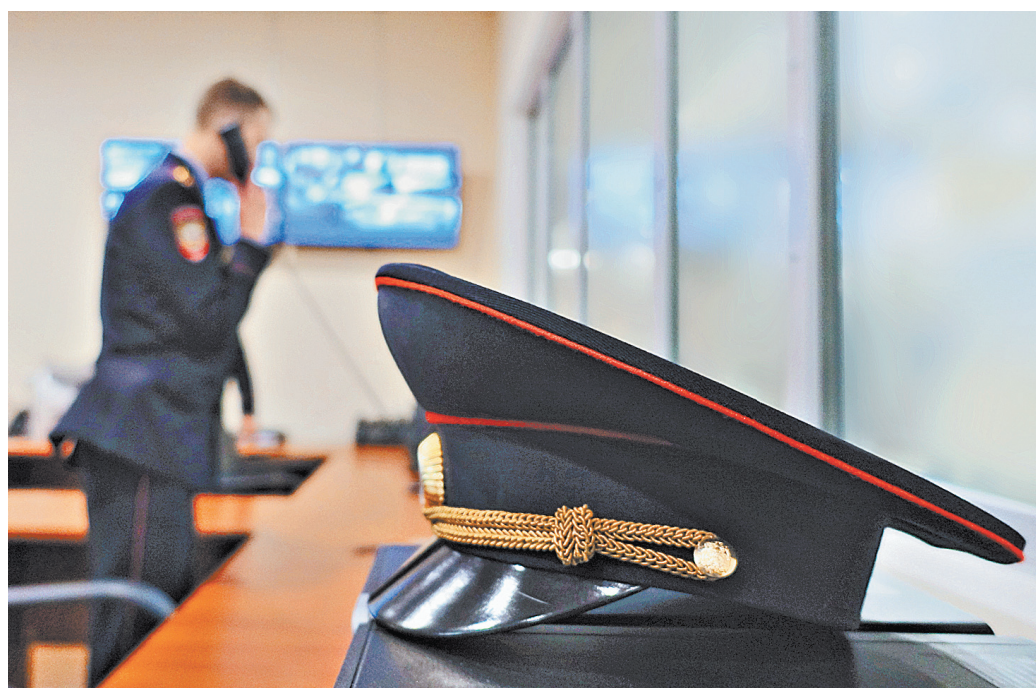
В экстренных ситуациях полицейские смогут вскрывать чужие автомобили, а при нападениях — применять оружие.

— Законопроект читайте на сайте rg.ru/sujet/4255