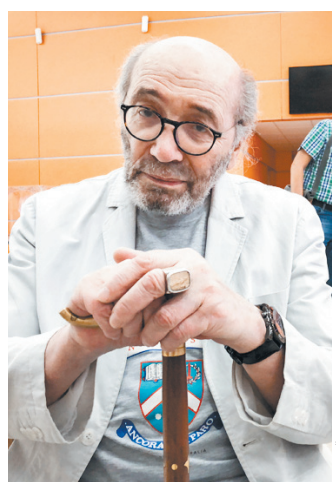
Александр Кабаков не был пророком, но он глубоко чувствовал наше время.

Известность ему как писателю принесла повесть 1990 года «Невозвращенец», экранизированная годом позже. Напомним, кто забыл: «Невозвращенец» был написан в жанре антиутопии. Главный герой, ученый-экстремолог, по заданию секретных органов попал в недалеком будущем с целью его описания. Будущим был 1993 год. И там происходили всяческие ужасы: голод, мятежи, бесцельные расстрелы и прочее. По центральному проспектам и площадям столицы бегали толпы погромщиков, антисемитов и разных радикалов из новообразованных партий. Войска железной рукой пытались сдерживать беспорядки, вселяя еще больший страх в напуганных людей. Все это как нельзя лучше отводило общественному сознанию конца 80-х, когда эйфория от «перестройки» начала сменяться предчувствием катастрофы, связанной с развалом великой империи. Кабаков не ошибся и даже в точности попал в роковой год: 93-й.