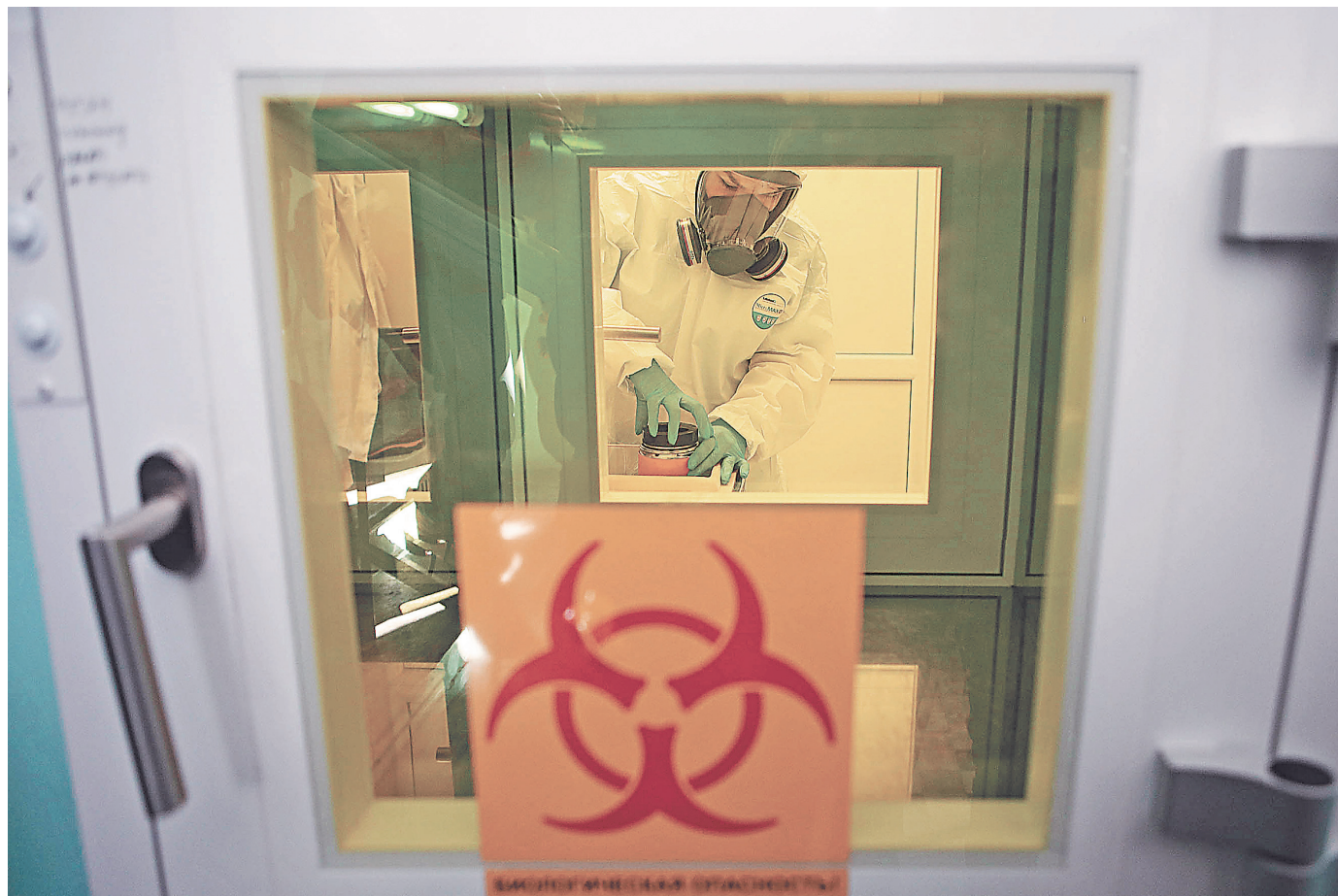
Поиски лекарства против коронавируса ведутся в тесном контакте с органами здравоохранения и учеными из других стран.