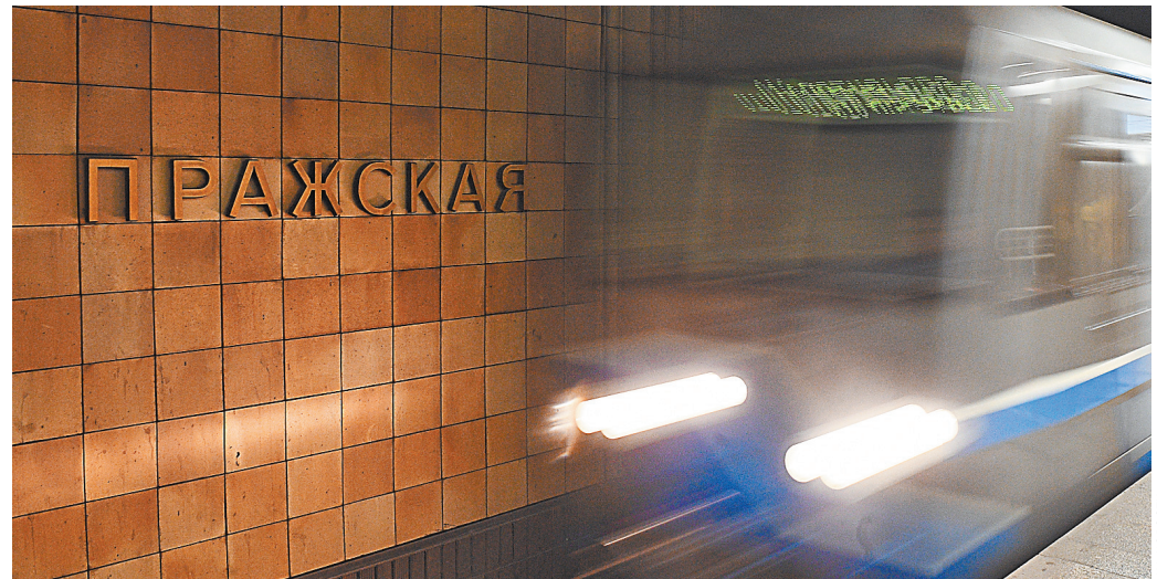
Москва. Станция метро «Пражская». Станцию «Переименование» мы уже проехали.

Памятник Коневу был открыт в Праге 9 мая 1980 года в знак благодарности жителей маршалу, который при освобождении города от фашистов не применил тяжелую артиллерию и сохранил красавицу Злату Прагу.