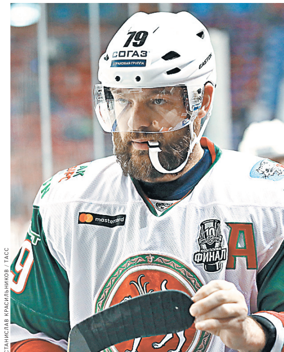
Марков был одним из самых ярких российских игроков в НХЛ.

Андрей Марков: Сначала нужно переждать пандемию и позаботиться о родных, семье, самом себе