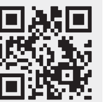
Последние новости о коронавирусе — на сайте «РГ».

На 19 апреля в России зафиксировано 42 853 случая заражения коронавирусом, сообщила оперштаб по коронавирусу. За двое суток было подтверждено 10 845 новых случаев в 78 регионах (4785 человек к 18 апреля и 6060 человек к 19 апреля). Из них на Москву пришлось 2649 и 3570 заразившихся соответственно. Всего в столице выявлено 24 324 зараженных. За весь период выздоровели 3291 человек, умерли 361.