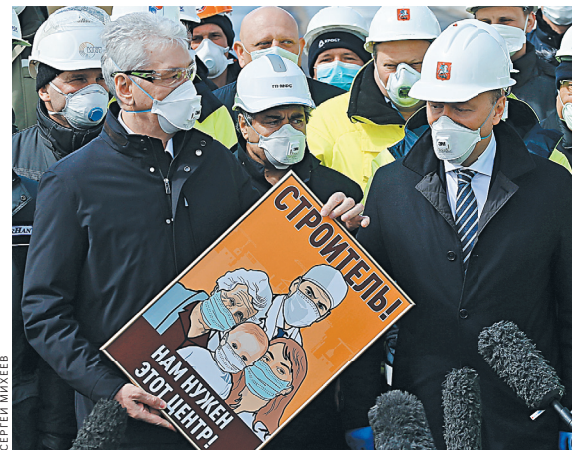
Мэр Москвы Сергей Собянин. Строители за месяц с небольшим возвели не временный госпиталь, а полноценную больницу.