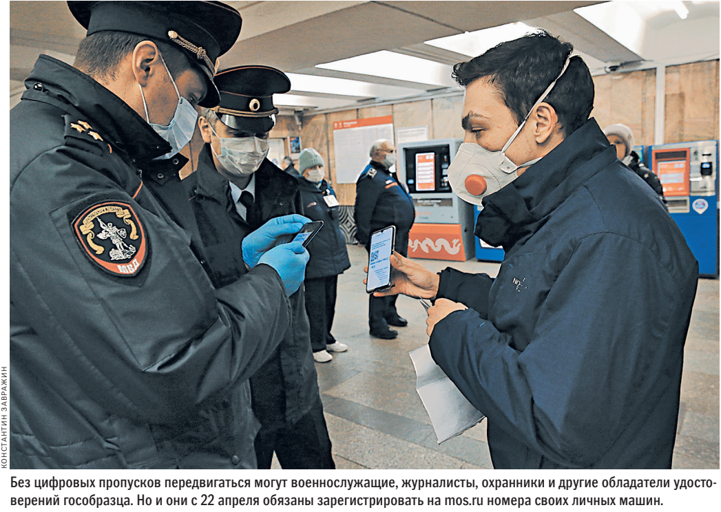
Без цифровых пропусков передвигаться могут военнослужащие, журналисты, охранники и другие обладатели удостоверений гособразца. Но и они с 22 апреля обязаны зарегистрировать на mos.ru номера своих личных машин.