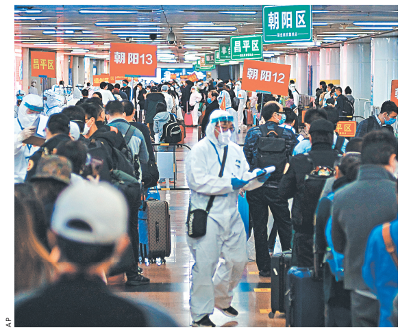
В Ухани сняли запрет на выезд из города, желающих покинуть эпицентр эпидемии оказалось очень много.

УХАНЬ — ЗОНА НИЗКОГО РИСКА Город Ухань, с которого началось распространение коронавирусной инфекции, объявлен районом низкого риска. Теперь в провинции Хубэй больше не осталось городов и районов с высоким и средним уровнем риска, следует из заявления штаба по профилактике и контролю за распространением COVID-19 в провинции Хубэй.