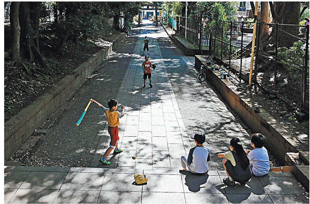
В солнечные дни на улицах и в парках в Токио до сих пор бывает многолюдно и резвятся дети, ведь режим ЧС в стране во многом носит рекомендательный характер и рассчитан на самодисциплину граждан.

Наиболее изобретательные японцы вышли из положения забавным способом. Люди устанавливают туристические палатки на балконах или прямо в жилых комнатах. Идея особенно прижилась по душе детям. Ребята забираются в импровизированные укрытия со всем своим скарбом: игрушками, сладостями и одеялами. А в местных магазинах с удивлением отмечают, что продажи палаток в последнее время выросли сразу в несколько раз. Есть и отдельные виды тентов кубической формы для офисных работников. Там можно уединиться в тишине с небольшим столом, креслом и ноутбуком.