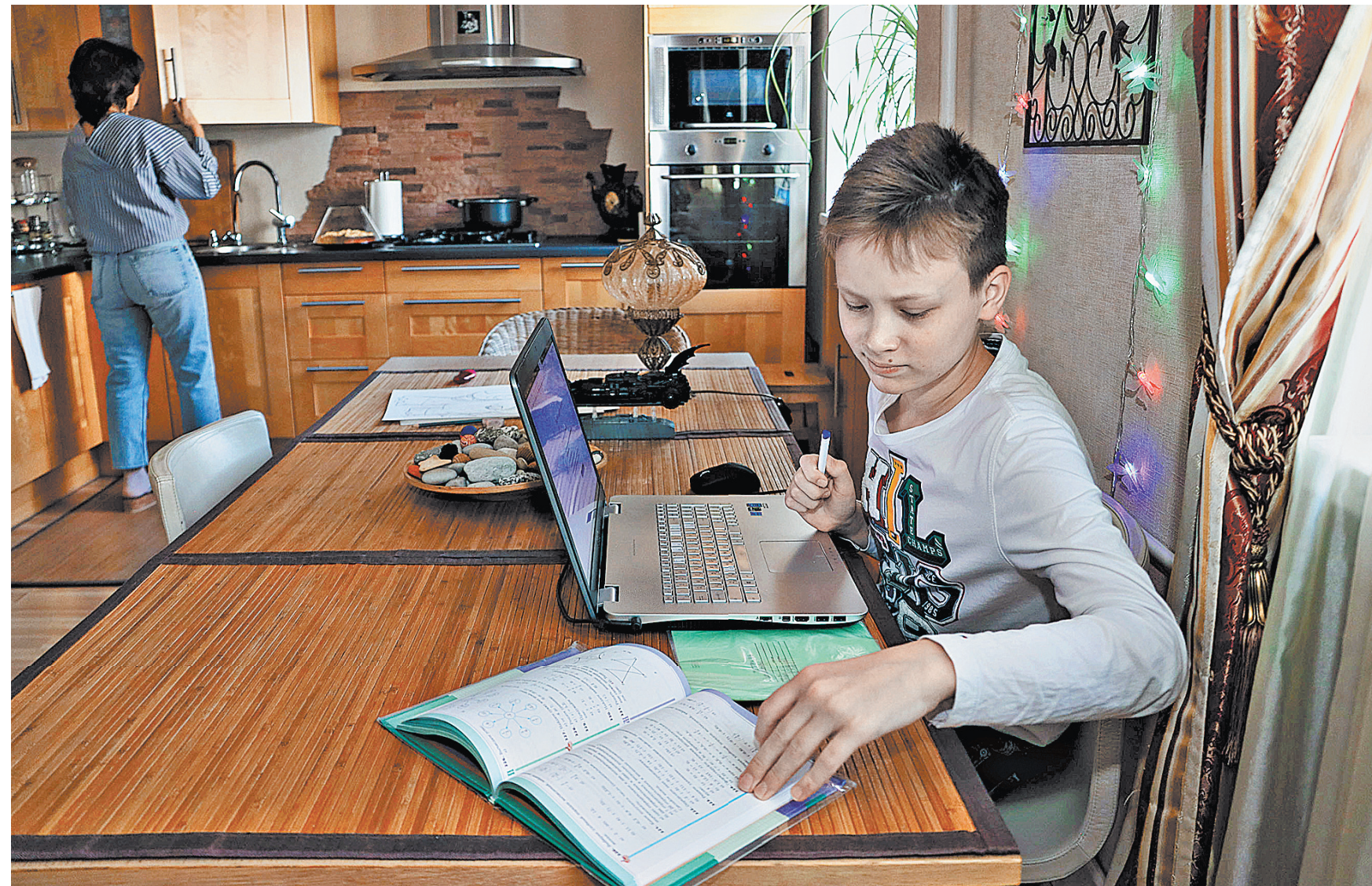
Почти одновременно вся страна перешла на домашний режим и начала осваивать гаджеты. Больше всего досталось школе. Далеко не все родители оказались готовы проводить 24 часа со своими детьми. Калужский министр образования посоветовал взрослым выйти из зоны комфорта и взять на себя функции учителя. Как в регионах проходит внешнее обучение, рассказали корреспонденты «Российской газеты».

Почти 500 сельских школ Новосибирской области возобновили обучение в очной форме. В них учатся более 40 тысяч учеников. Уроки проводятся в небольших группах, это позволяет обеспечить дистанцию между учащимися.