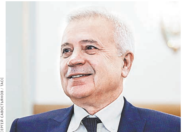
Вагит Алекперов прошел путь от простого оператора по добыче нефти и газа до главы крупнейшей частной нефтяной компании России.

Редакция «Российской газеты» поздравляет Вагита Юсуфовича с юбилеем. ●