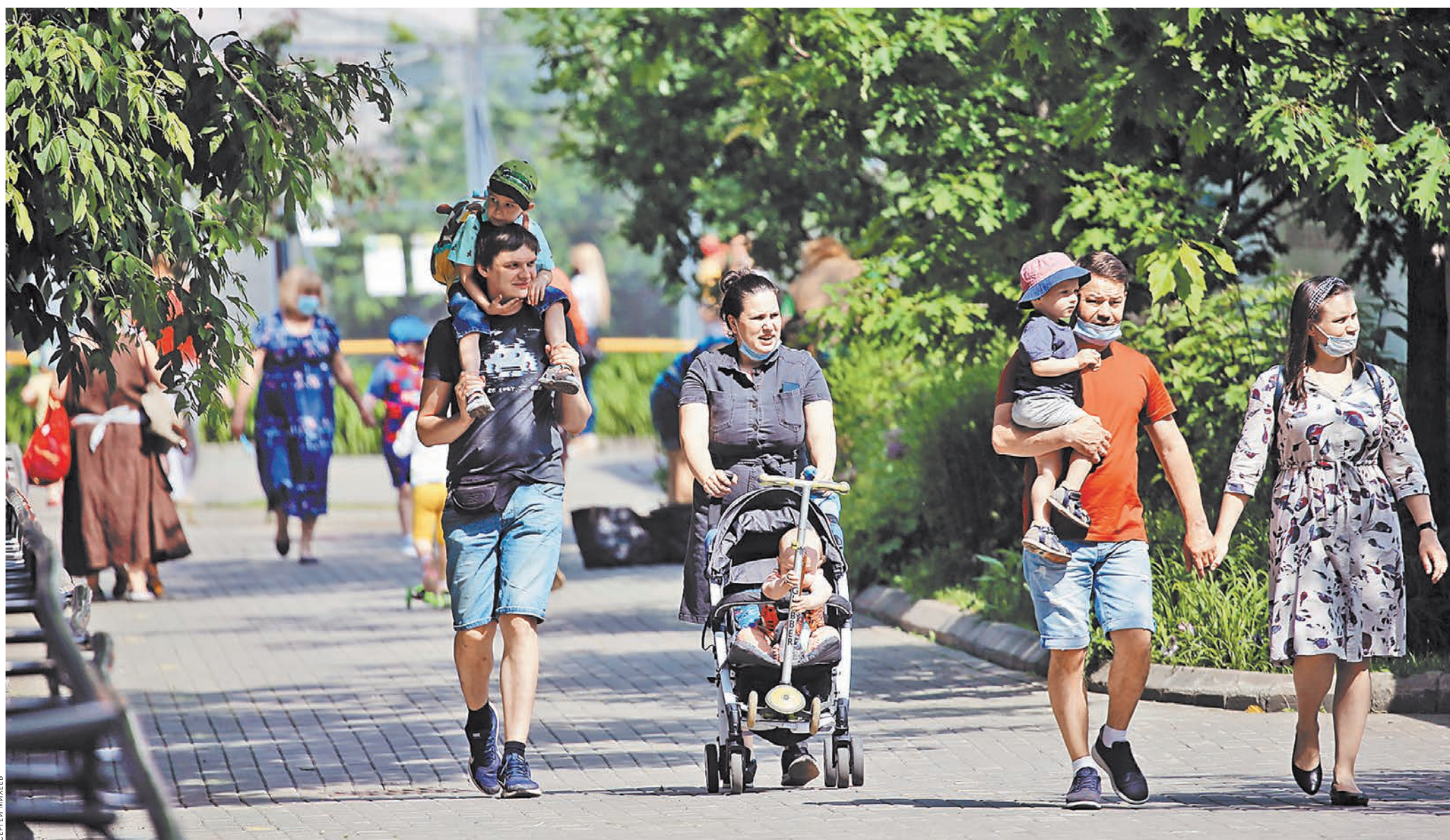
В июне и июле всем семьям, независимо от уровня их дохода, правительство назначило две выплаты на детей — по 10 тыс. руб. на ребенка. Первая выплата — на детей в возрасте от 3 до 16 лет, вторая — от 0 до 16 лет. Общая сумма выплат с учетом пособий по 5 тыс. рублей детям до 3 лет составила 570 млрд рублей. Те, кто по каким-то причинам до сих пор не обратился за назначением выплат, могут подать заявление на сайте госуслуг до 30 сентября. В кризис эти выплаты не только поддержали доходы конкретных семей, но и помогли экономике, смягчив падение потребительской активности.

С 1 сентября меняются правила профилактических осмотров школьников, которые проводятся ежегодно для борьбы с подростковой наркоманией. Так, расширен перечень запрещенных веществ, на которые исследуют пробы, взятые у детей. В него вошли опиаты, кокаин, метадон и др. Сами исследования должны быть выполнены в течение двух часов с того момента, как получен биологический материал. Даже если предварительный результат анализов отрицательный, но нарколог заподозрит у ребенка признаки наркотического опьянения, он может направить подростка на повторный осмотр в специализированное учреждение. При этом должно быть обнаружено не менее трех признаков, свидетельствующих о пагубном пристрастии, — неестественная походка, неадекватность, сонливость или заторможенность, вялая реакция зрачков на свет, нарушение речи. О результатах тестирования несовершеннолетних будут оповещать родителей. Раньше даже ближайшим родственникам информацию о здоровье подростка не сообщали, если ему исполнилось 15 лет. ●