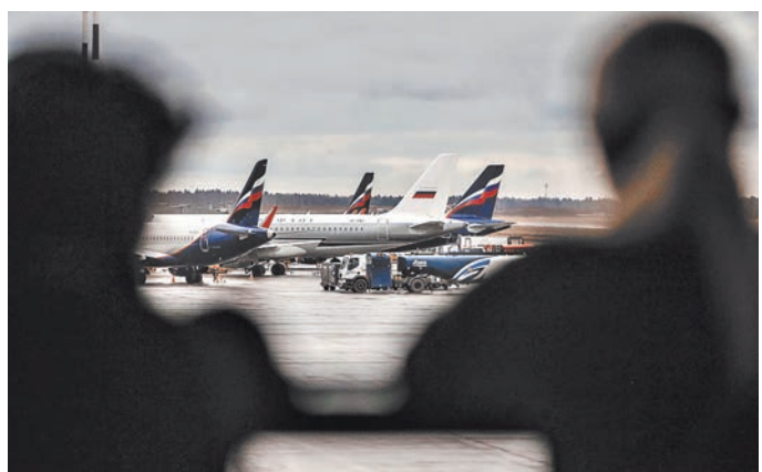
Перед туристами выбор: получить обратно деньги либо отправиться в другое равноценное путешествие.

Читайте документ на сайте rg.ru/dok/1835614