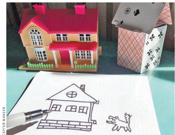
Мало нарисовать дом. Его надо еще и построить. И только тогда можно будет оформить квартиру в собственность.

И начались судебные процессы. Местные три суда пошли пострадавшим навстречу. Но Верховный суд РФ с такой щедростью не согласился. Суд растолковал своим коллегам, что если застройщик обанкротился и не закончил дом, то дольщики по закону не могут получить право собственности в недостроенном доме.