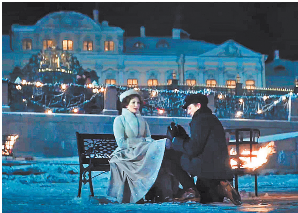
Фильмом открытия станет картина «Серебряные коньки» режиссера Михаила Локшина.