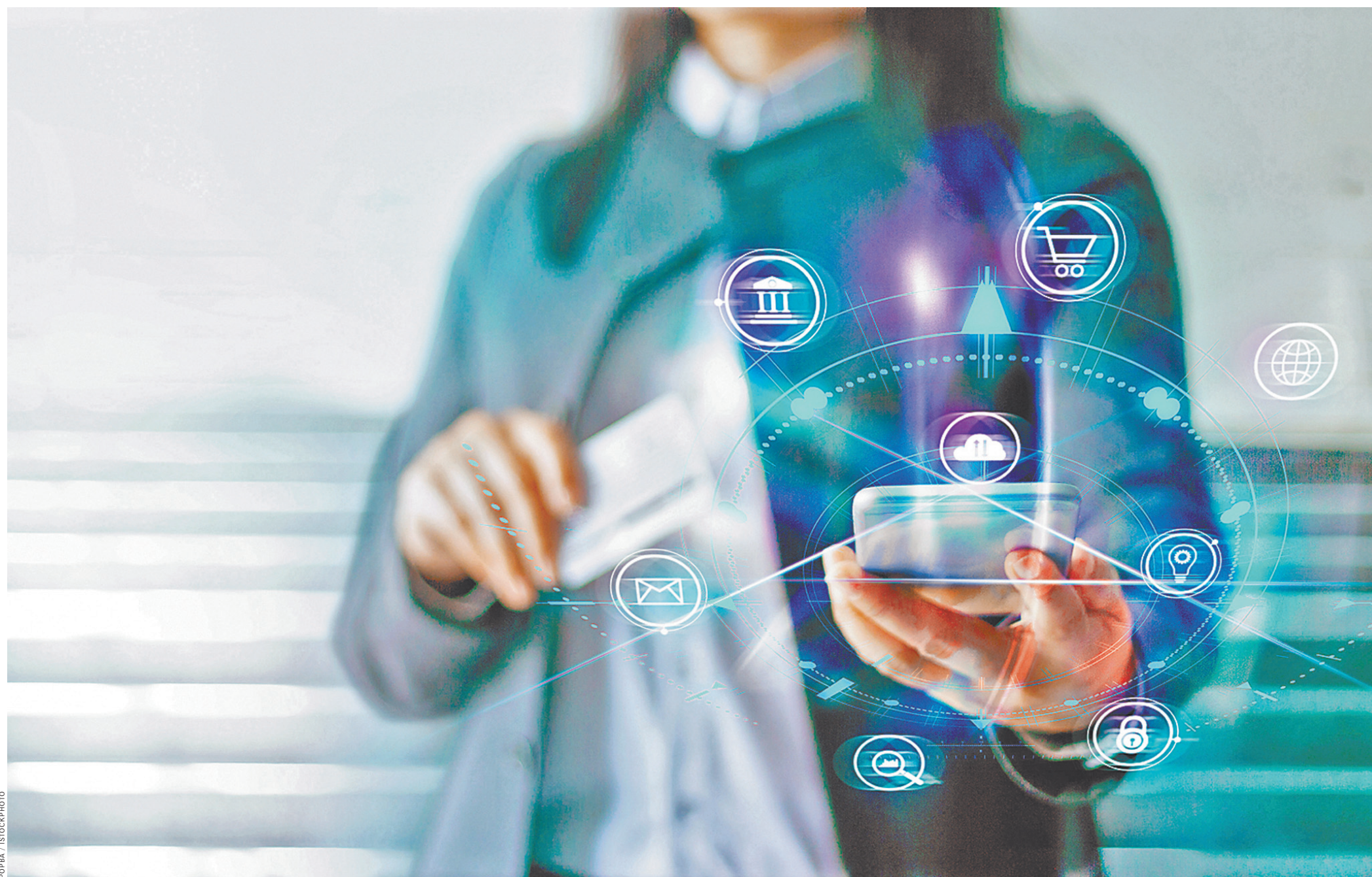
Граждане, имеющие право на бесплатные социальные услуги (например, на санаторно-курортное лечение, паллиативную медпомощь), смогут выбирать, где их получить — в привычном государственном учреждении или в специально отобранной частной компании. Той компании, которую выберет человек, государство оказанную услугу оплатит. Бюджетное финансирование будет идти по принципу — деньги следуют за потребителем.

Новые правила касаются хоть и большой категории зданий, но не всех. Они не актуальны и не обязательны, например, для сооружений специального назначения, таких как метрополитены и хранилища опасных, химических и радиоактивных веществ или, скажем, для жилых зданий высотой более 75 метров. Полный список исключений также указан в документе.