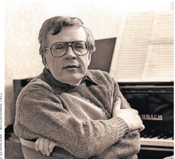
Если Андрей Петров чувствовал «перегес» в сторону легкой музыки, тут же погружался во что-то серьезное.