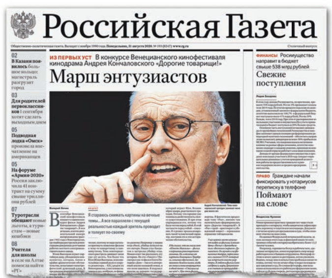
Беседу обозревателя «РГ» с Андреем Кончаловским о его новом фильме читайте в номере от 31 августа.