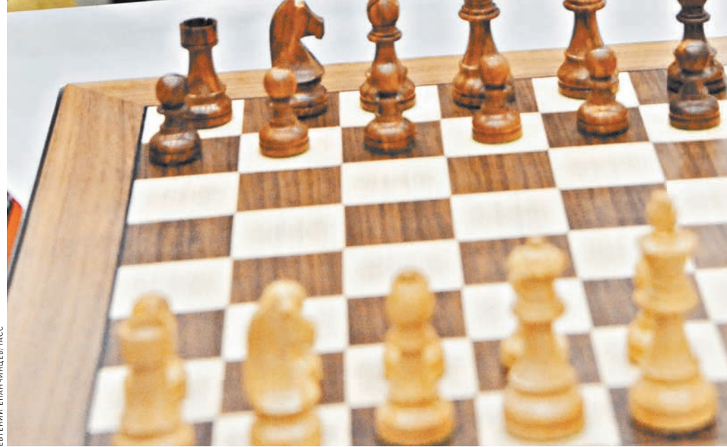
Двенадцатая чемпионка мира по шахматам Александра Костенюк уверена, что онлайн-Олимпиада подарила массу положительных эмоций не только спортсменам, но и миллион болельщиков во всем мире.