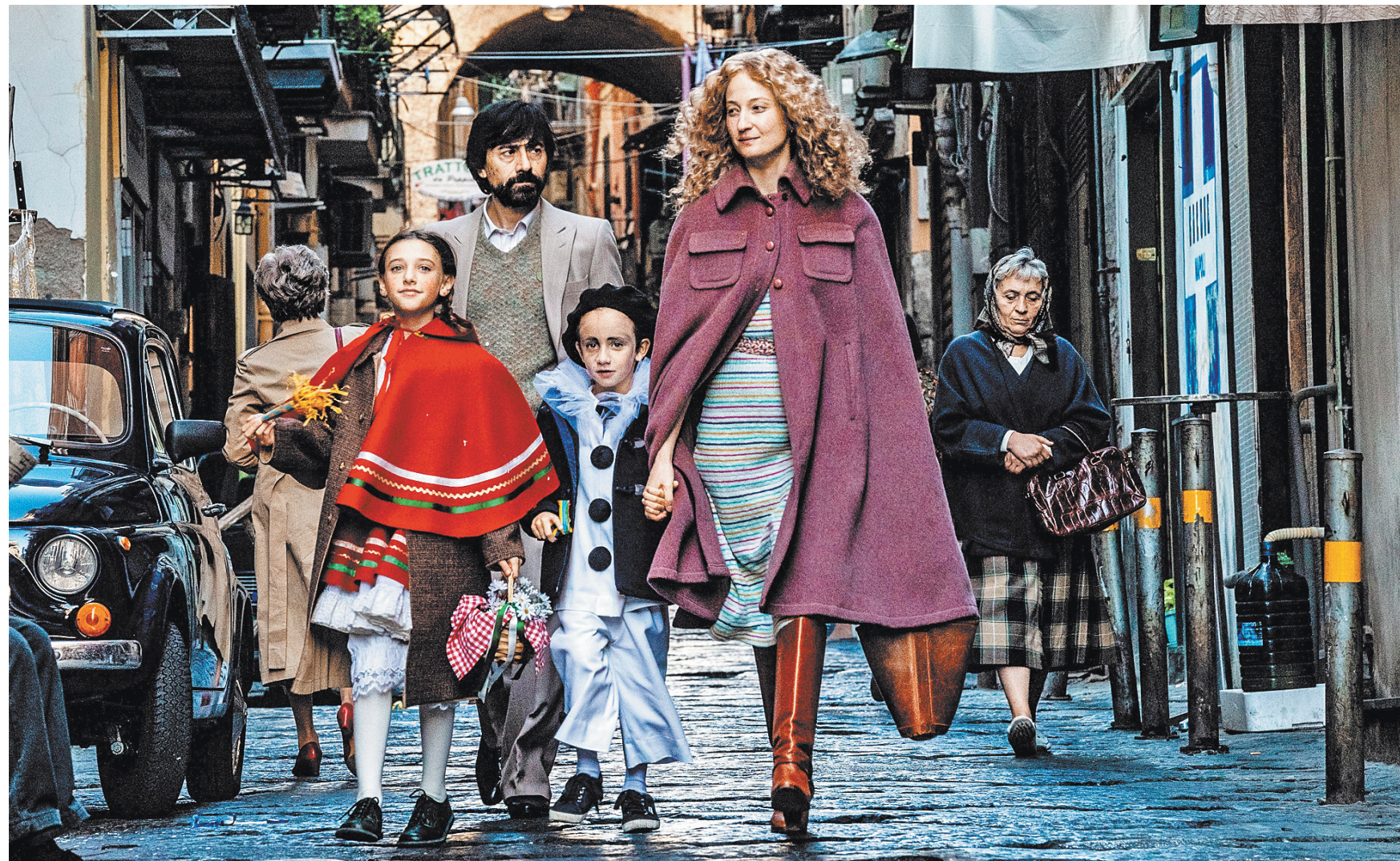
Действие фильма Даниэле Лукетти «Фамильный узел» (Ласси), который откроет фестиваль, происходит в колоритном Неаполе 80-х годов.