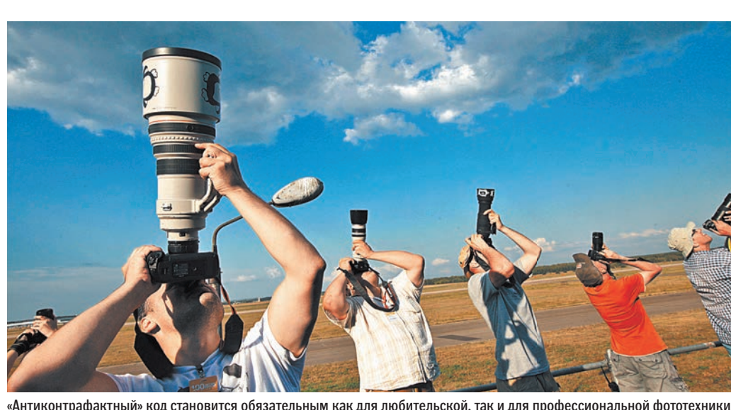
«Антиконтрафактный» код становится обязательным как для любительской, так и для профессиональной фототехники.