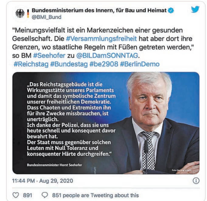
Глава МВД Германии Хорст Зеехофер недвусмысленно указал согражданам на границы демократических свобод: «Свобода собраний заканчивается там, где попираются нормы государства».

В Германии предложили ужесточить закон о демонстрациях. Свободу указали границы. Параллели в Германии предложили ужесточить закон о демонстрациях.