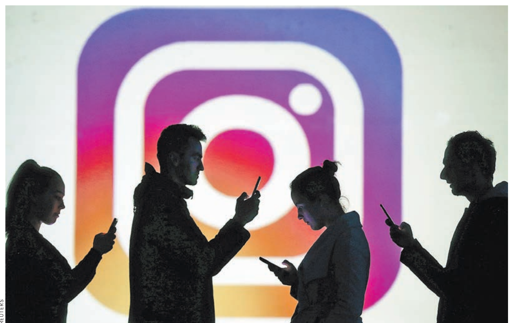
Интернет дает людям полную свободу высказывать любое свое мнение по любому вопросу. Нельзя только нарушать при этом закон — оскорблять и клеветать.