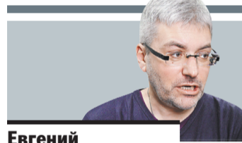
Евгений Водолазкин, писатель

ДУМАЮ, это замечательно, что в Институте Склифосовского пациенты идут «самотеком» и им круглосуточно оказывают медицинскую помощь.