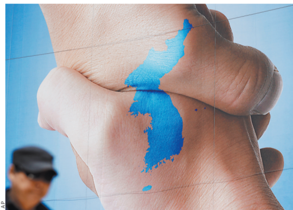
Саммит двух Корей станет главным событием года в азиатском регионе.