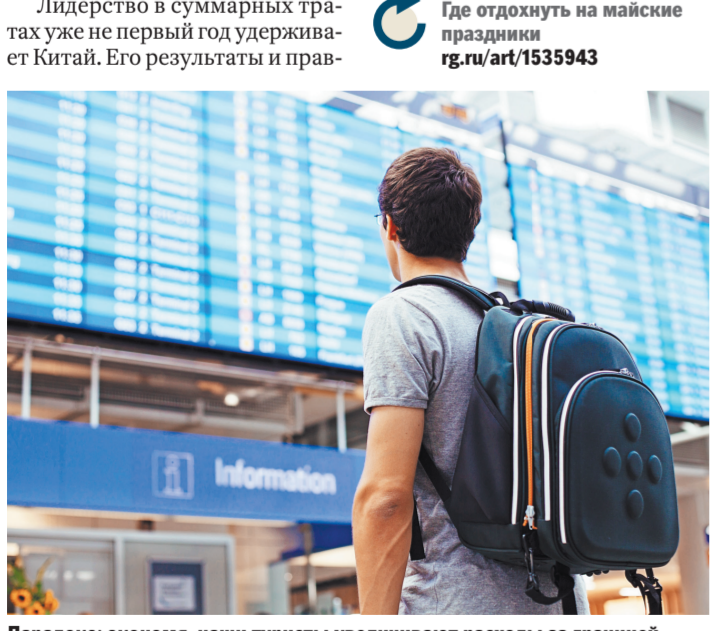
Парадокс: экономия, наши туристы увеличивают расходы за границей.

необходима консультация специалиста. ГДЕ ОТДОХНУТЬ НА МАЙСКИЕ ПРАЗДНИКИ rg.ru/art/1535943