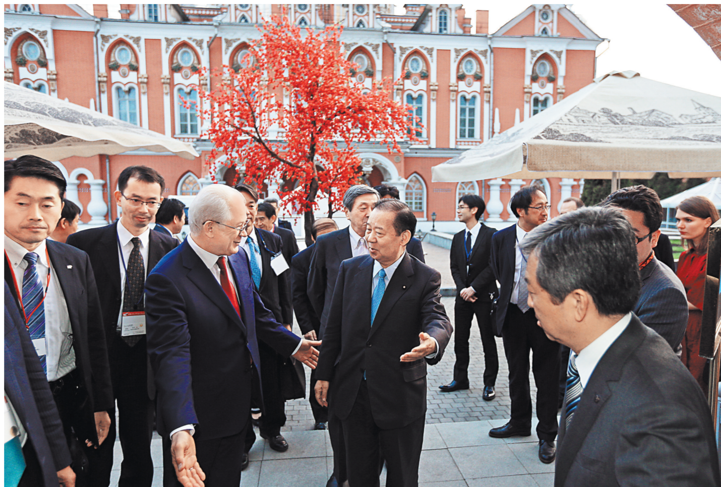
На форум из Японии приехала делегация в составе 200 человек во главе с генсеком правящей Либерально-демократической партии Тосихиро Никаем