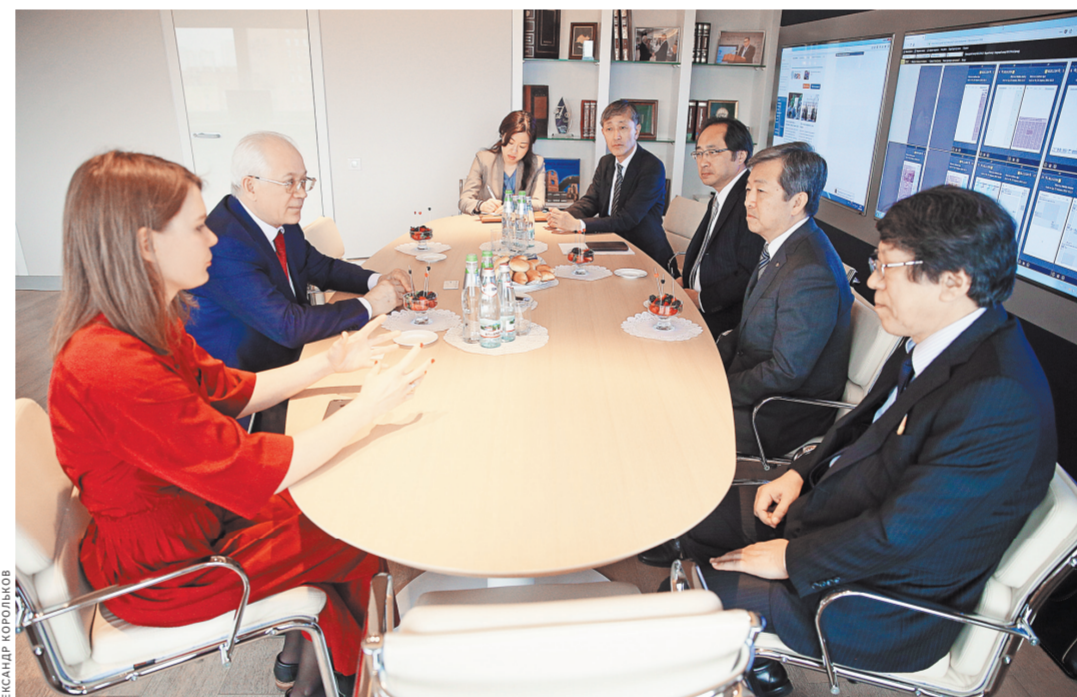
Руководство «РГ» и «Майнити симбун» договорились провести следующий Российско-Японский форум в Токио.