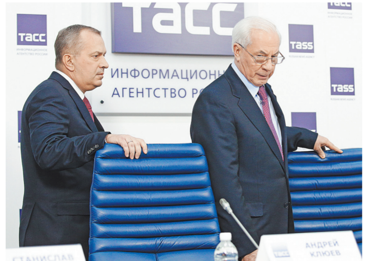
В пресс-конференции в Москве принял участие бывший премьер-министр Украины Николай Азаров (справа).