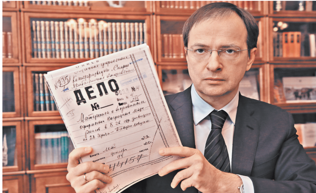
Владимир Мединский: Раскритические архивные материалы ФСБ — еще одна небольшая историческая сенсация.

Итак, самый легендарный эпизод легендарной Битвы за Москву — бой «28 героев-панфиловцев». Что мы о нем знаем? 16 ноября 1941-го бойцы из дивизии