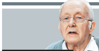
Рой Медведев публицист, доктор педагогических наук

К системе единых госэкзаменов я отношусь настороженно («РГ», 1-я и 14-я полосы). Она вводилась, главным образом, с целью предотвращения коррупции и взятничества в вузах. Уж не знаю, насколько эта затея удалась. В высших учебных заведениях уровень коррупции, возможно, и снизился. Но зато возрос в школах.