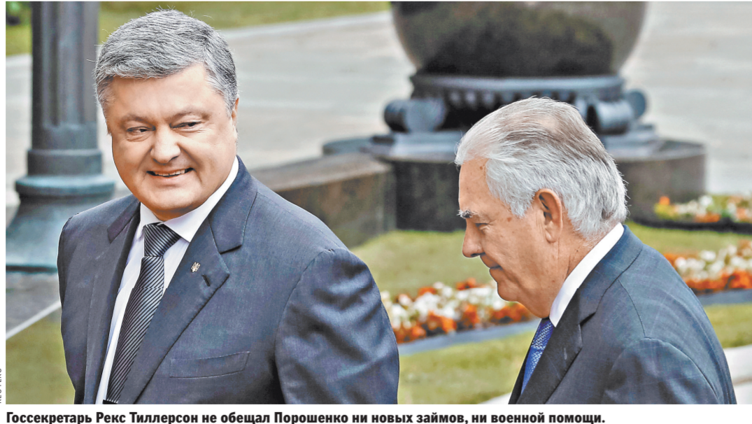
Госсекретарь Рекс Тиллерсон не обещал Порошенко ни новых займов, ни военной помощи.

встречи Порошенко и Трампа две недели назад. А длительное общение российского и американского президентов окончательно погрузило киевские СМИ в плохо скрываемое уныние. «На Украине саммит ожидало с напряженностью. Было опасение, что Путину и Трампу удастся наладить диалог, прийти к пониманию на личном уровне. И худшие ожидания для Киева, кажется, оправдались. Второй, очень приятный для украинской власти итог — общие заявления о незыблестости Минских соглашений и констатация необходимости их выполнения. Дополнительная печаль заключается в том, что обсуждалось это без участия представителей Украины. И значит, возможное решение вопросов безопасности в Донбассе под присмотром старших западных товарищей означает необходимость выполнения политической части соглашений, чего в Киеве делать не собирались», — рассказал «РГ» об итогах саммита с украинской точки зрения директор