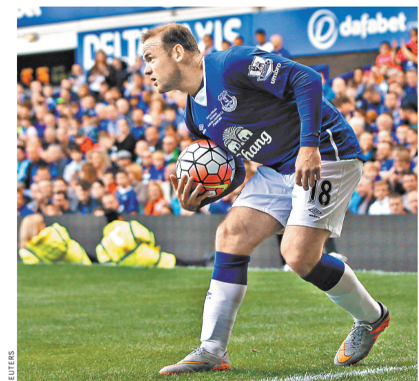
В 2015 году Руни сыграл за «Эвертон» в благотворительном матче против «Вильярреала».

Всего наилучшего пожелал Руни главный тренер «МЮ» Жозе Моуринью. «Непросто смотреть на великого футболиста, который не так часто выходит на поле. Я не могу препятствовать, когда он сказал о желании вернуться в «Эвертон». Нам будет не хватать его. Мы желаем ему самого наилучшего в будущем».