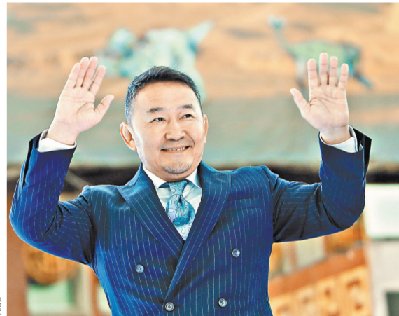
Избранный президент Монголии — художник, дзюдоист, бизнесмен.

В последнее время он делал активные инвестиции в сельское хозяйство и туристическую сферу. Баттулга владеет русским и английским языками. Как пишут местные СМИ, в изучении русского языка ему помогла его вторая жена, которая является русской по происхождению. Говорят, что президент Монголии очень берегает любимую супругу от посторонних глаз, поэтому ее фотографии в Интернете и СМИ практически нет.