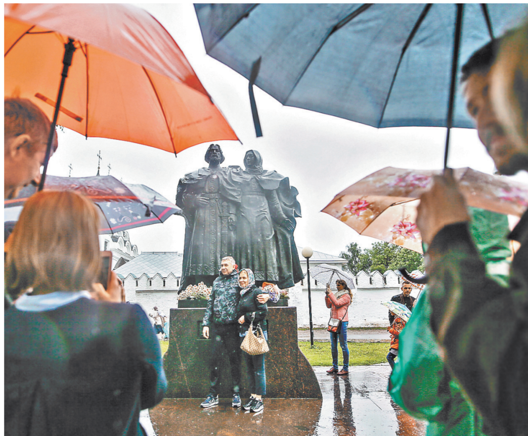
Самый лучший семейный сувенир — фотография из Мурома на фоне памятника Петру и Февронии.