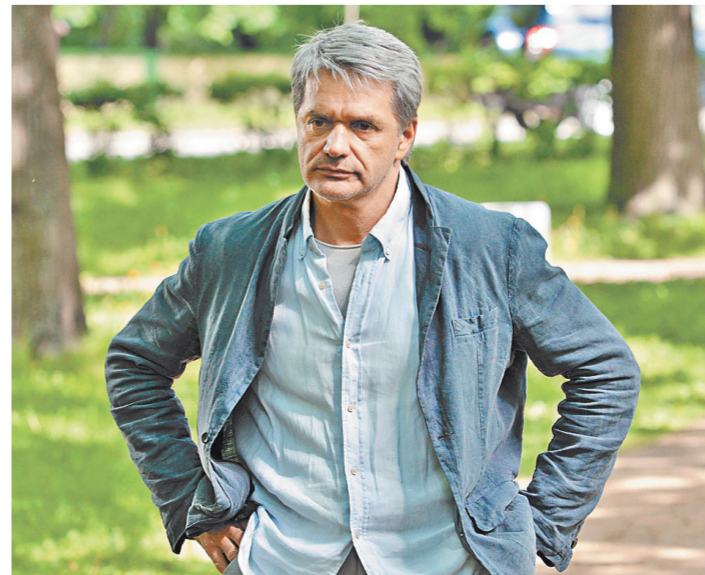
Главную роль исполняет обладатель приза Каннского кинофестиваля Константин Лавроненко.