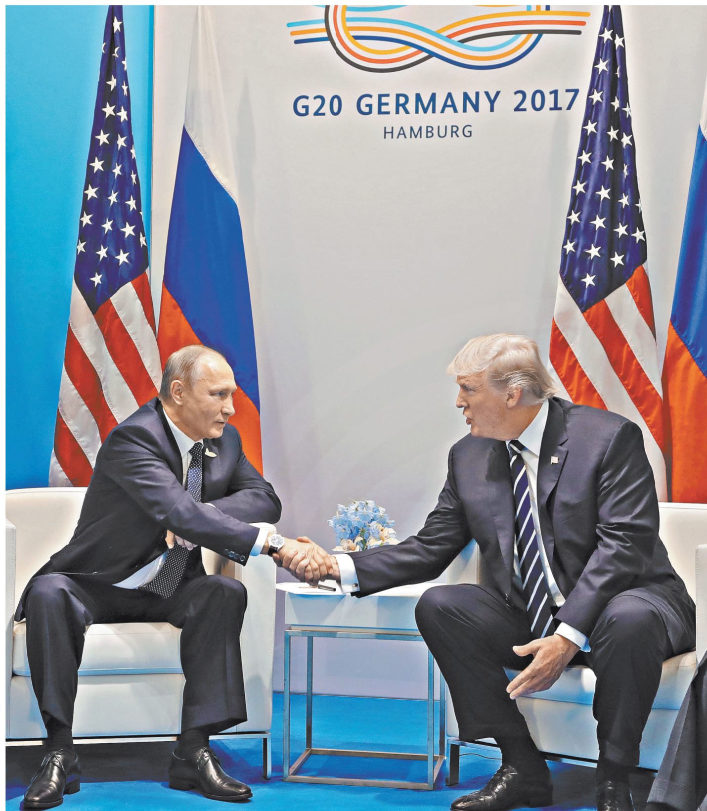
Владимир Путин об итогах встречи с Дональдом Трампом: «Что касается личных взаимоотношений, я считаю, что они установлены».

Что касается самой встречи, то на ней присутствовали глава МИД России Сергей Лавров и госсекретарь США Рекс Тиллерсон, а также переводчики. За короткое время, пока журналисты были в комнате, лидеры пару раз обменялись рукопожатиями и несколькими фразами.