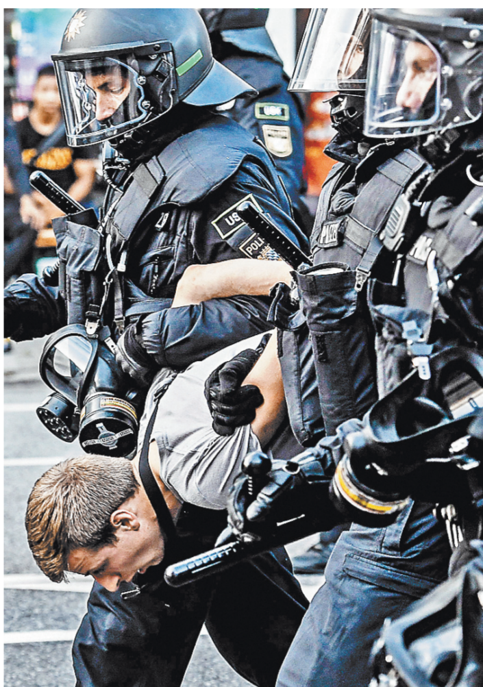
Во время саммита G20 около 20 тысяч полицейских не смогли удержать протесты антиглобалистов под контролем и прибегли к избыточно жестким мерам.

Несмотря на успехи «двадцатки», у приехавших в город многочисленных иностранных делегаций в памяти останутся картины горющих баррикад вооруженных спецназовцев, падающих под стру-