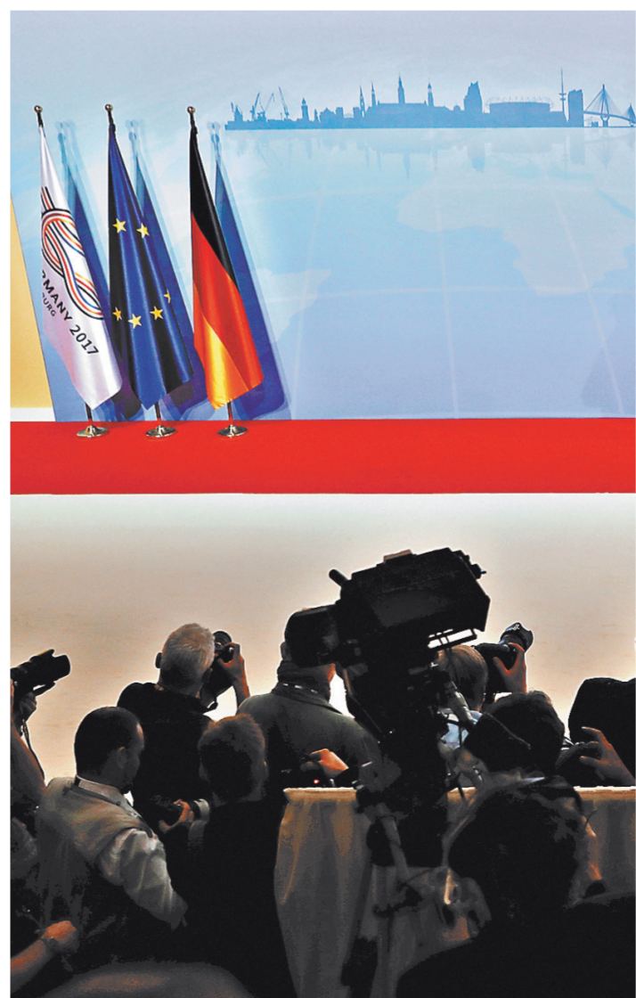
Продолжительность и конструктивный характер переговоров Путина и Трампа стали сюрпризом для западных СМИ.

Что происходило в Гамбурге во время саммита G20 — с. 6