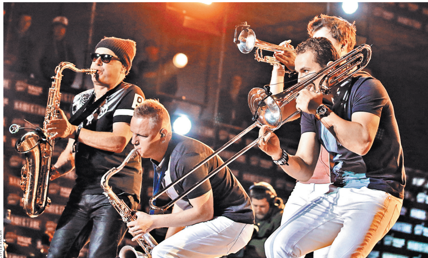
Группа «Браво» сумела разогреть аудиторию даже в этот холодный день.

Светлана Сурганова и уважаемого поздоровалась со всеми словами: «Непромокаемое, неуязвимое «Нашествие»! Здравствуй и процветай!» И впервые за многие концерты снова взяла в руки скрипку, начав с инстру-