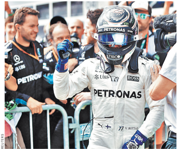
Валттери Боттас выиграл вторую гонку в сезоне и приблизился к напарнику по команде Хэмилтону в общем зачете.

Что же касается российского пилота команды «Торо Россо» Даниила Квяты, то эта гонка не принесла ему никаких положительных эмоций. Квалификацию он завершил с 14-м результатом, после чего в первом же круге стал виновником серьезной аварии. Ее итогом стал сход гощика «Ред Булла» Макса Ферстаппена и Фернандо Алонсо из «Макларена». Сам Квят после заезда в боксы смог продолжить, но с огромным отставанием от остальных пелотона. И занял последнее, 16-е место, не набрав значительных очков.