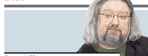
Андрей Максимов писатель, телеведущий