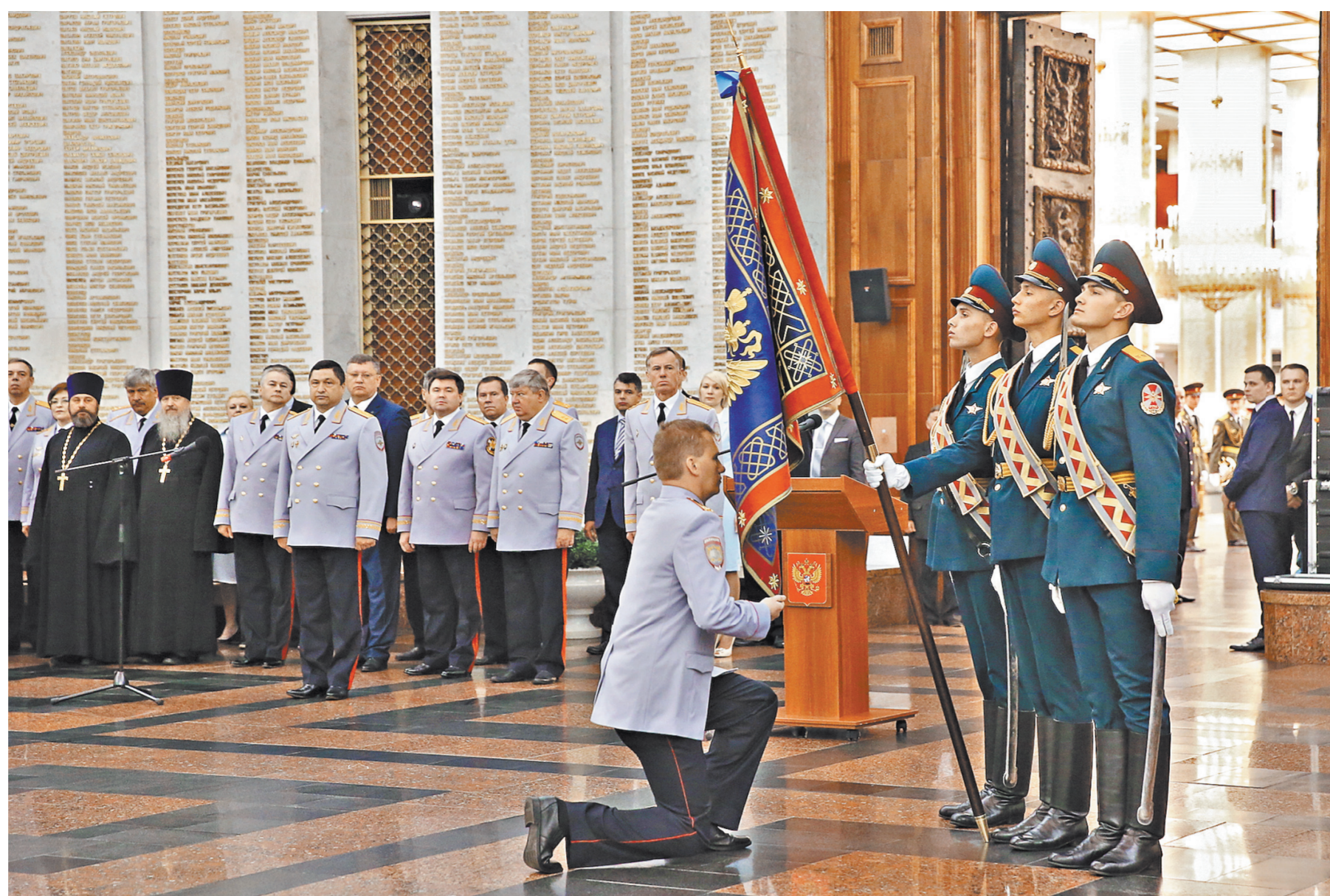
В Москве на Поклонной горе в Центральном музее Великой Отечественной войны 325 выпускников Академии управления МВД России получили дипломы, 12 из них — с отличием. Академия — уникальное образовательное учреждение, которое ориентировано на подготовку, переподготовку и повышение квалификации управленческого звена системы МВД России. Фоторепортаж на сайте: rg.ru/sujet/1560.

—Речь не идет о том, чтобы передать все школы в федеральное ведение. Речь идет об уровне региона. Если посмотреть на финансирование, то школы в каждом регионе и сейчас финансируются с двух уровней бюджета: регионального и муниципального. На региональном уровне устанавливаются нормативы, куда включаются зарплата учителей и учебные расходы. Муниципалитеты, как правило, собственники имущества, они финансируют его содержание. Возможно, будет предложена модель соучредительства региона и муниципалитета, регионы получат больше полномочий в решении кадровых вопросов, распределении базовых и стимулирующих выплат. Сейчас пропорцию определяет школа и учредитель, это, напомним, муниципалитет. В каждой школе утверждается свое Положение об оплате труда, критериях стимулирующих выплат. Во всех школах соотношение разное. Где-то это 70 к 30, а где-то 90 к 10. Возможно, подходы будут едиными. Для сельских школ передача на региональный уровень важнее. В России примерно 24 тысячи сельских школ. Учитывая особенности расселения в сельской местности, думаю, на уровне региона будет проще решать многие вопросы, связанные с доставкой детей в школы, работой школ-интернатов, сетевого взаимодействия.