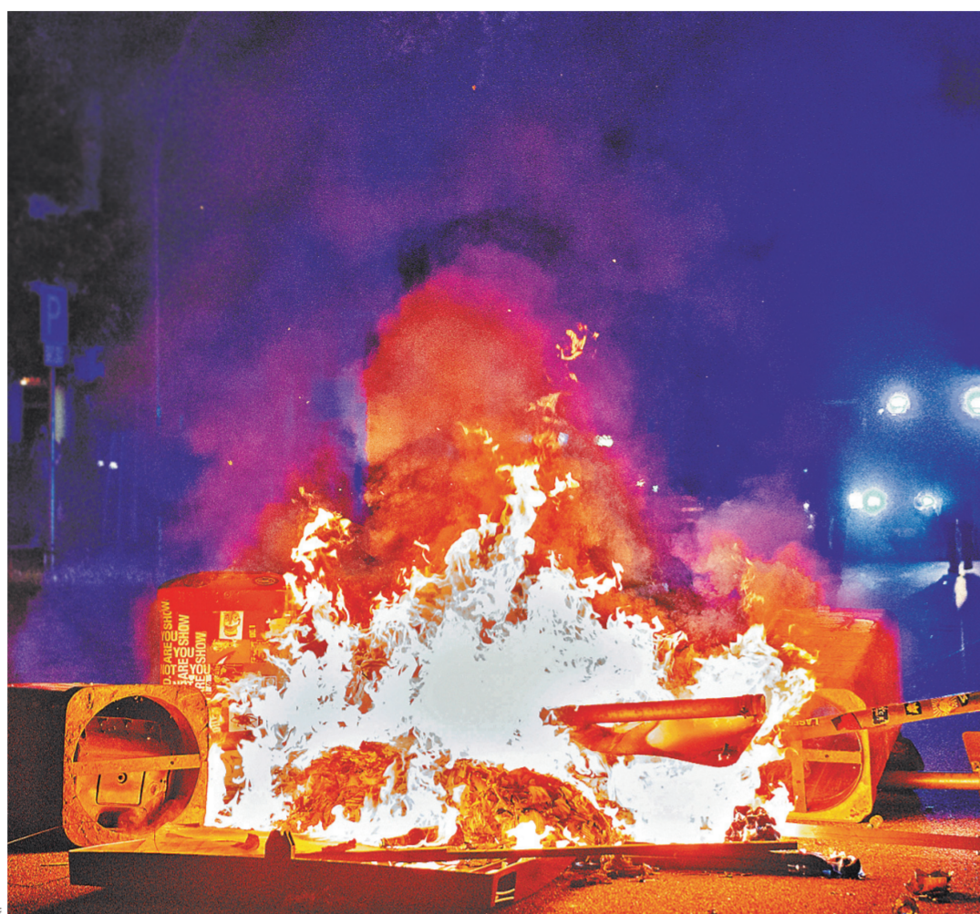
Во время саммита G20 около 20 тысяч полицейских не смогли удержать протесты антиглобалистов под контролем и прибегли к избыточно жестким мерам.