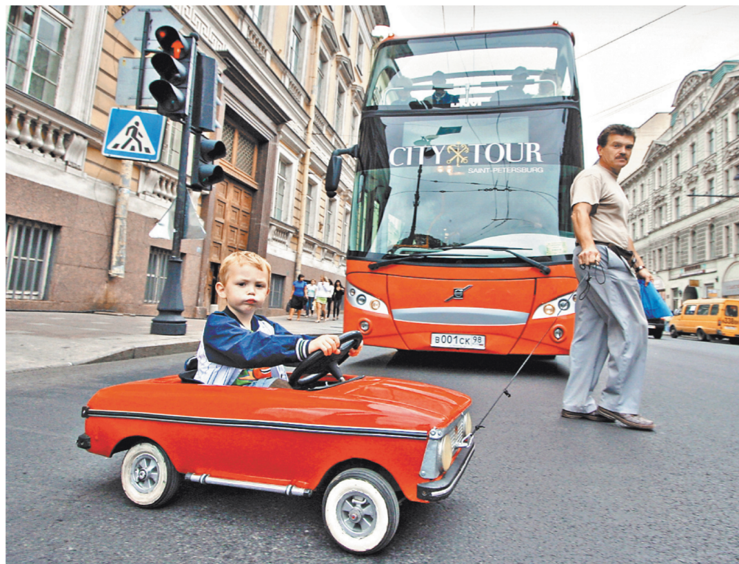
В Москве активно развивается каршеринг, велосипед, такси-агрегаторы, самые разные мобильные приложения.

СУ СК по Красноярскому краю возбуждено уголовное дело.