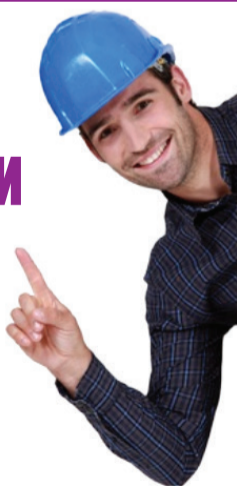
График работы: 2/2

Мы предлагаем: Полное соблюдение ТК РФ. Официальную з/плату. Выплаты 2 раза в месяц. Бесплатную спец. одежду. Корпоративные подарки. Место работы: г. Железнодорожный