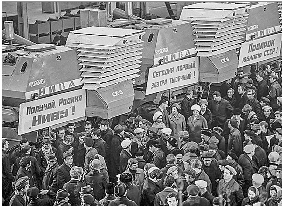
Подарок комбайностроителей Родине.

После развала Советского Союза, разрыва экономических связей уникальное производственное объединение сельхозмашиностроения едва не постигла печальная участь сотен других предприятий.