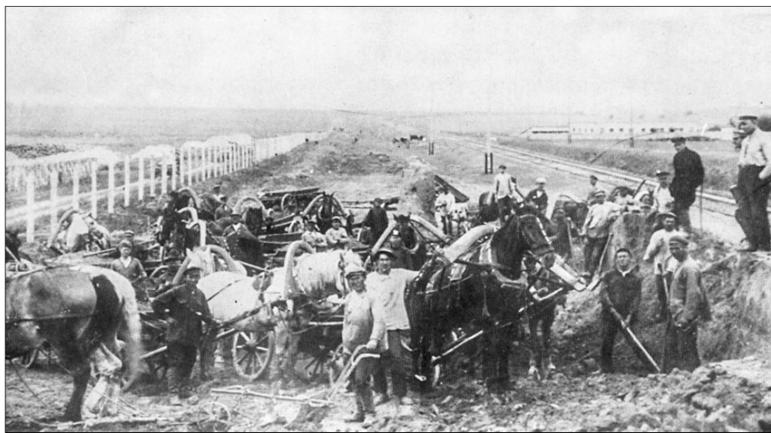
Так начинался «Ростсельмаш».

Ростовским коммунистам, отраслевым профсоюзом, мужественному коллективу сельмашевцев удалось тогда отстоять свой завод. Хотя производство комбайнов и уменьшилось во много раз, были закрыты смежные предприятия, советский