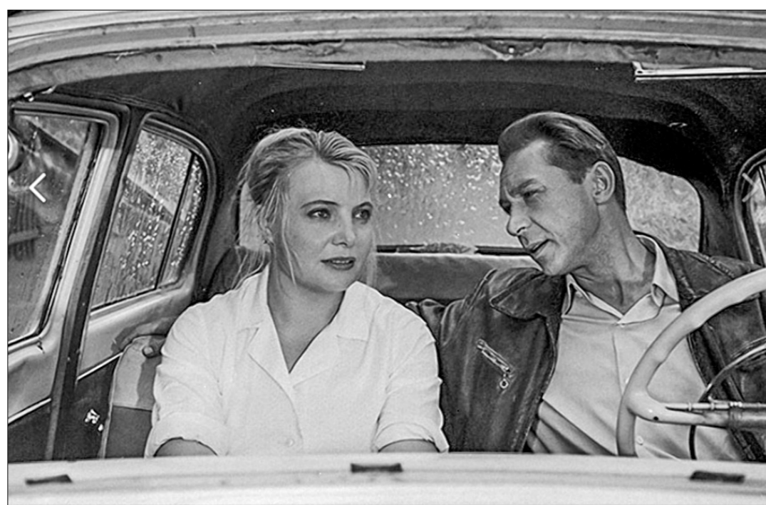
Татьяна Дорониная и Олег Ефремов в фильме «Три тополя на Плющихе».

чество студентки Лиозновой Григорий Козинцев, и она получила «отлично».