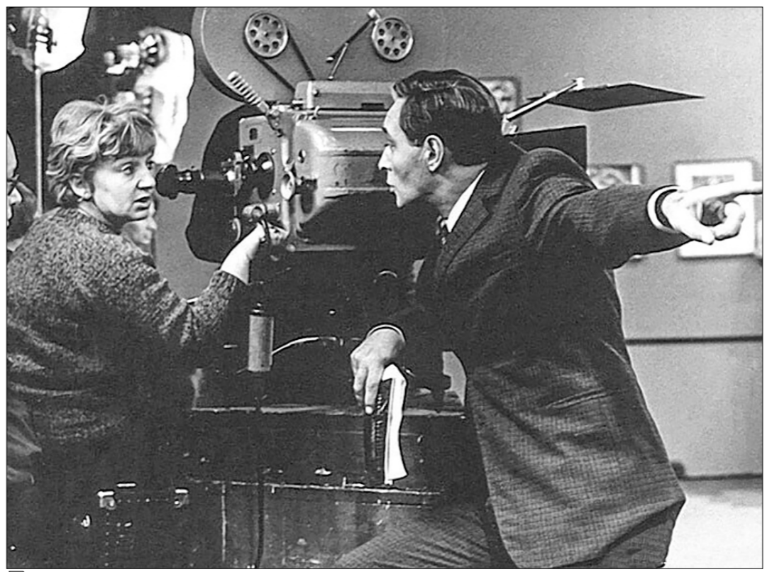
Снимается сериал «Семнадцать мгновений весны».

Сюжет этого пронзительного советского фильма прост, как и всё гениальное. Видный сельский парень