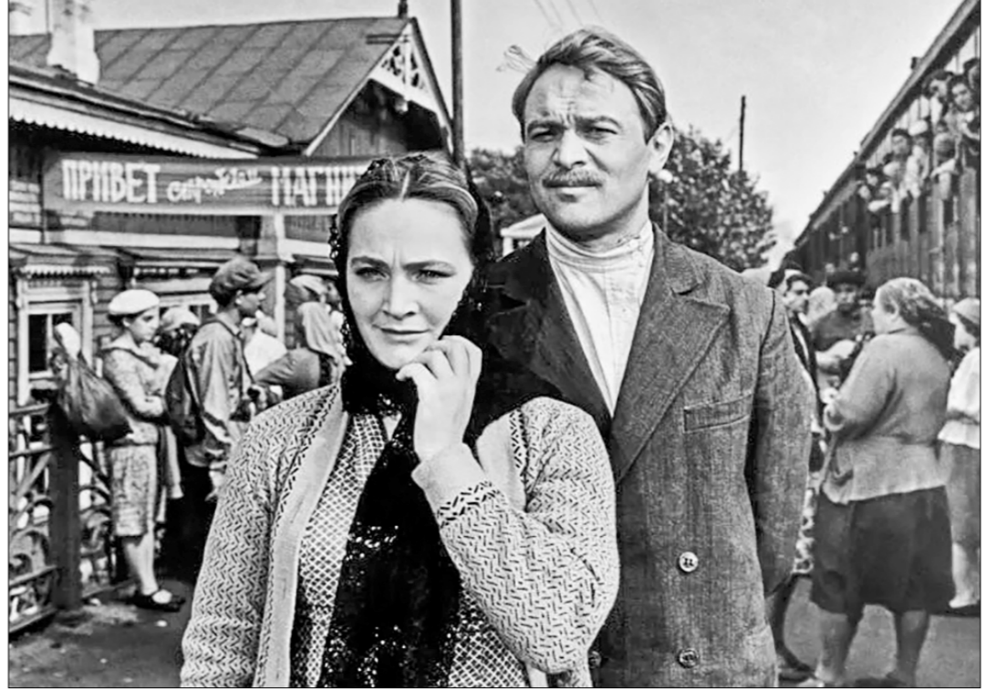
Людмила Хитяева и Николай Лебедев в фильме «Евдокия».

И в лёгком его пожатии была такая ласка и нежность, какой Нюра не знала всю свою жизнь». Так написано в рассказе Александра Боршаговского «Три тополя на Шаболовке» (Татьяна Лиознова заменила Шаболовку на Плющиху). Отсюда ещё одна, необычная, героиня картины — песня А. Пах-