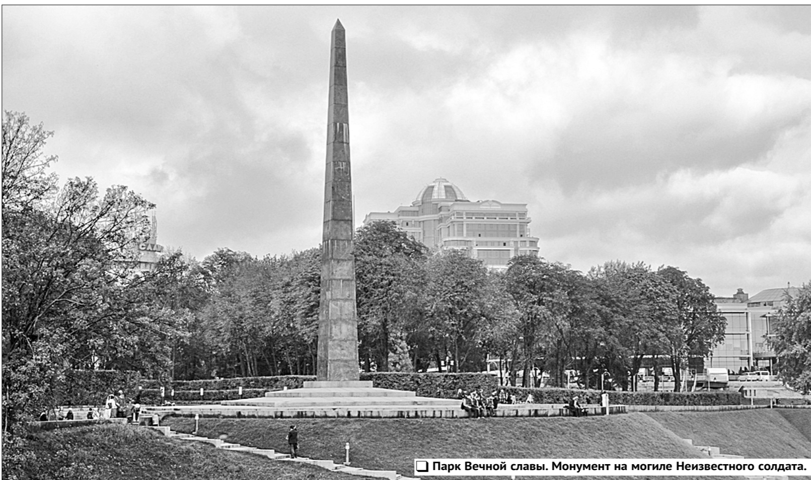
Парк Вечной славы. Монумент на могиле Неизвестного солдата.

Вдруг одна из преподавательниц выкрикнула: «Ещё расскажите, что украинцы больше всех пострадали в этой войне!» Она, видимо, пыталась как-то поддержать своего коллегу. Я снова взяла бразды правления в свои руки и пояснила: «Неправда! Только в осво-