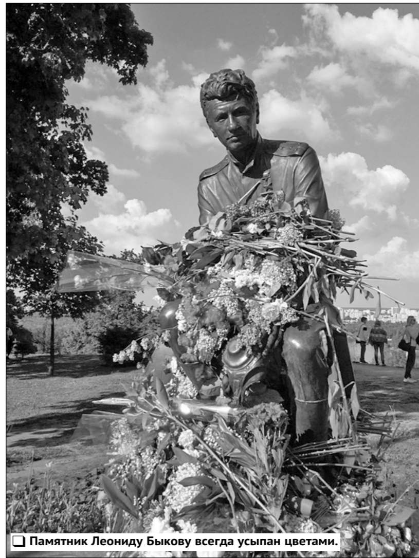
Памятник Леониду Быкову всегда усыпан цветами.