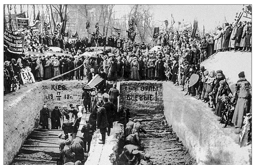
Похороны участников рабочего восстания против Центральной рады. Киев, февраль 1918 года.

«В восемь пятьдесят одна, вынырнув из устья Московской улицы, к главным воротам «Арсенала» подкатил броневик. (...) Из жерла пулемёта рванулся трескучий огонь... Пули прошли по стенам, вышибив в крепком кирпиче петровских времён мелкие лунки. С башни «Арсенала» полетела граната, за ней вторая, они упали перед броневиком и оглушительно взорвались (...). Так начиналось Январское восстание в Киеве», — пишет в своём