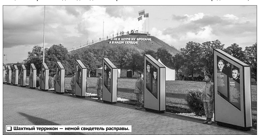
Шахтный террикон — немой свидетель расправы.