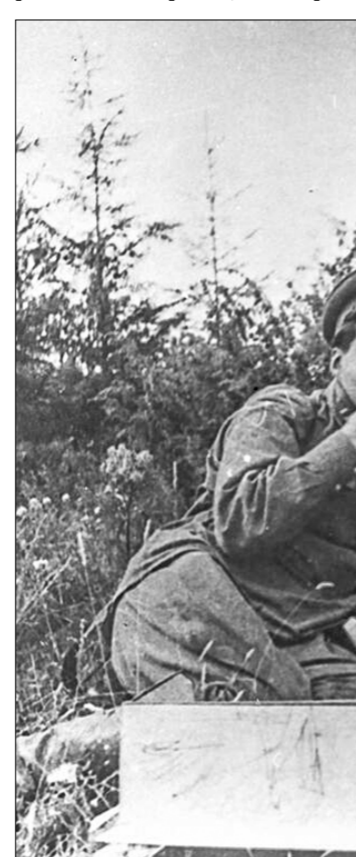
□ Это он, поэт Алексей Сурков, в разные годы жизни.

И снова пауза. Дальше генерал зачитал приказ, в котором