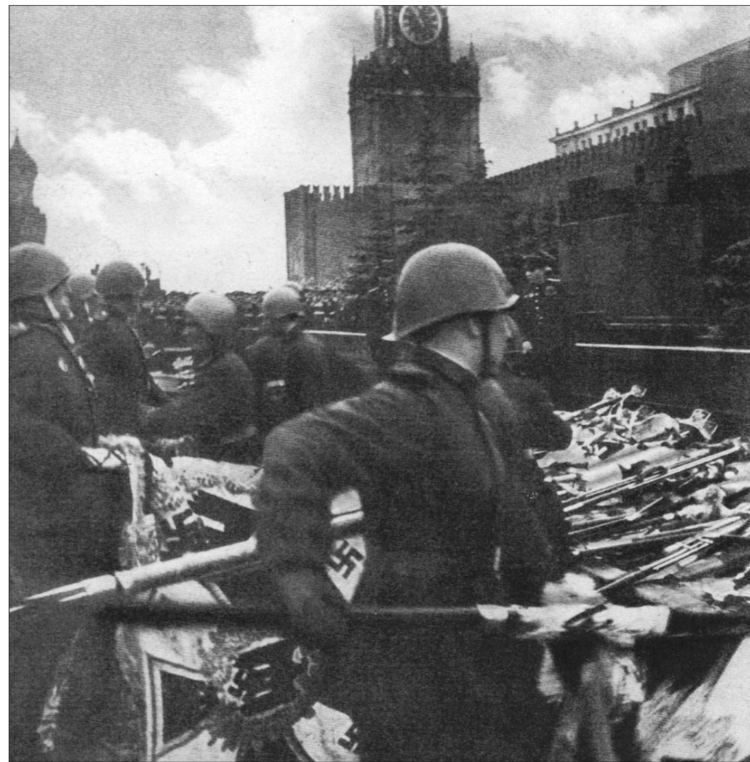
Кульминация Парада Победы. Советские воины бросают поверженные фашистские знамена к подножию Мавзолея В.И. Ленина.

огню, к памятникам павших за Родину героев, к памятнику В.И. Ленина розы и гвоздики именно красные. Потому что красный цвет — символ жизни и великих побед за свободу и счастье трудового народа, символ социальной справедливости. Поэтому я убеждён, что наша памятная Победная лента должна быть красной!