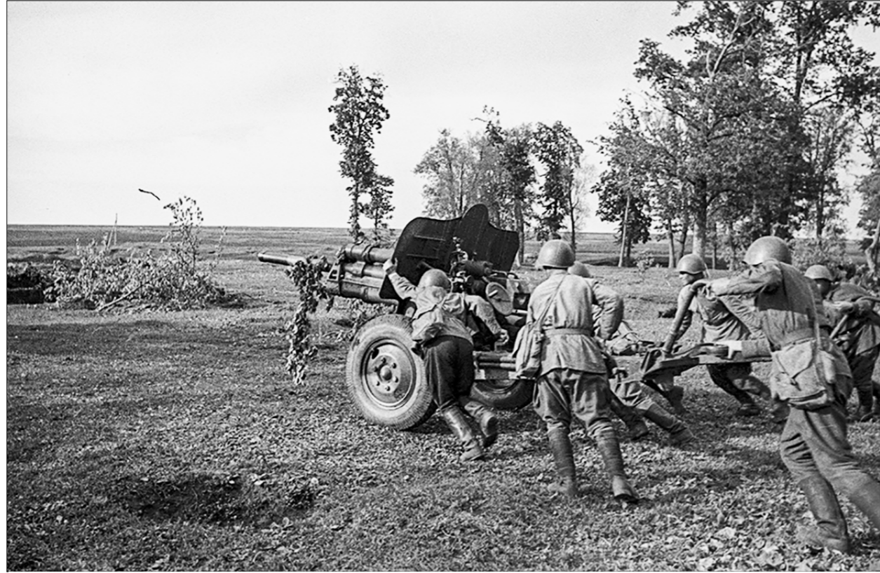
Советские артиллеристы с пушкой УСВ.