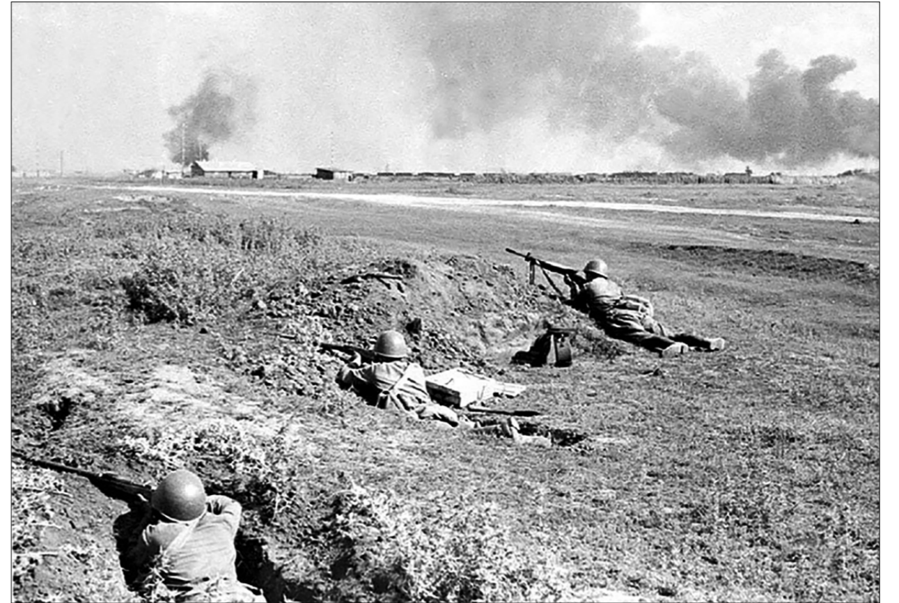
Пехота Красной Армии в обороне.