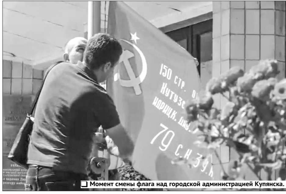
Момент смены флага над городской администрацией Купянска.