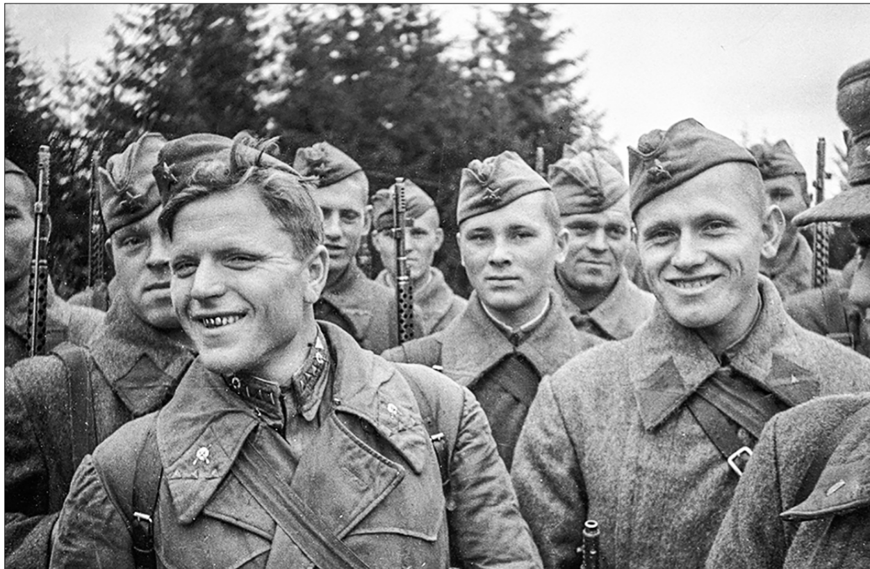
Подразделение снайперов РККА.

Повествование о героях первых дней войны начнём с рассказа о подвигах лётчиков. Уже 22 июня