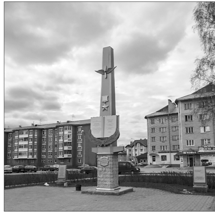
Памятный знак в честь первых Героев Советского Союза в годы Великой Отечественной войны.

В этот день вышел Указ Президиума Верховного Совета СССР о присвоении отважным лётчикам звания Героя Советского Союза. Их от души по-