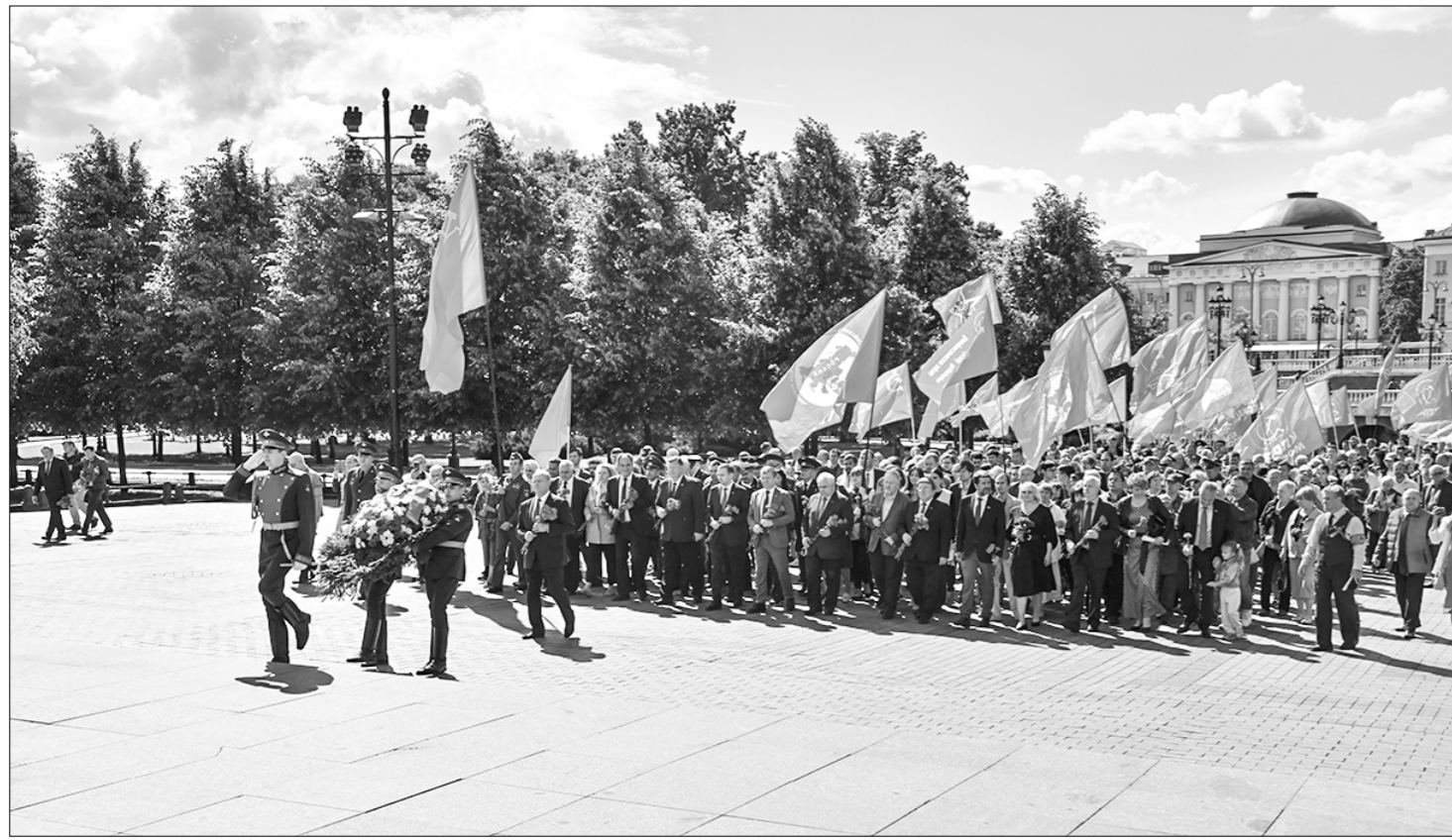
22 июня в Москве, в ознаменование 81-й годовщины начала Великой Отечественной войны, коммунисты, комсомольцы, союзники и сторонники партии возложили цветы к могиле Неизвестного солдата у Кремлёвской стены. Колонну под красными знамёнами возглавил лидер КПРФ и народно-патриотических сил России Г.А. Зюганов.

По окончании акции памяти Геннадий Андреевич выступил перед журналистами.