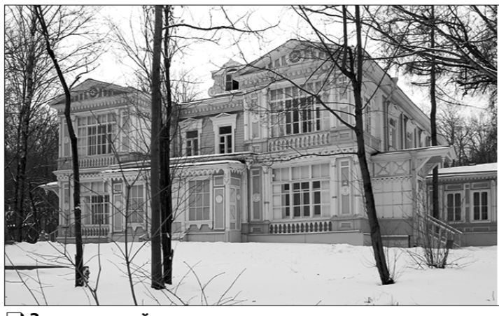
Здание лесной школы сегодня.