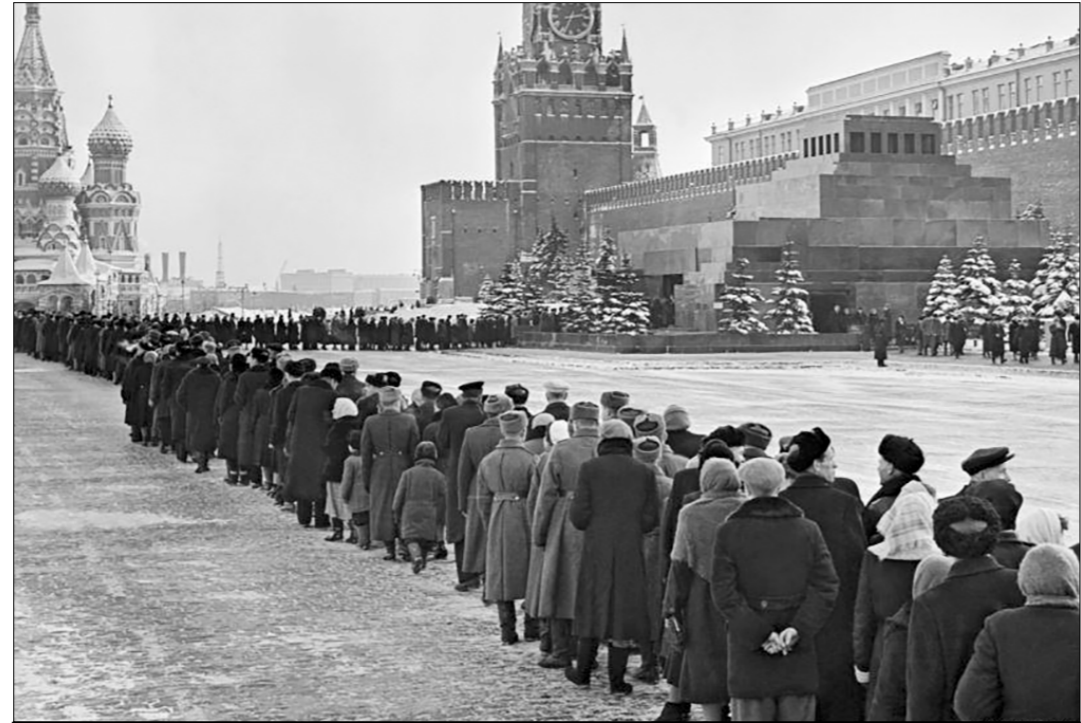
Советской святыней, навсегда вошедшей в победную историю нашей страны, стал Мавзолей В.И. Ленина

оказалась умозрительной и, как нам хорошо известно, от революционных потрясений России не уберёгла. По поводу «патриотизма», служащего лишь для прикрытия интересов власти имущих, известный английский литератор Самюэль Джонсон ещё в XVII веке заметил: «Патриотизм — последнее прибежище негодяя». Помнится, в период контрреволюционного переворота в СССР ненавистники советского строя, мнившие себя, конечно же, «патриотами», дружно набросились на это высказывание, приписывая его Льву Толстому. Но в принципе они были недалеки от истины. Напомним, что по этому поводу говорил наш великий писатель в статье «Христианство и патриотизм»: «Патриотизм в самом простом, ясном и несомненном значении своём есть не что иное для правителя, как орудие для достижения властолюбивых и корыстных целей, а для управляемых — отречение от человеческого достоинства, разума, совести и рабское подчинение себя тем, кто во власти. Так он и проповедуется везде, где проповедуется патриотизм». Есть у Толстого похожие по сути высказывания и в других работах (в том числе в статье «Патриотизм и правительств»), с которыми не мешало бы ознакомиться современным чиновникам.