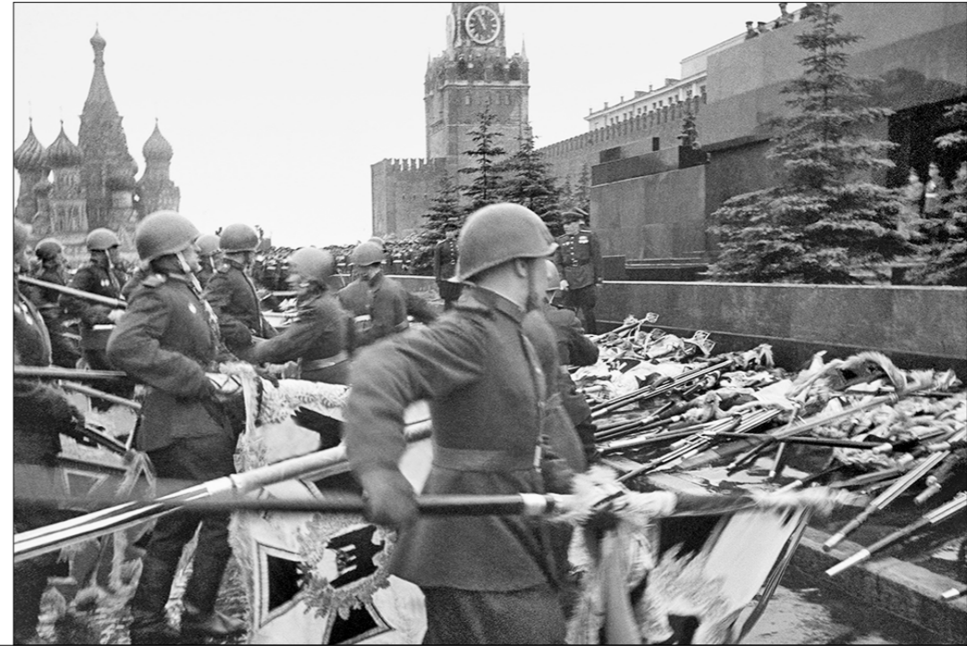
Советской святыней, навсегда вошедшей в победную историю нашей страны, стал Мавзолей В.И. Ленина

Большою пропитаны слова любимого в народе писателя-фронтовика, участника Сталинградской битвы Юрия Бондарева, опубликованные «Правдой» в июне нынешнего, 2020 года: «Многие сейчас шумят и трещат вокруг нашей Победы. Много словесных поклонов в сторону ветеранов. Но, видимо, не сознают властители, бывшие эти показные, фальшивые поклоны, что одновременно ветеранов они глубоко оскорбляют. Разве можем мы иначе воспринимать то, что во время войны паровозы на Красной площади в святой день 9 Мая тщательно скрывают от глаз людских одну из главных для нас святынь — Мавзолей Владимира Ильича Ленина?.. Мы-то помним и хотим, чтобы помнили в веках, что именно с трибуны ленинского Мавзолея наш Верховный Главнокомандующий Иосиф Виссарионович Сталин произнёс свою доходящую до исторической рефры на параде 1945 года, посвящённом годовщине Великого Октября. А на Параде Победы в 1945-м именно к подножию Мавзолея были брошены поверженные фашистские штандарты. И что же, теперь хотят вычеркнуть память об этом?»