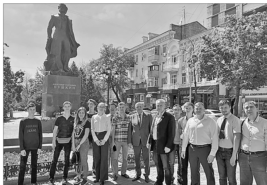
6 июня в Ростовском обкоме КПРФ прошёл «круглый стол», посвящённый 100-летию донского ЛКСМ. В праздничном мероприятии участвовали представители комсомольских организаций городов и районов области. Ребята вспомнили славные вехи в истории комсомола — уникальной, не имеющей аналогов в мире общественной организации, с которой неразрывно связаны несколько поколений нашей страны. Говорили о вкладе комсомольцев в создание молодого Советского государства, о трудовом подвиге на благо народного хозяйства, о героизме во время Великой Отечественной войны.

В Ростове отметили вековой юбилей Ленинского комсомола Дона