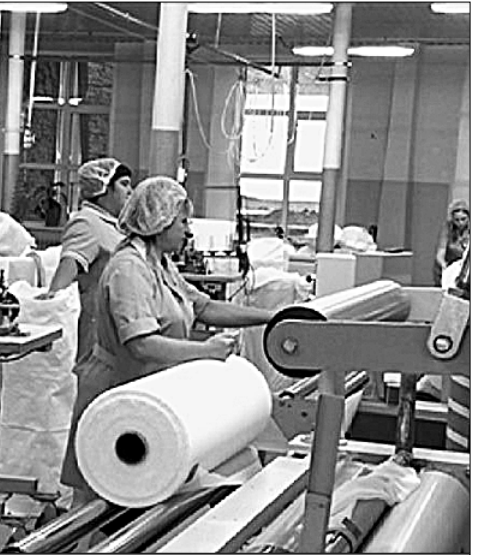
● На ткацком производстве — слыш китайское оборудование.

Пусть живём мы всё время на сдачу От великих проектов страны, Но ловить не устанем удачу Даже в редкие сети казны. Город строит, растёт, расцветает, Молодеет, рождает, творит, Любит, учится, верит, мечтает, Пашет землю, метёт и... сорит. Мы пока ещё только в разминке. Шлечет Волга, волну шевеля. Города надо строить в глубинке, Но чтоб видели их из Кремля.