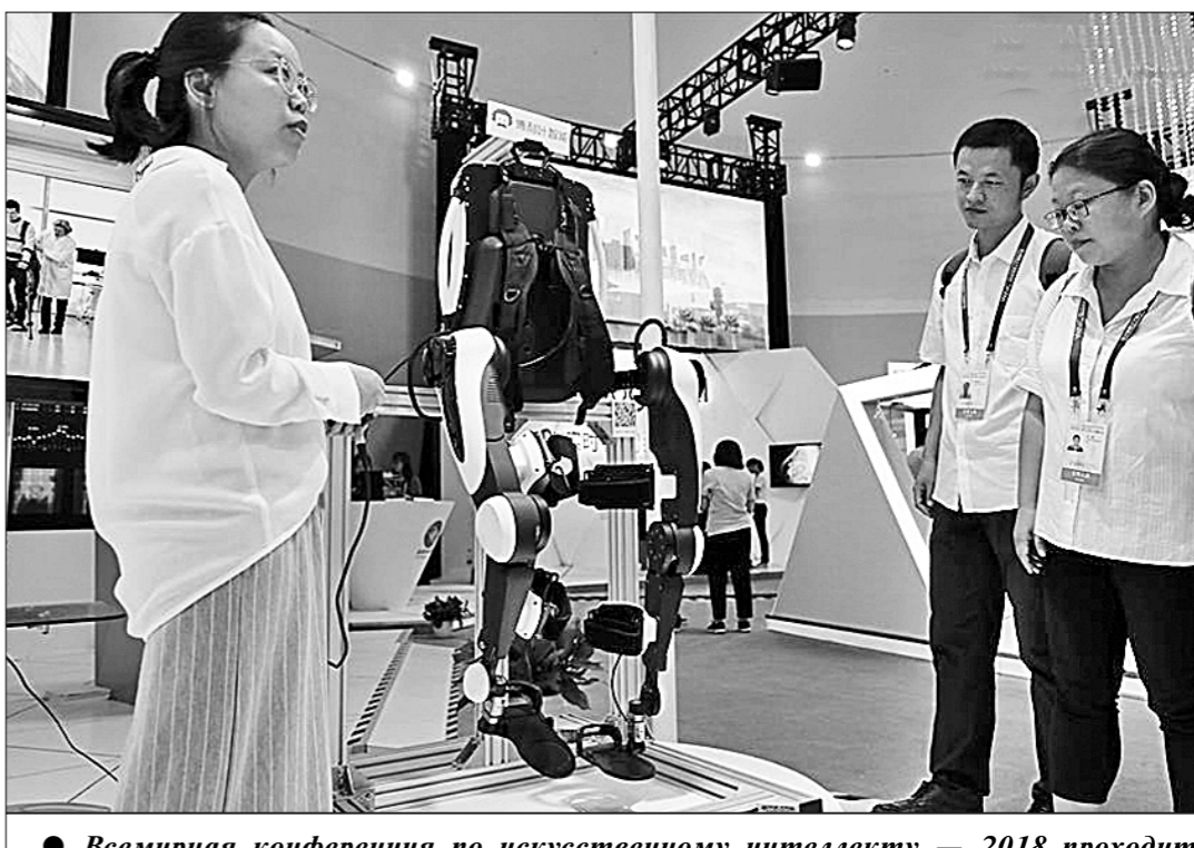
● Всемирная конференция по искусственному интеллекту — 2018 проходит в китайском городе Шанхай. В ней участвуют учёные, эксперты и деловые люди примерно из 40 стран и регионов мира. В рамках конференции запланированы подфорумы и выставки с участием более чем 200 ведущих компаний, работающих в области искусственного интеллекта.