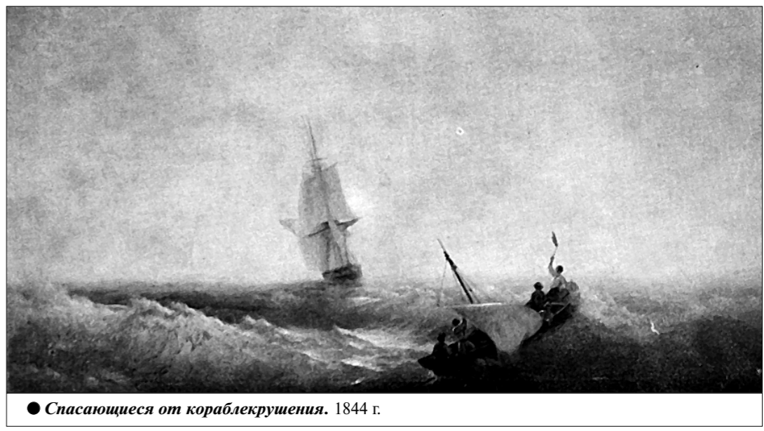
● Спасаются от кораблекрушения. 1844 г.

— Ну вот за это спасибо! — воскликнул Белинский, крепко пожимая руку художнику. — Теперь я вижу, что для вас жизнь не только праздник, но и попрание лишений, страданий, борьбы.