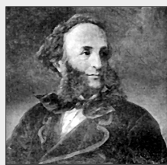
● И.К. Айвазовский. Автопортрет. 1874 г.

Июньским утром 1848 года, когда солнце уже позолотило вершины пирамидальных топей, свечками тнухившимся к голубому небу, Иван Константинович Айвазовский, как всегда, заперся в мастерской, развёл краски и попытался изобразить на холсте входящие в фео- досийскую гавань парусники. Но на сей раз сосредоточиться на работе никак не мог — лишь вчера из Петербурга пришла скорбная весть о кончине Белинского. Тогда художник отложил кисть, вышел из дома и по узкой улочке стал неторопливо спускаться навстречу рокоту морского прибоя. У пенной полоски присел на прибрежный валун, задумавшись.