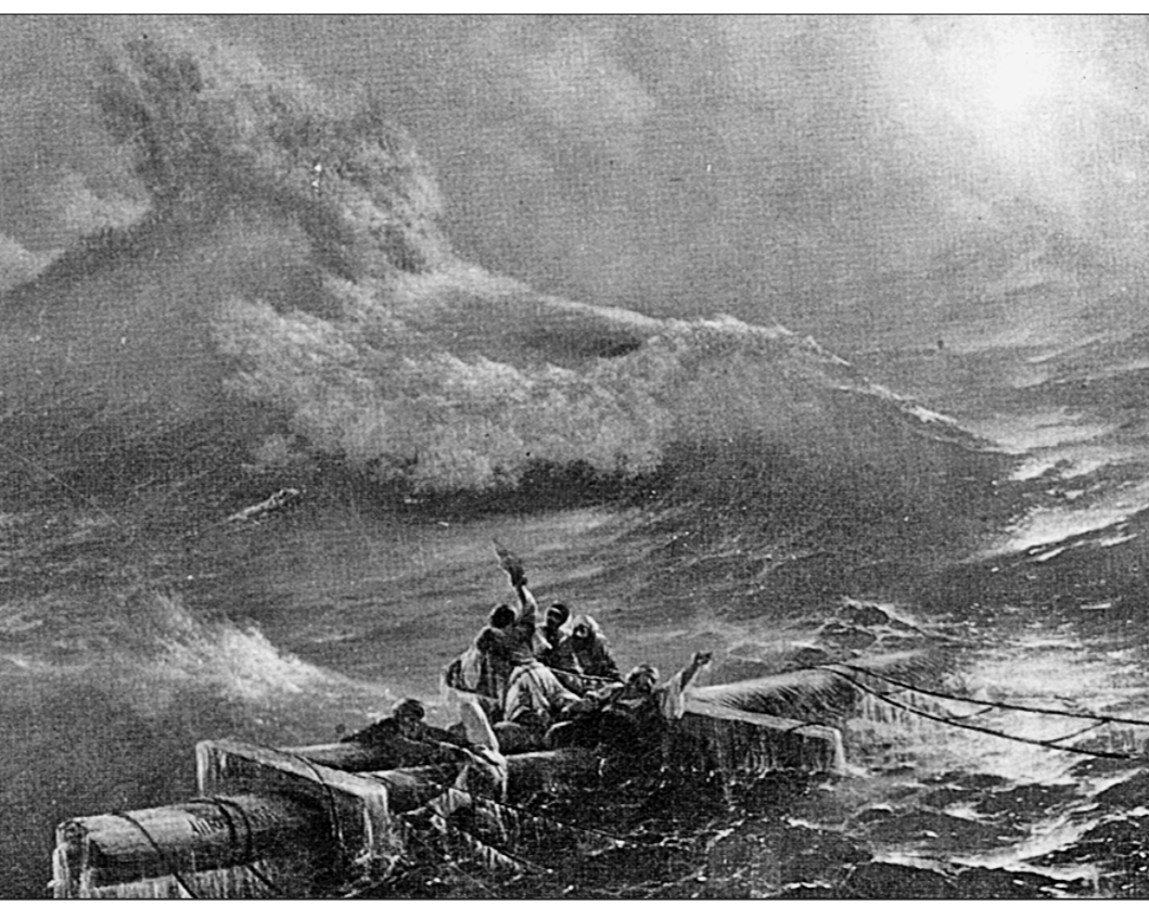
● Десятый вал (фрагмент). 1850 г.

ра, приносит людям радость, несчастных заставляют забыть про своё горе, а богатых и властных смягчают и облагораживают. Но обиды на Белинского не было — художник очень уважал мнение этого человека, не пропускал в журналах ни одной его статьи, по многу раз перечитывал их.