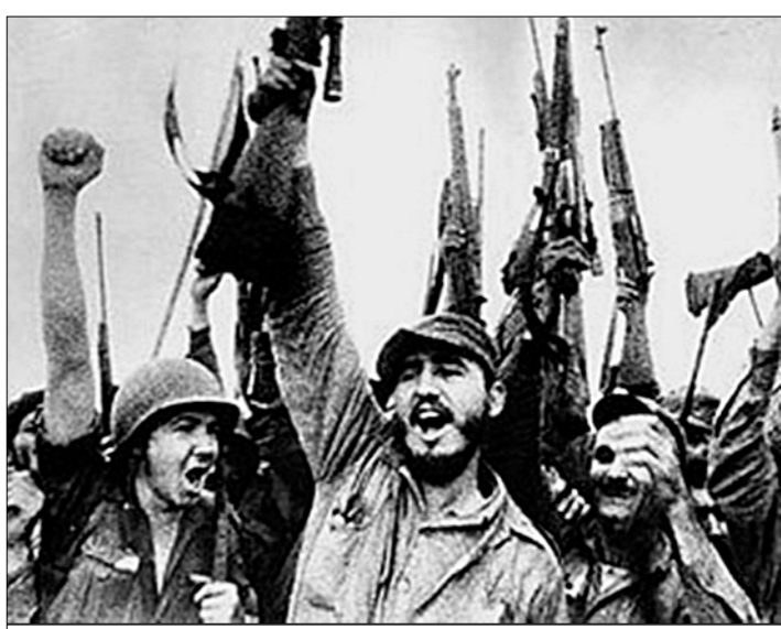
Они завоевали победу.

Общекубинская фиеста пришла в Санкти-Спиритус — столицу одноимённой и самой центральной провинции Кубы. По сложившейся на острове традиции, местом основного празднования в стране становится главный город провинции, удостоившийся этой чести за самые большие достижения в социально-экономическом развитии региона. В нынешнем году такое право завоевал Санкти-Спиритус.