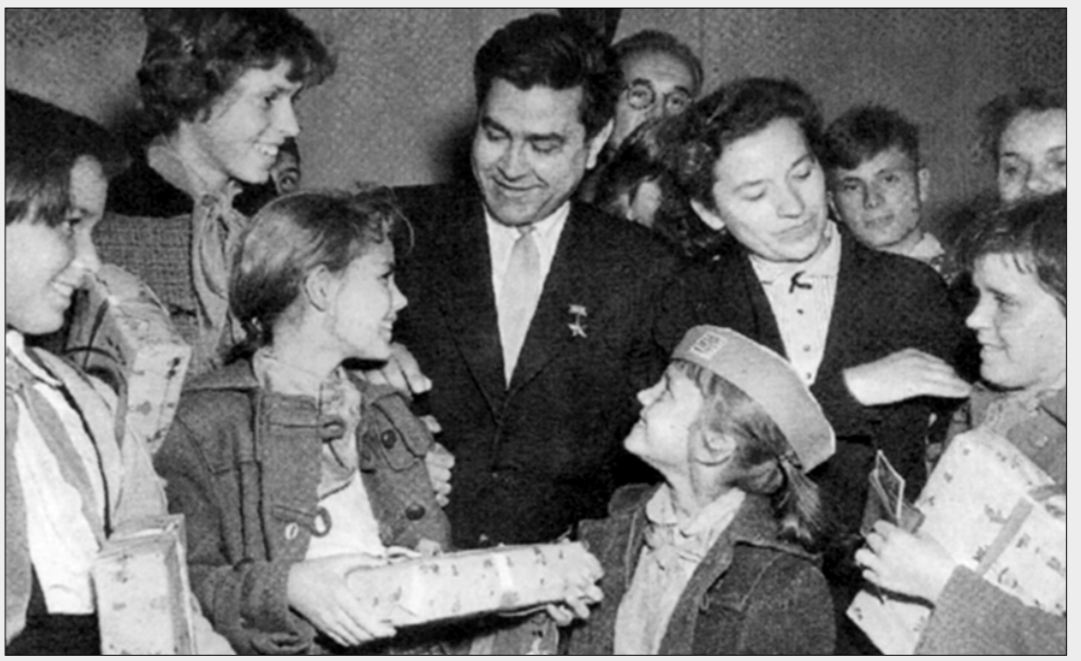
● Артековцы у А.П. Маресьева.

к его жизни, а она оказалась вполне типичной для советского человека той эпохи.