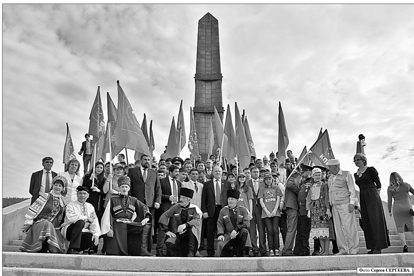
Фото Сергея СЕРГЕЕВА.

Константин МАМОНОВ, Саня АДЛЕВА, Фото Константина МАМОНОВА.