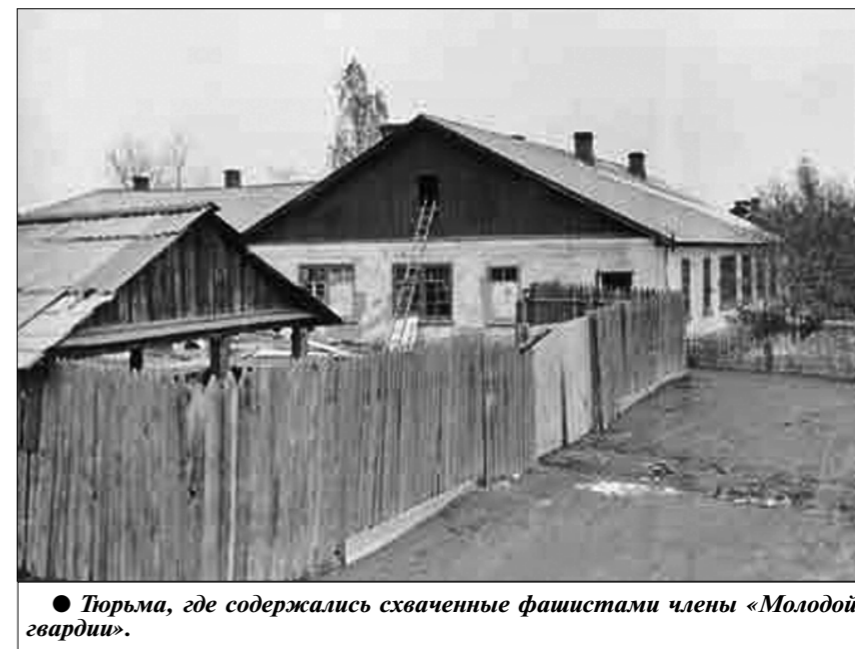
Порьма, где содержались схваченные фашистами члены «Молодой гвардии».