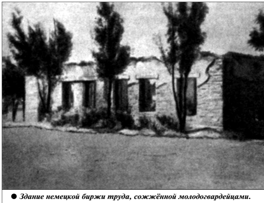
Здание немецкой биржи труда, сожжённой молодогвардейцами.