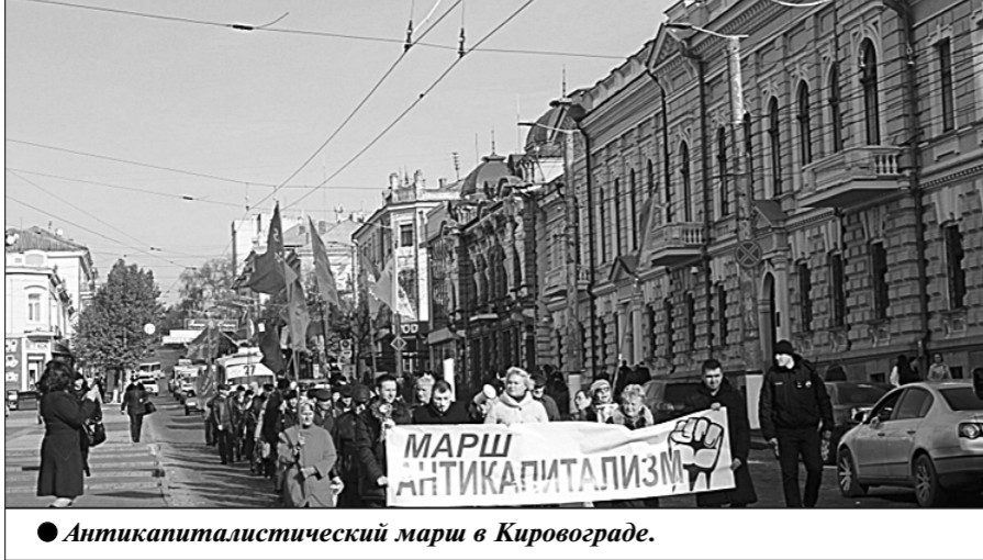
Антикапиталистический марш в Кировограде.

При этом Симоненко напомнил, что Октябрьская революция дала Украине не только суверенность и целостность территории, но и развитую промышленность, стабильную и мощную экономику. «События, прошедшие за 99 лет после победы Великой Октябрьской социалистической революции, дают ответы на многие вопросы. Особенно наглядно это видно за годы Советской власти, когда были реализованы программные установки Октября. Это были годы подвигов, строительства лучшей жизни, свершений и социализма, в котором конкретные люди имели возможность добиваться конкретных результатов», — отметил он. — Те годы свершений дают нам сегодня позитивный импульс и пример, которым