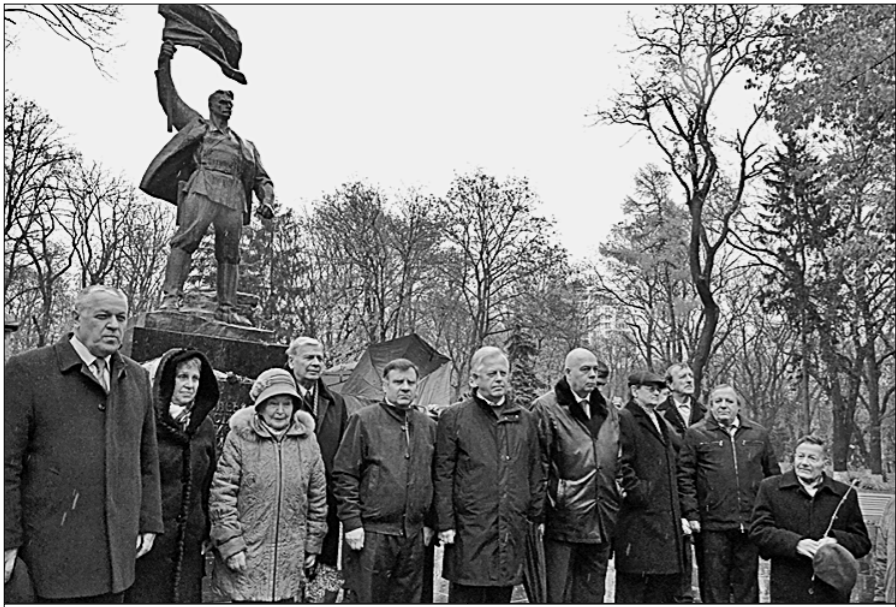
Члены ЦК КПУ после возложения цветов к памятнику героев «Арсенала».

Накануне 99-й годовщины Великой Октябрьской социалистической революции состоялось третье в нынешнем году Всеукраинское партийное собрание с единой повесткой дня: «Октябрь учит, зовёт, вдохновляет», в котором участвовали практически все организации Компартии Украины.