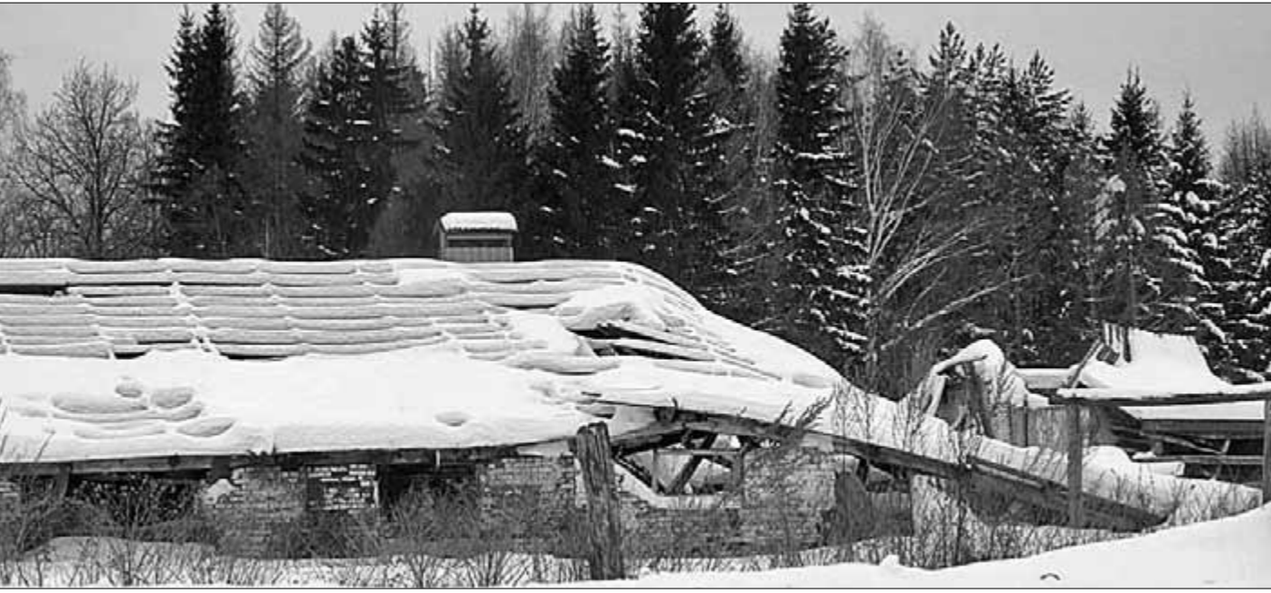
Моргаушский район. Всё, что осталось от когда-то процветавшей фермы.

Пётр ВОРОБЬЁВ. Депутат Моргаушского районного собрания. Чувашская Республика.