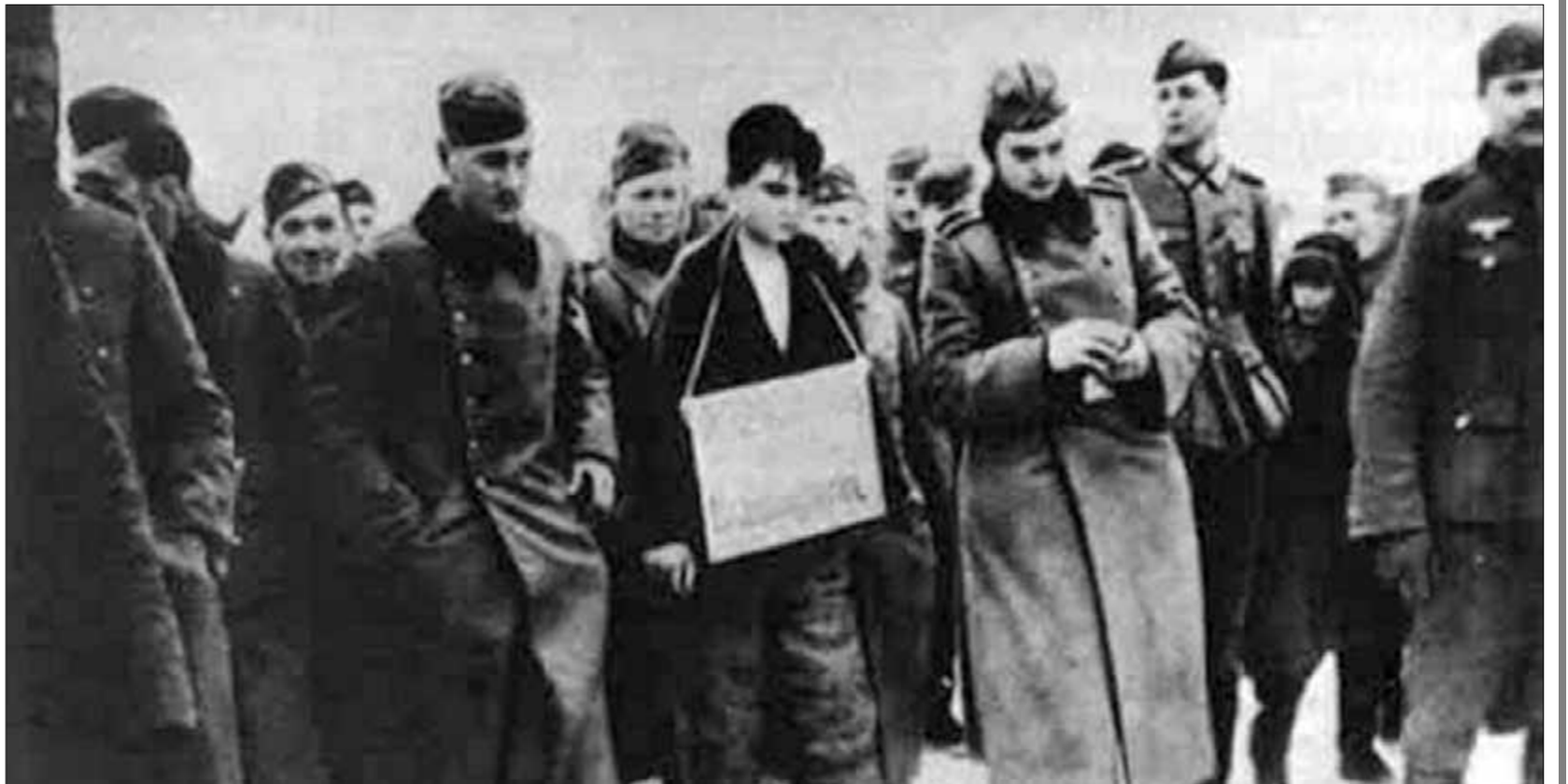
● И вот без малого два года спустя после её казни, 24 октября 1943 года, «Правда» публикует пять фотографий, которые были найдены в сумке немецкого офицера, убитого под деревней Потапово близ Смоленска. Садистски зафиксированы фашистами весь процесс расправы над Зоей — от установки виселицы до трагического финала. На этом снимке орда убийц ведёт несомленную героиню на смерть.