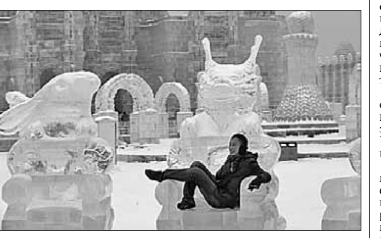
● В городе Харбине, административном центре китайской провинции Хэйлуньцзян, прошёл традиционный международный конкурс снежной скульптуры. В нём участвовали 28 команд, включающих около 110 представителей 12 стран — Китая, России, Франции, Италии, Испании, Латвии, Великобритания, Польши, Индонезии, Республики Корея, Японии и Монголии.