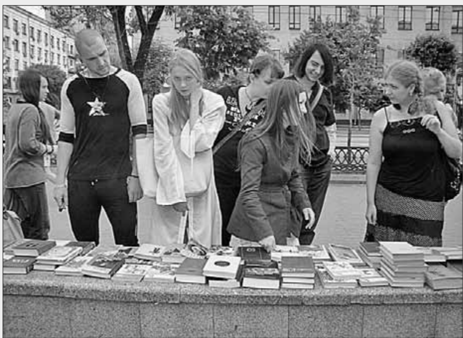
● Как донести хорошие, умные книги до тех, кто в них нуждается? В Хабаровске этому способствует регулярная акция, которую коммунисты, её организаторы, назвали «Книга против деградации». Подробно о ней — в одном из ближайших выпусков страницы «А вы что читаете?»