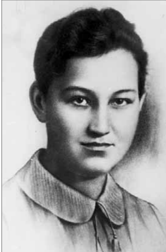
● Впервые вся наша страна и весь мир увидели этот снимок на первой странице «Правды» от 17 февраля 1942 года. Рядом с ним был напечатан Указ Президиума Верховного Совета СССР, которым Зое Анастольевне Космодемьянской присвоено высокое звание Героя Советского Союза — первой из женщин во время Великой Отечественной войны.