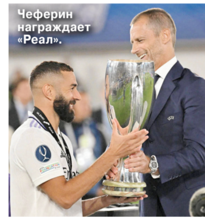
Чеферин награждает «Реал»