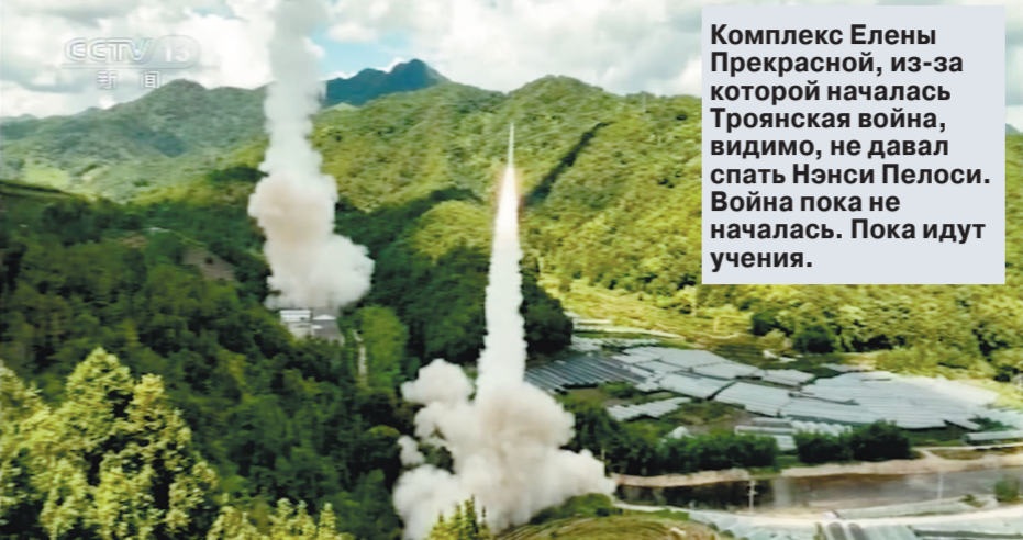
Комплекс Елены Прекрасной, из-за которой началась Троянская война, видимо, не давал спать Нэнси Пелоси.

Даже на уровне пропаганды, как выясняется, никак не помогает. Половина европейцев винит свои правительства и энергетические компании.