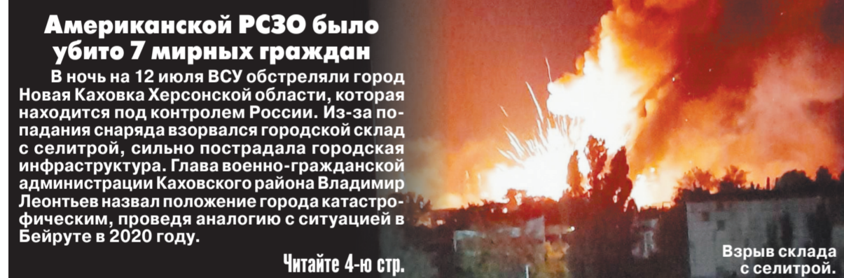
Взрыв склада с селитрой.