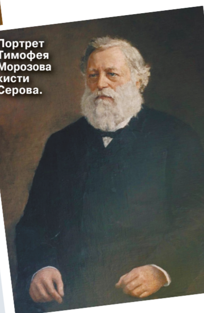
Портрет Тимофея Морозова кисти Серова.