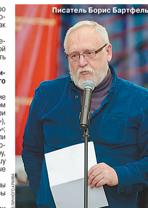
Писатель Борис Барфельд.