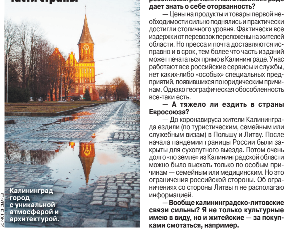
Калининград — город с уникальной атмосферой и архитектурой.