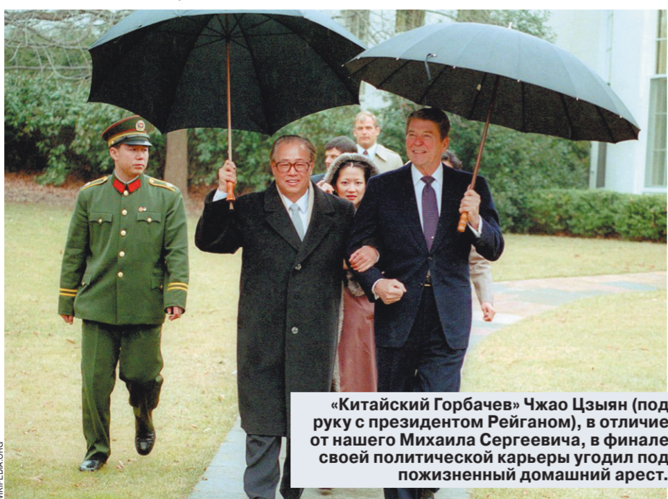
«Китайский Горбачев» Чжао Цзяян (под руку с президентом Рейганом), в отличие от нашего Михаила Сергеевича, в финале своей политической карьеры угодил под позитивный домашний арест.