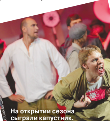
На открытии сезона сыграли капустник.

— Мои претензии были даже не к исполнительнице (я не упоминал ее фамилию), а к руководству театра, которое даже не скрывало, что таким образом решило хайпануть. Но это