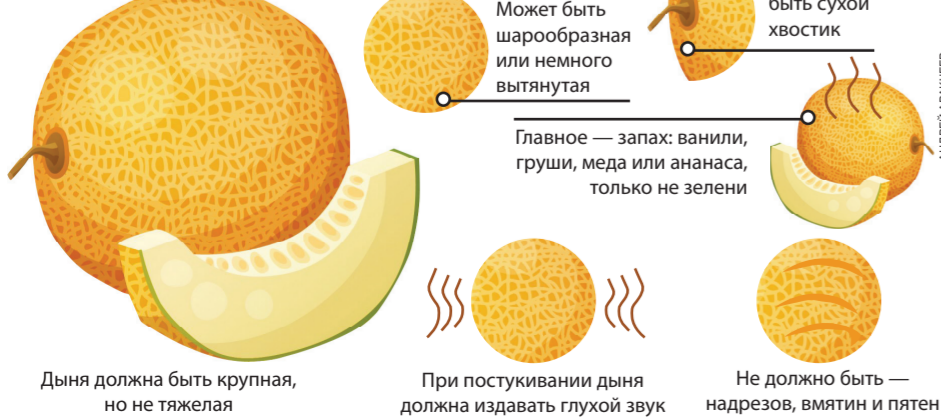
Дыня должна быть крупной, но не тяжелой. У дыни должен быть сухой хвостик. Главное — запах: ванили, груши, меда или ананаса, только не зелени. При постукивании дыня должна издавать глухой звук. Не должно быть надрезов, вмятин и пятен.