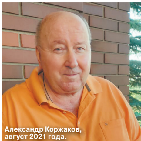
Александр Коржаков, август 2021 года.