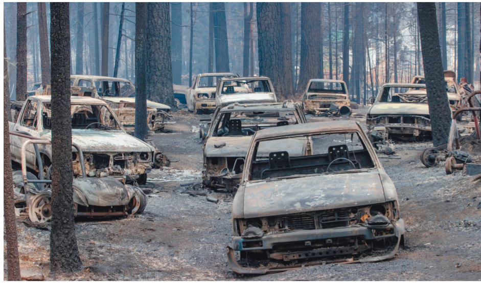
Автомобили из сгоревшего Калдора, уничтоженные огнем, — в лесном массиве. Пожар в Северной Калифорнии полыхает уже несколько дней, полностью выгорели два города. 17 000 человек были вынуждены экстренно покинуть свои дома.