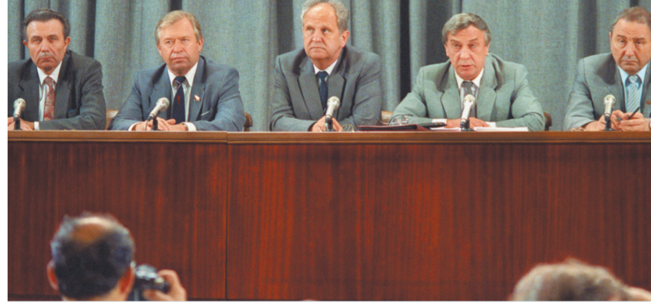
Первая и последняя пресс-конференция членов ГКЧП. «Ребята, добившиеся высоких постов, о стране совершенно не думали. Они просто спасали свои кресла».