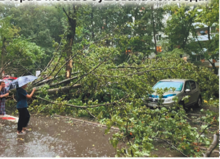
Вчера в Москве бушевала непогода.

продержится в Москве около недели, сменяясь иногда солнцем. — Если учитывать, что до сегодняшнего дня в Москве температурный режим был выше нормы примерно на семь градусов, то погода в ближайшие дни будет соответствовать рамкам климатической нормы для второй половины августа, — сообщила специалист. — Из-за близости атмосферных фронтов вероятны дожди, сопровождаемые грозой и градом. В четверг на западе Москвы температура воздуха не прогреется больше чем до 22 градусов, а вот на востоке и юго-востоке столбики термометров будут подниматься до 25–30 градусов. Но в пятницу повсеместная жара спадет и начнутся дождливые дни, характерные для конца лета, а столбики термометров будут держаться на уровне 18–24 градусов. Стоит отметить, что резкого похолодания не ожидается. Температура будет спадать постепенно, но резкие порывы ветра не исключены.