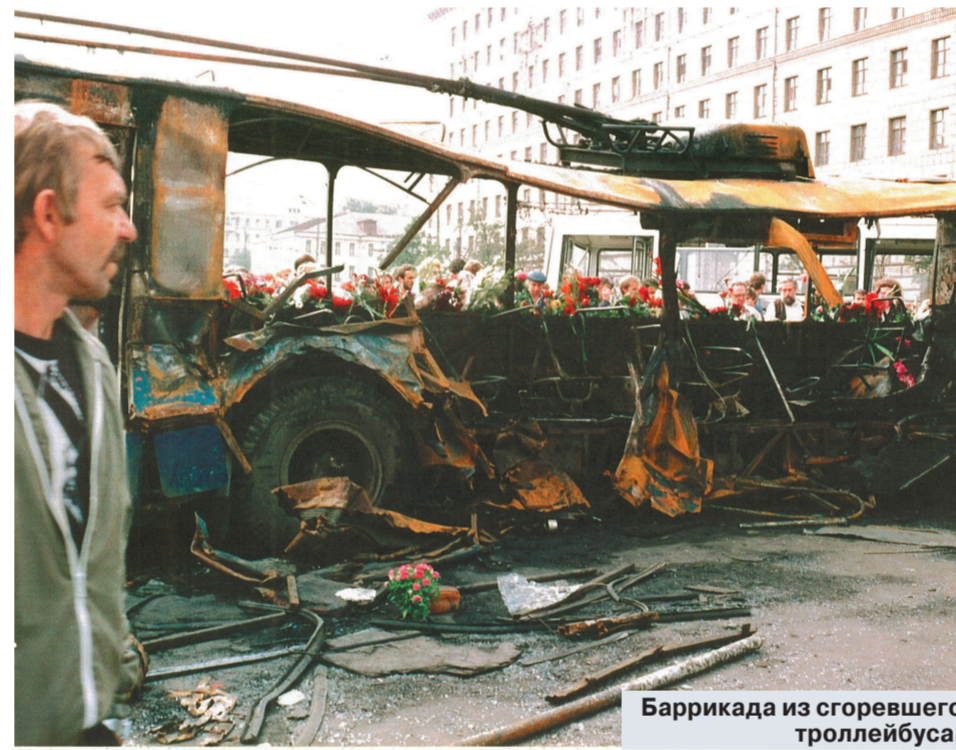
Баррикада из сгоревшего троллейбуса.