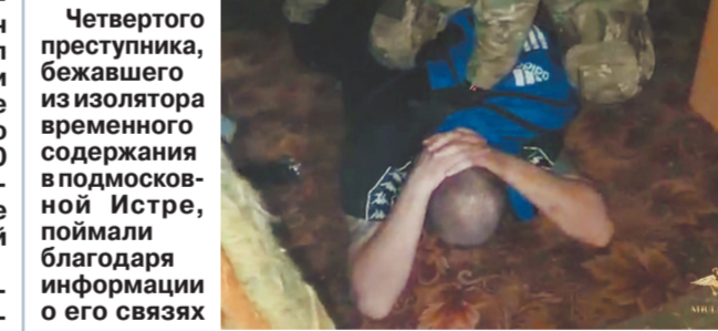
Четвертого беглеца из ИВС поймали по штампу о регистрации