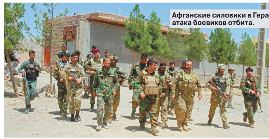
Афганские силовики в Герате: атака боевиков отбита.

Боевики «Талибана» (запрещенная в России террористическая организация) продолжают наступление, захватывая очередные населенные пункты Афганистана. На раз пад город Кундуз — важный политический и военный центр на севере страны.