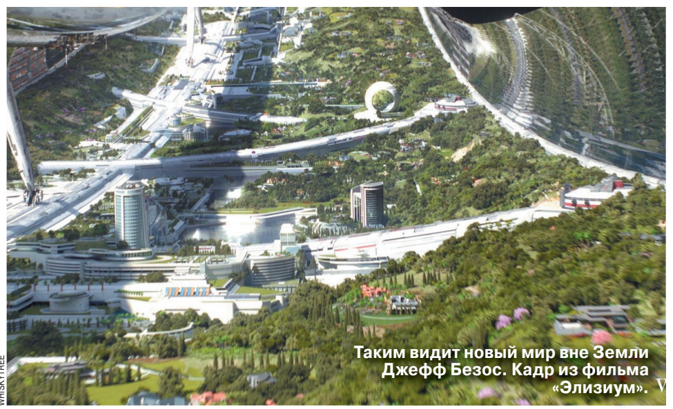
Таким видит новый мир вне Земли Джефф Безос. Кадр из фильма «Элизиум».