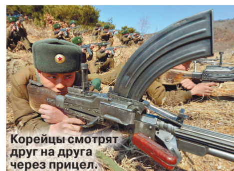
Корейцы смотрят друг на друга через прицел.

Ситуация на Корейском полуострове пропала из повестки дня мировых СМИ. Угрозу ядерной войны в этом регионе в списке глобальных проблем подвинули коронавирус, международный терроризм. Однако опасность конфликта между Севером и Югом никуда не исчезла. Чем воюют армии по обе стороны 38-й параллели и у кого из них больше шансов на победу в возможной войне — проанализировал «МК».