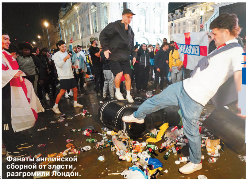
Фанаты английской сборной от злости разгромили Лондон.