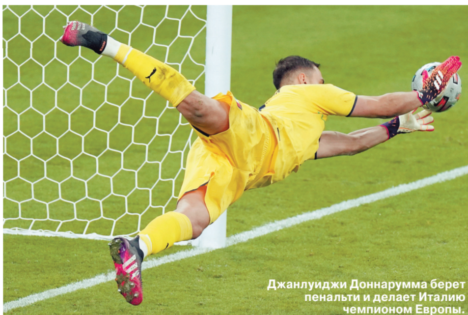
Джанлуиджи Доннарумма берет пенальти и делает Италию чемпионом Европы.

Сборная Англии проиграла титул чемпионов Европы итальянцам в серии пенальти