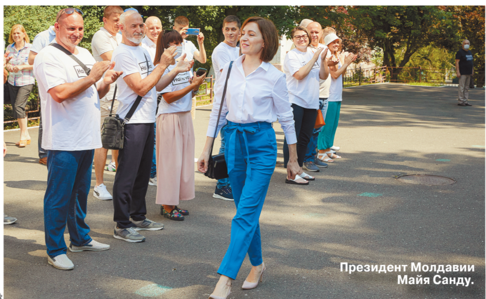
Президент Молдавии Майя Санду.

И вы знаете что? Я вполне могу понять молдавских избирателей. Майя Санду — совсем не героиня моего политического романа. Президента Санду лучше всего характеризуют слова одного моего очень хорошо знающего