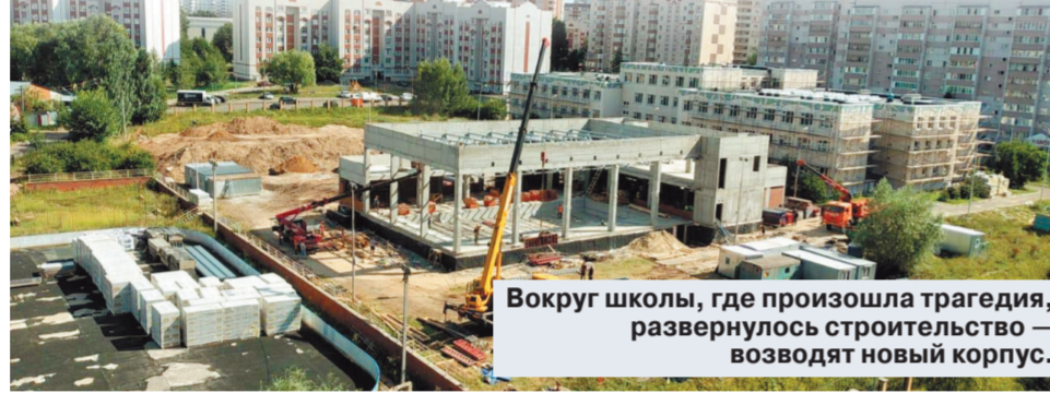
Вокруг школы, где произошла трагедия, развернулось строительство — возводят новый корпус.

оповещения. По данным следствия, неполадки были с входной дверью (был версим о неисправном дроводчике и сломанном замке, которые якобы позволили стрелку беспрепятственно проникнуть в школу), не работал громкоговоритель в классе, где погибло больше всего людей, в основном ученики 8-го «А». Но, как оказалось, с этими обвинениями не все так просто.