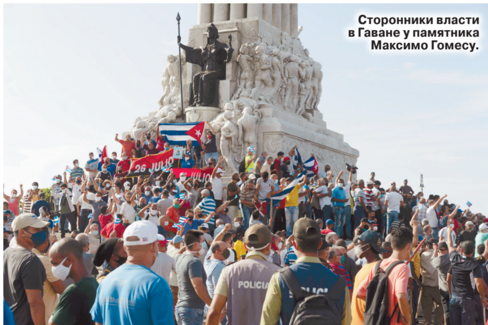
Сторонники власти в Гаване у памятника Максимо Гомесу.

Манифестации быстро перекинулись и на кубинскую столицу. Симптоматично, что среди привлекших и лаконичных лозунгов вроде «Свобода, родина!» звучали призывы к уходу президента Мигеля Диас-Канеля. О радикализации протестов в начале мирных демонстраций говорят то обстоятельство, что митингующие начали отвечать на попытки разогнать шестия: перерождывали полицейские