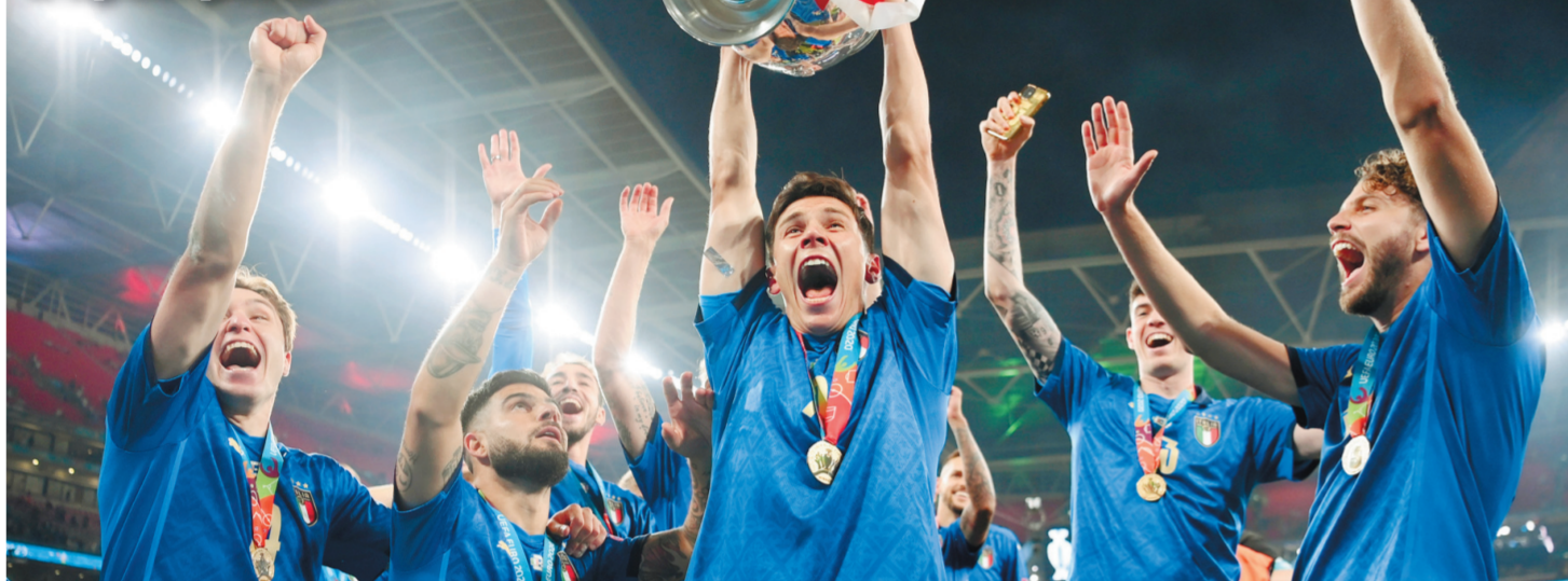
Итальянские футболисты ликуют: они — чемпионы Европы.

Англичане поставили на карту многое и проиграли