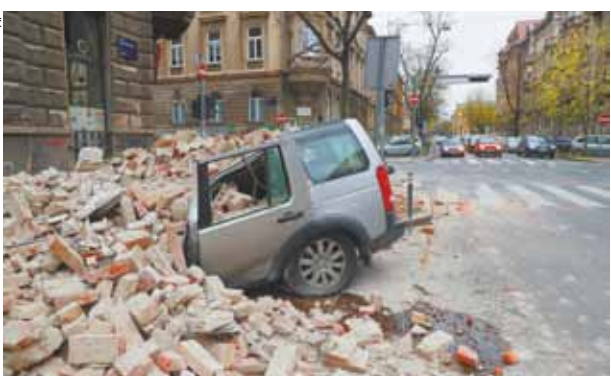
последствия катаклизма. Материальный ущерб пока не оценен.

В Загребе, столице Хорватии, произошло сильнейшее за последние 140 лет землетрясение. Об этом сообщил премьер-министр страны Андрей Пленкович.