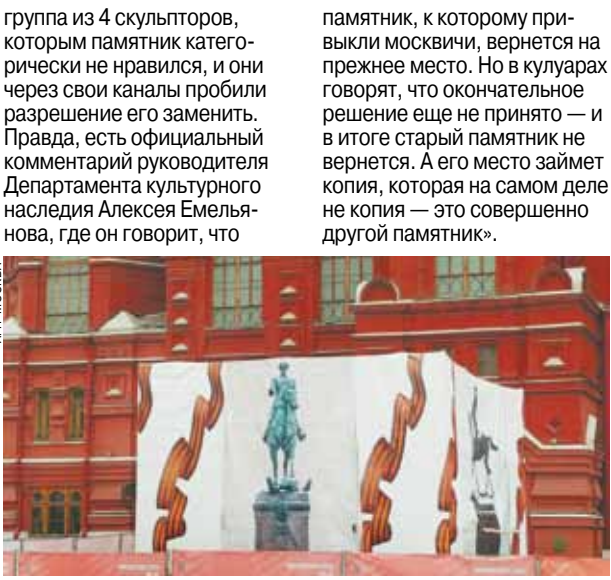
памятник, к которому приехали москвичи, вернется на прежнее место.

Памятник маршалу Жукову снова увезли с привычного места у Государственного исторического музея в Москве.