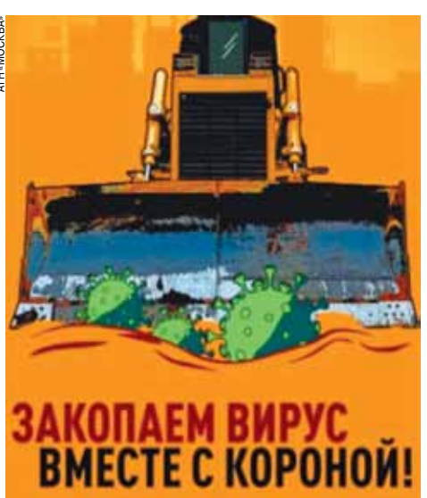
Строители, счет идет на минуты!