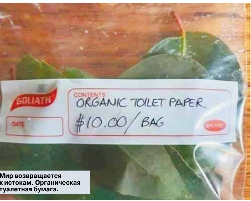
Мир возвращается к истокам. Органическая туалетная бумага.

«Я не вижу прямо сейчас угрозы того, что операторы окажутся не готовы и скорость Интернета будет сильно падать. Технологически сети нового поколения достаточно мощные и позволяют пересылать большой поток информации. Не думаю, что это как-то скажется на конечном пользователе».