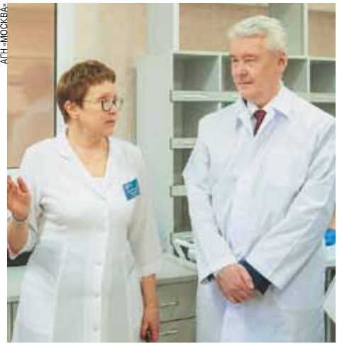
одним из главных направлений борьбы с коронавирусом является своевременное, быстрое, качественное тестирование групп риска.

Сотрудничество городских лабораторий с лабораториями Роспотребнадзора позволит создать двойной контроль. На сегодняшний день