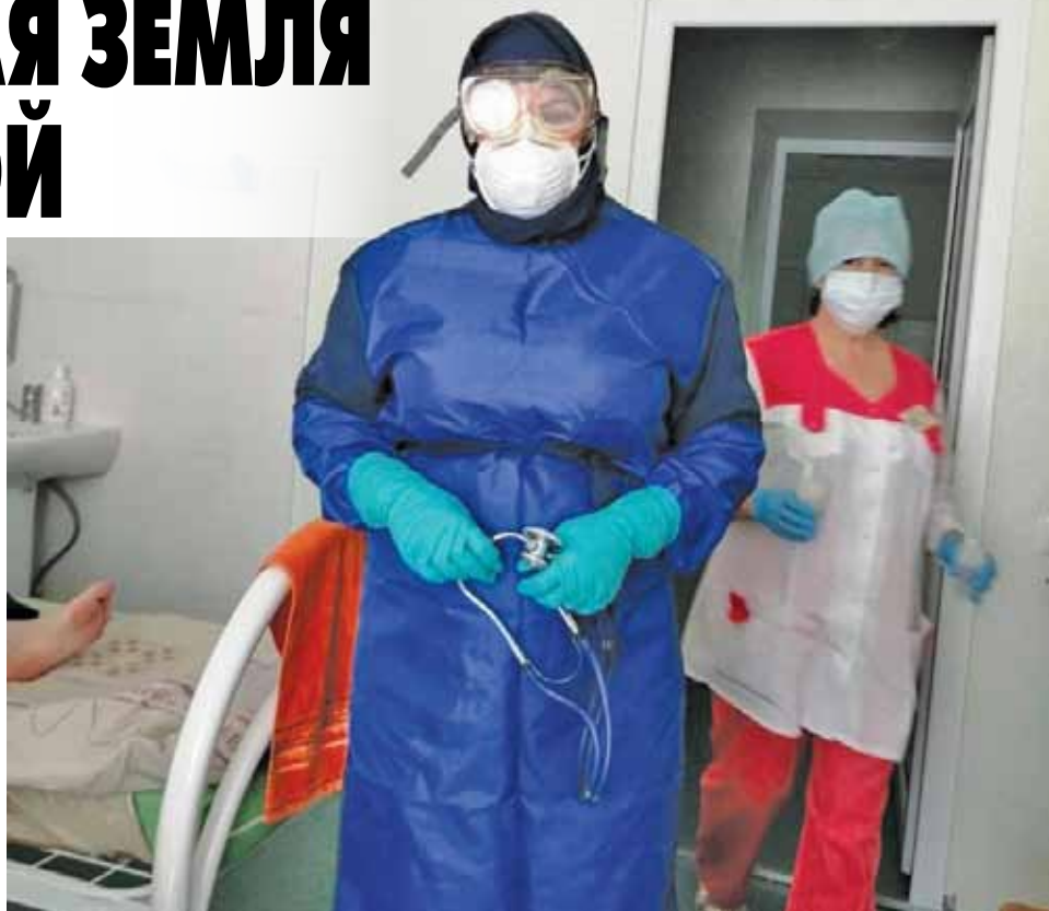
Традиционный утренний врачебный обход напоминает фильм ужасов.

— У меня и ребят — нет, но у самих врачей — да, и не один раз. У нашей медсестры