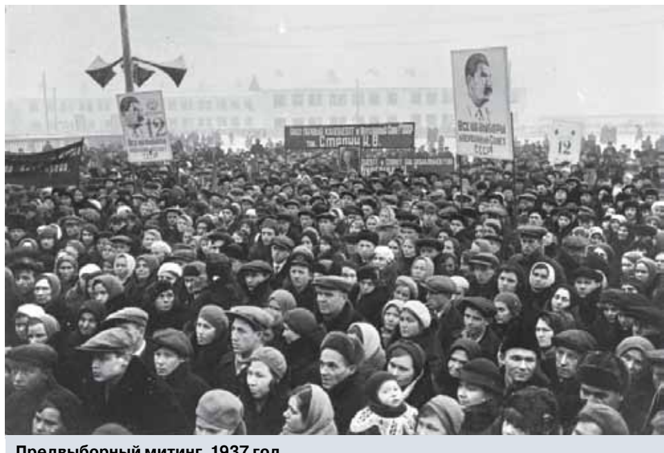
Предвыборный митинг, 1937 год.