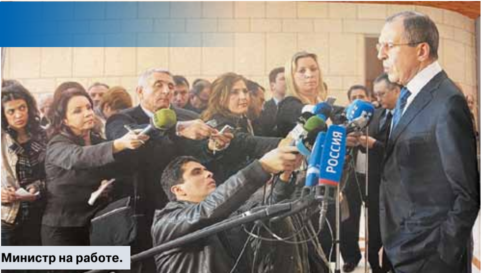
Министр на работе.

Обычно подобные «штатные весельчаки» совсем не активничают, когда речь идет о выполнении своих прямых профессиональных