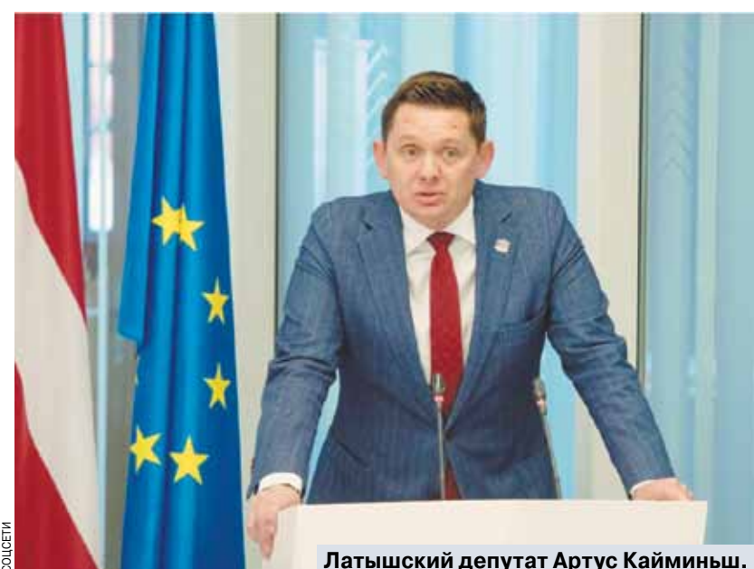
Латышский депутат Артус Кайминьш.