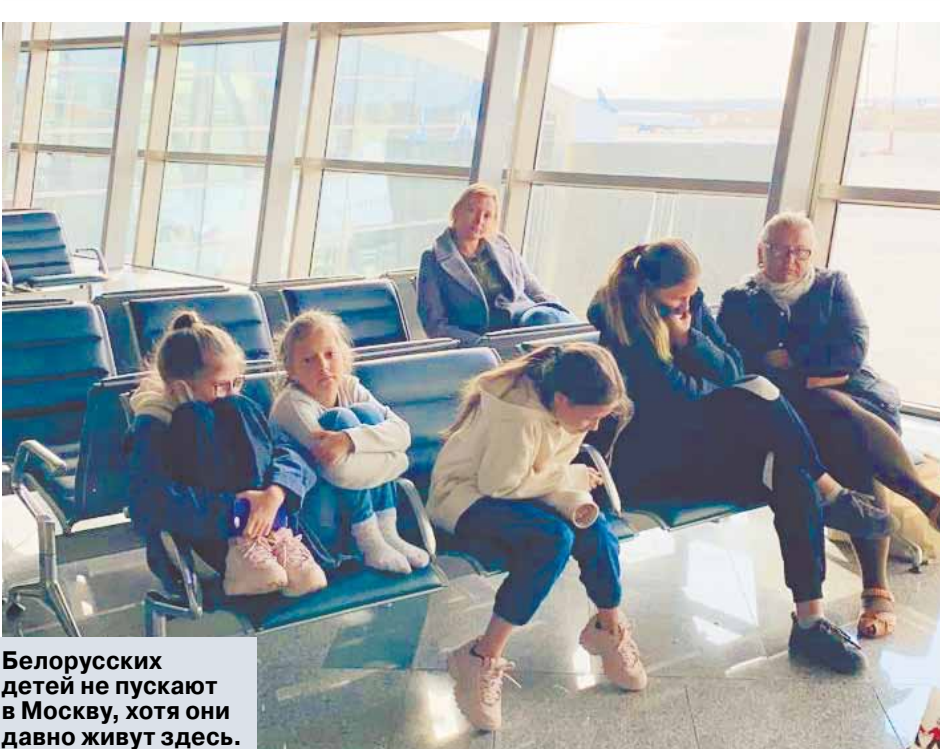
Белорусских детей не пускают в Москву, хотя они давно живут здесь.

— 10 марта после поездки в Пятигорск по делам вечером поднялась очень высокая температура. До этого никаких признаков не было, наоборот, планировал бассейн и пробежки — погода у нас совсем весенняя. В дороге случилась авария, вышел из строя бензонасос, я с ним возился на трассе. Вероятность переохлаждения была, хотя по ощущениям я не замерз. Когда вернулся домой, сбил температуру и лег спать. Однако на следующий день утром она снова поднялась, и в офисе я уже не пошел, работал из дома. 14–15 марта обратился к медикам в диагностический центр. Терапевт услышала хрипы в легких. После рентгена подтвердили правостороннюю пневмонию и выдали направление на срочную госпитализацию. У всех ребят, которые здесь со мной, в принципе похожие истории. Моего соседа по палате Дмитрия вообще привезли на «скорой» с мигалками — у него двустороннее воспаление легких.