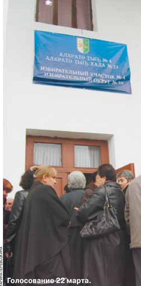
Голосование 22 марта.

Хотел бы напомнить, что в 2015 году был принят Закон о противодействии коррупции и новые власти создали управление по противодействию коррупции в Генеральной