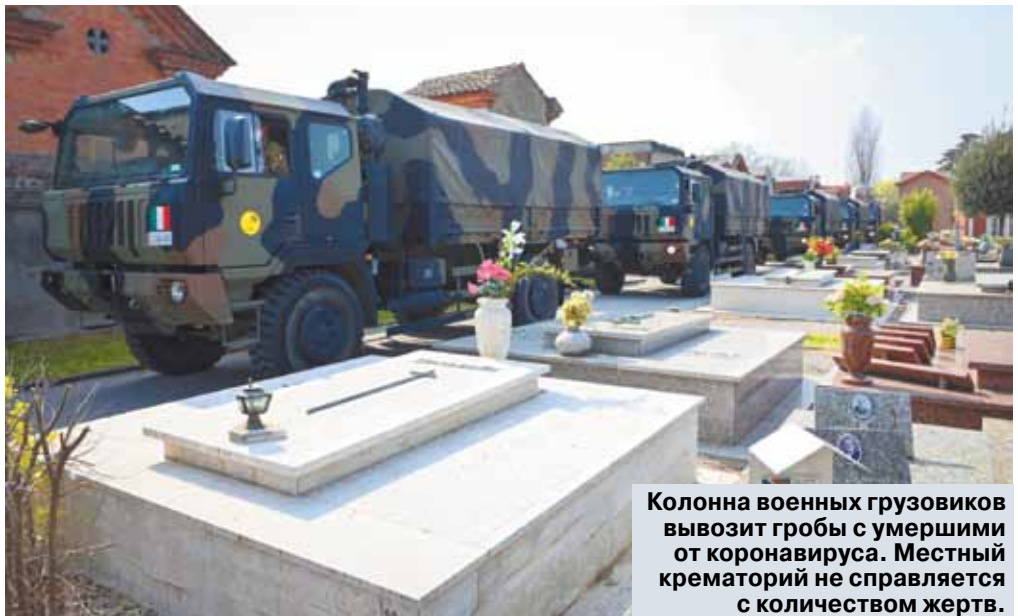
Колонна военных грузовиков вывозит гробы с умершими от коронавируса. Местный крематорий не справляется с количеством жертв.

Мягкий режим — это значит, что людям из группы риска рекомендовано сидеть дома, работодателям — перевести работников на удаленку. Массовые мероприятия отменены, школы закрыты, установлено предельное количество граждан, которым можно одновременно собираться вместе. В нашем случае это 50 человек.