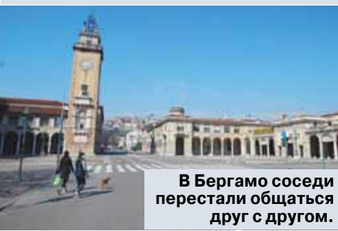
В Бергамо соседи перестали общаться друг с другом.

бергамцы не станут лишней раз обращаться к врачам, будут лежать дома с температурой, пока совсем не припечет. Вот когда больные начинали задыхаться, тогда и звонили в «скорую». Поэтому так много смертей, спасти людей оказалось поздно. Сейчас ходят слухи, что официальная статистика по Италии занижена. Многие умирают дома, даже не подозревая, что подхватили коронавирус.