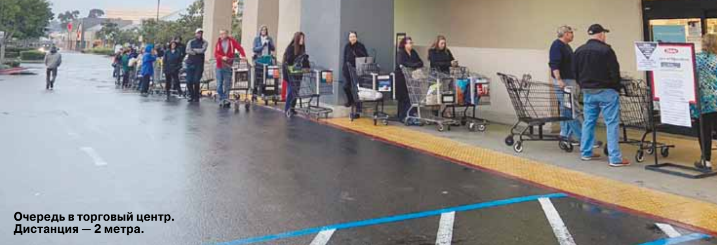
Очередь в торговый центр. Дистанция — 2 метра.

Готовы ли мы к жесткой социальной изоляции, как в Европе