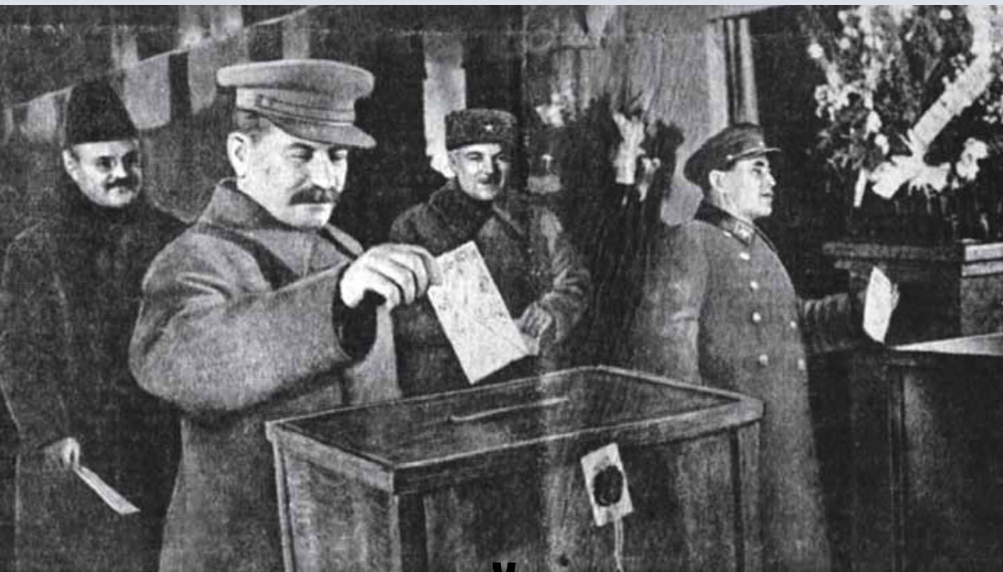
Сталин, Молотов, Ворошилов и Ежов на выборах депутатов Верховного совета СССР, 12 декабря 1937 года.

Пришлось, продолжил вожьд, отложить в сторону и категорию №2 — «такие поправки и дополнения, которые пытаются внести в Конституцию элементы исторических справок или элементы декларации о том, чего еще не добилась советская власть и чего она должна добиться в будущем». Потому что «для этого дела имеются у нас другие пути и другие документы».