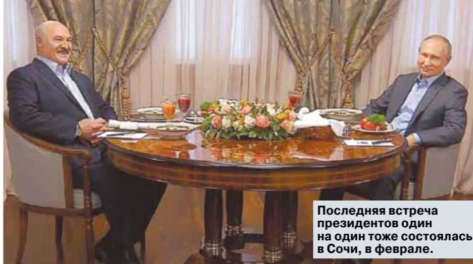
Последняя встреча президентов один на один тоже состоялась в Сочи, в феврале.

Кремль до последнего не раскрывал место встречи Владимира Путина и Александра Лукашенко.