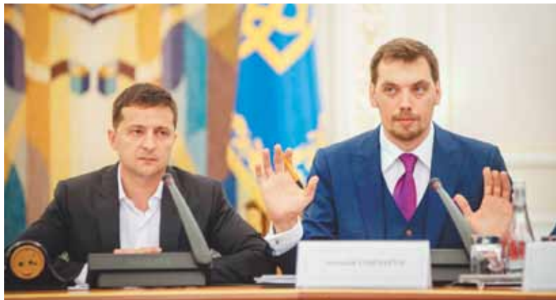
Два «профана» в экономике: президент и премьер Украины.

О том, как запись вообще появилась, история умалчивает, но вопрос об отставке премьер-министра в обществе был поднят спустя несколько минут после ее публикации. При этом появление первого файла на канале «Как обмануть президента» совпало с заседанием президентской фракции «Слуга народа». Ряд парламентариев потребовали немедленно поставить вопрос об увольнении премьер-министра. Среди них — Александр Дубинский, Максим Бужанский и Александр Кунцицкий: известно, что эти парламентарии близки к олигарху Игорю Коломойскому,