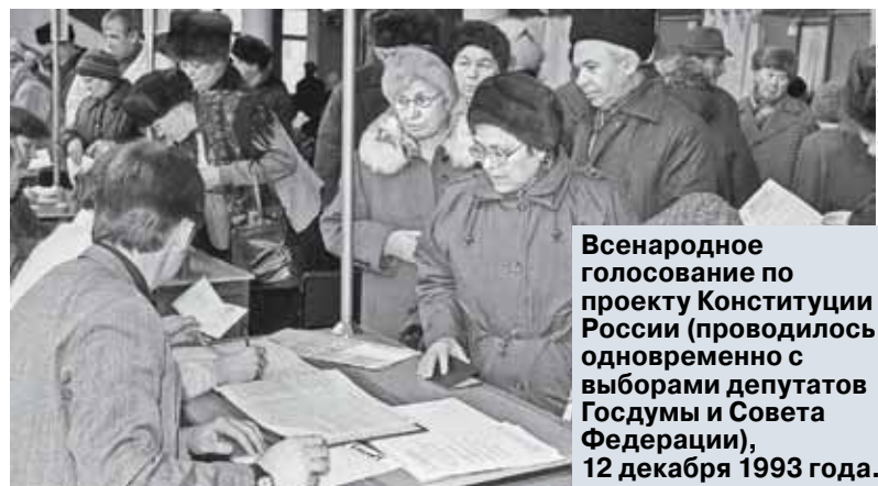
Всенародное голосование по проекту Конституции России (проводилось одновременно с выборами депутатов Госдумы и Совета Федерации), 12 декабря 1993 года.