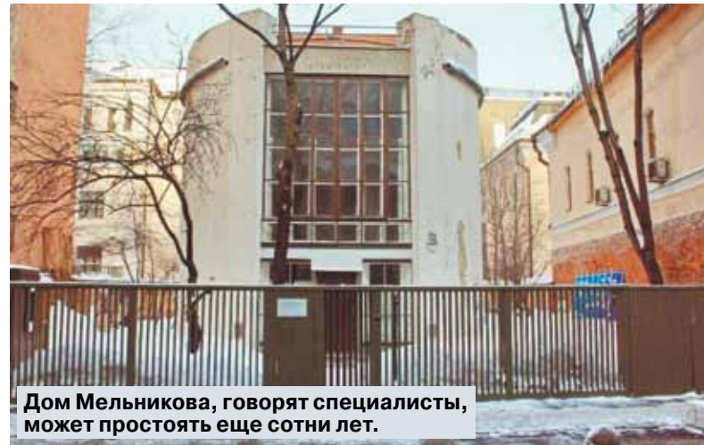
Дом Мельникова, говорят специалисты, может простоять еще сотни лет.