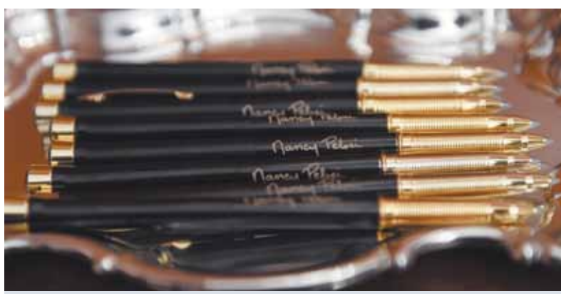
Золотые ручки в виде пуль с выгравированным именем Нэнси Пелози — то, чем запомнилась передача импичмента в Сенат.

Теоретически среди консерваторов могут найтись три сенатора, которые все же поддержат обвинение: среди них экс-кандидат в президенты и давний ненавистник Трампа Митт Ромни и две представительницы северных штатов с традиционными умеренными взглядами: Сьюзан Коллинз из Мона и Лиза Мурковски с Аляски.