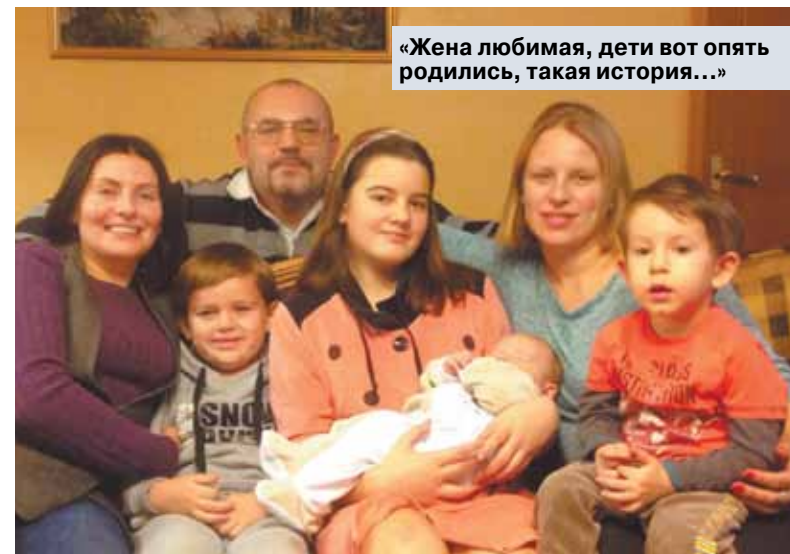
«Жена любимая, дети вот опять родились, такая история...»

— Да, удивительное дело, оно случилось в день моего трехлетия 26 апреля. Самое фантастическое, что есть кино-лента (дядя снимал), где я бегу по дому почти трехлетний, а на следующий день этот дом развалился, причем я там чудом выжил. За несколько недель до землетрясения у меня появлялись странная привычка: я в своей кровати разворачивался поперек. Кровать стояла в углу, и когда случился землетрясение, если бы я не развернулся, меня бы просто не было: на подушку упал огромный кусок лепного карниза, там стена выпала удом. Я, конечно, все помню, это сложно забыть. По городу бегали женщины в ночных рубашках, полуголые, а кругом