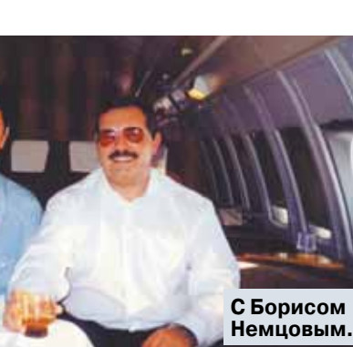
С Борисом Немцовым.

Лот № 1 земельный участок и нежилые здания, расположенные по адресу: Челябинская обл., г. Челябинск, ул. Героев Танкограда, д. 32-н, по начальной цене 27.069.789,00 руб. и Лот № 2 земельный участок и нежилые здания, расположенные по адресу: Свердловская обл., г. Екатеринбург, ул. Монтанжских, д. 22, по начальной цене 82.638.300,00 руб. признаны несостоявшимися. Договор купли-продажи по начальной цене подлежит заключению с единственным подавшим заявку на участие в торгах, чья заявка на участие содержит предложение о приобретении Лота № 1 — ООО «УРАЛСПЕЦТЕХНИКА» (ИНН 74449042489, 454081, Челябинская обл., г. Челябинск, ул. Героев Танкограда, д. 28П, оф. 116).