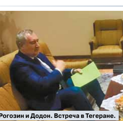
Рогозин и Додон. Встреча в Тегеране.

Какая там у советского поэта: «Гвозди бы делал из этих людей»? Можно, наверное, и гвозди. Но пока подготовка, по всей видимости, идет к предстоящим выборам главы государства. Если у кого-то и были сомнения в способности Путина, которому в октябре исполнится 65 лет, это один срок «пахать, как раб на галерах», то после кадров подводной рыбалки они должны были отпасть сами собой. Даже западные СМИ вывод на сей раз сделали однозначный: «Здоров, полон сил и еще ого-го». Хотя сам Путин еще официально не объявил о своем намерении участвовать в президентских выборах 2018 года, а несколько дней назад в Бурятии на просьбу ветерана об этом всего лишь обещал «подумать».