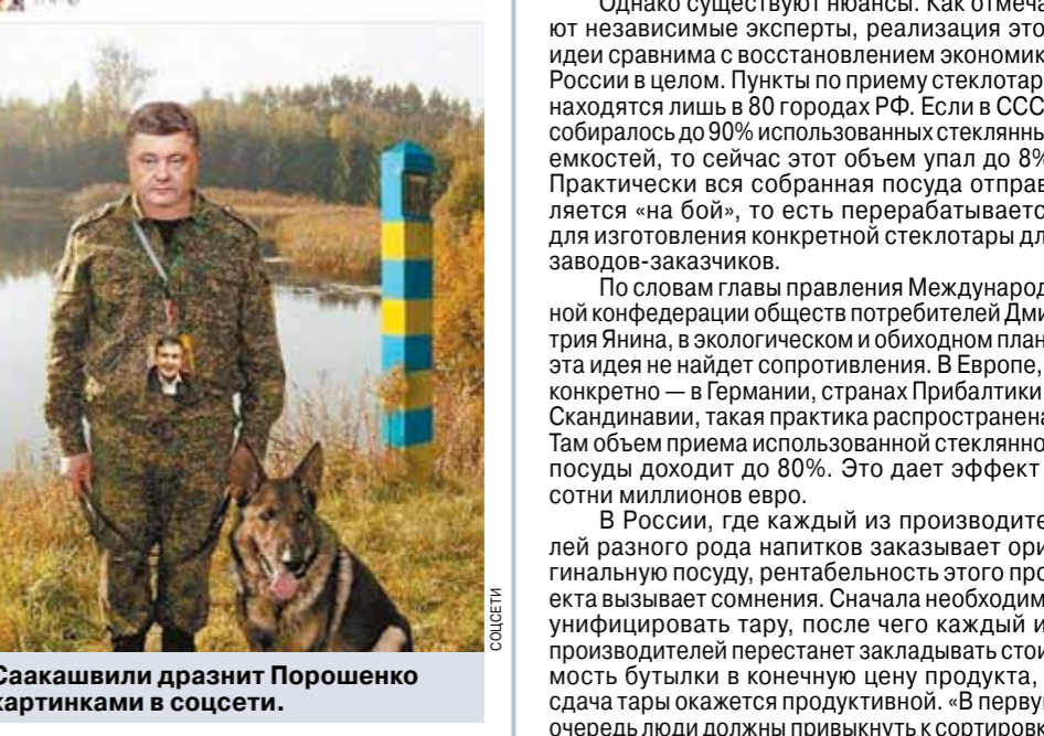
Саакашвили дразнит Порошенко картинками в соцсети.

Саакашвили дразнит Порошенко картинками в соцсети. Саакашвили заявил, что на его запрос по этому поводу Генеральная прокуратура Украины ответила, что не передавала в Государственную миграционную службу документы по поводу прекращения его украинского гражданства. Это письмо он украл и выложил на своей странице в соцсети. А еще экс-глава Одесской области пообещал оспорить лишение гражданства в суде. И привлечь к этому процессу внимание мировой общественности. Собственно, сейчас именно привлечением внимания Саакашвили и занимается.