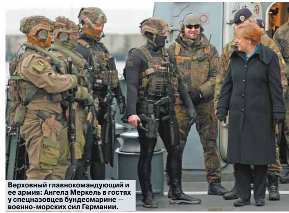
Верховный главнокомандующий и ее армия: Ангела Меркель в гостях у спецназовцев бундесмарине — военно-морских сил Германии.