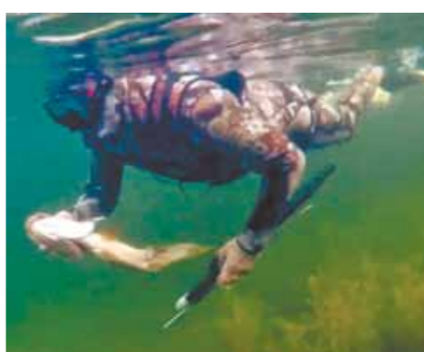
...и в 2017 году.

Какая там у советского поэта: «Гвозди бы делал из этих людей»? Можно, наверное, и гвозди. Но пока подготовка, по всей видимости, идет к предстоящим выборам главы государства. Если у кого-то и были сомнения в способности Путина, которому в октябре исполнится 65 лет, это один срок «пахать, как раб на галерах», то после кадров подводной рыбалки они должны были отпасть сами собой. Даже западные СМИ вывод на сей раз сделали однозначный: «Здоров, полон сил и еще ого-го». Хотя сам Путин еще официально не объявил о своем намерении участвовать в президентских выборах 2018 года, а несколько дней назад в Бурятии на просьбу ветерана об этом всего лишь обещал «подумать».