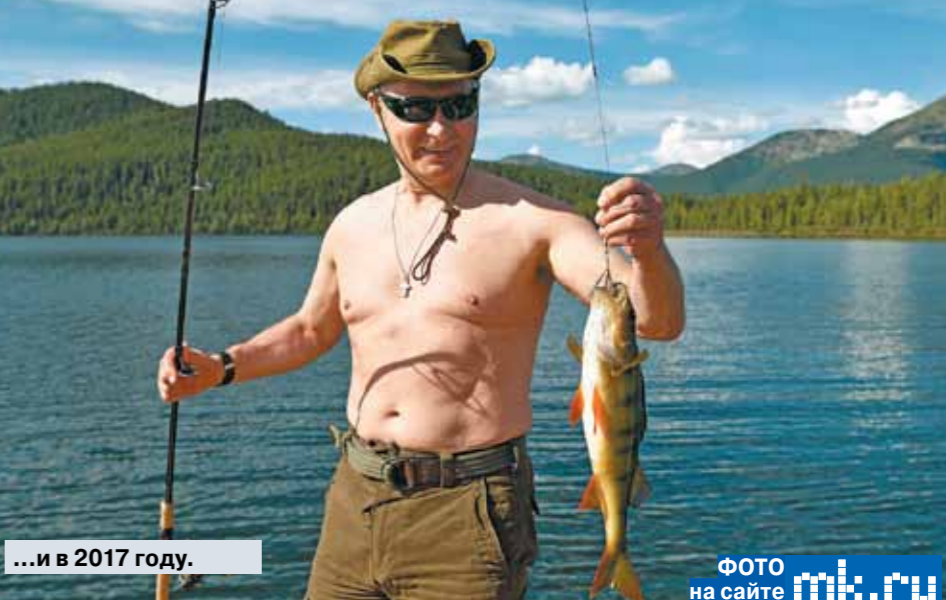
...и в 2017 году.

ИЗ-ЗА ВМЕШАТЕЛЬСТВА РУМЫНИИ — страны, которая мечтает проглотить Молдавию и действует в одной связке с США против России, — попытка Рогозина добраться в Кишинев на обычном пассажирском самолете заканчивается провалом. Рогозин выглядит как политик, который попал в унизибельную ситуацию и потерявший лицо. Спешпредставитель Президента РФ усугубляет эту неудобную ситуацию, заявляя Румынии: «Дождитесь ответа, гады!» — Румыния от этого