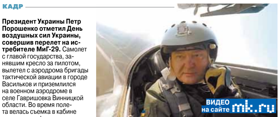
ВИДЕО на сайте mk.ru

Президент Украины Петр Порошенко отметил День воздушных сил Украины, совершив перелет на истребителе МиГ-29. Самолет с главой государства, занявшим кресло за пилотом, вылетел с аэродрома бригады тактической авиации в городе Васильков и приземлился на военном аэродроме в селе Гавришовка Винницкой области. Во время полета велась съемка в кабине самолета, зафиксировавшая различные эмоции на лице президента Украины. Между тем порошенковский перелет на МиГ-е вызвал в украинском