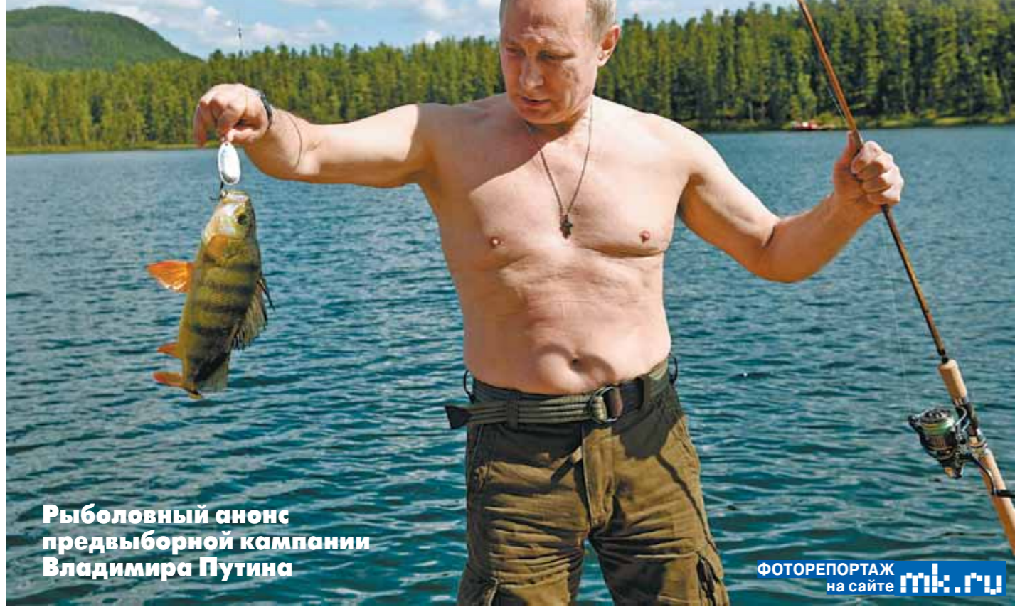
Рыболовный анонс предвыборной кампании Владимира Путина