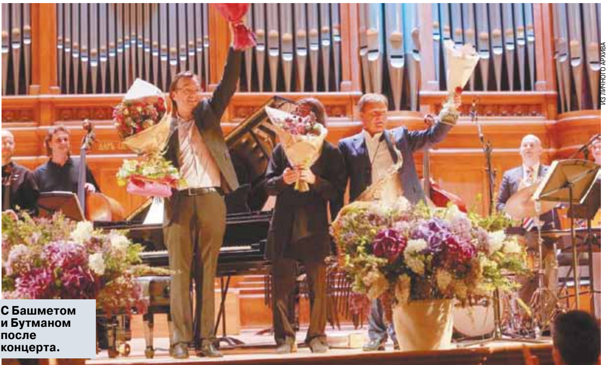
С Башметом и Бутманом после концерта.