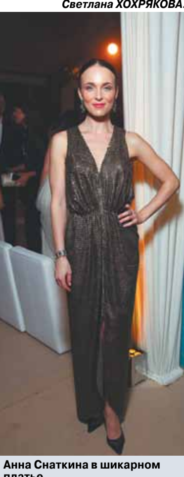
Анна Снаткина в шикарном платье.

в фильме лагерь для нелегальных иммигрантов в Кале. На подмогу она призвала Рейфа Файнса, который появляется в образе шекиперовского Просперо в «Буре». Игровой фрагмент вошел в документальную картину, чтобы напомнить о вечных скитаниях человека, имеющего право на пристанище. Ванесса Редгрейв рассказала в Каннах о своем послыше: «Многие сегодня не знают истории, и я хочу им ее напомнить. Мне 80, и пару лет назад я перенесла сердечный приступ. Так что времени в запасе почти нет. Я хочу сделать все, чтобы нашу картину увидели в школах. Сейчас сильна угроза возвращения холокоста, поскольку европейские страны шире распахнули двери для беженцев. Мы должны проявлять сострадание к ним и не допустить победы фашизма».