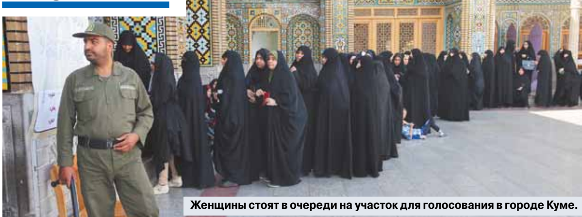
Женщины стоят в очереди на участок для голосования в городе Куме.