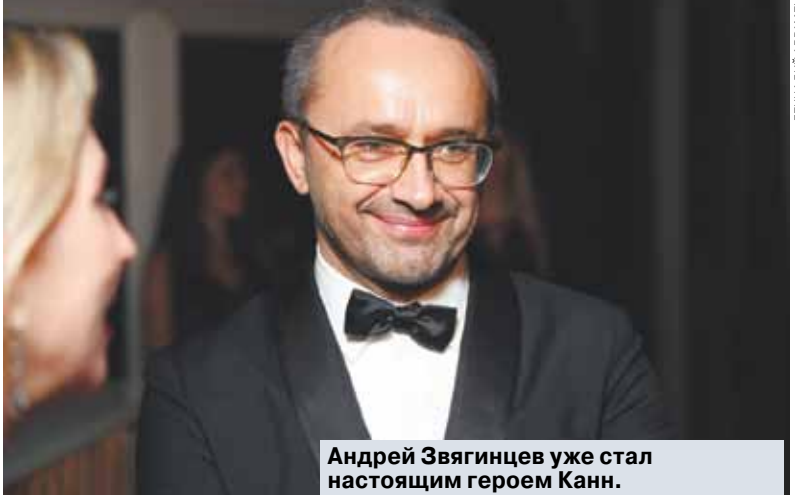
Андрей Звягинцев уже стал настоящим героем Канн.