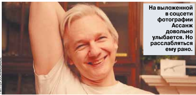
На выложенной в соцсети фотографии Ассанж довольно улыбается. Но расслабляться ему рано.

В записке, отправленной в Стокгольмский окружной суд, прокурор Нью сообщает, что отзывает решение об аресте