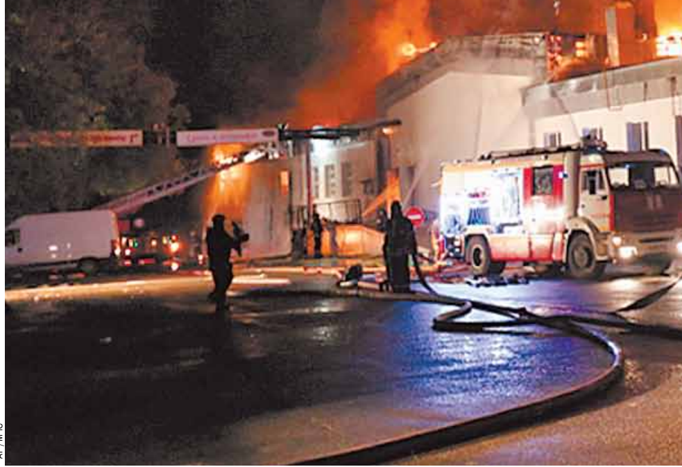
Челобатарев. — Но проблемы есть. В начале года было отменено несколько конкурсов на закупку обмундирования.

Более того, существуют проблемы даже в банальном расчете потребностей пожарных в экипировке.