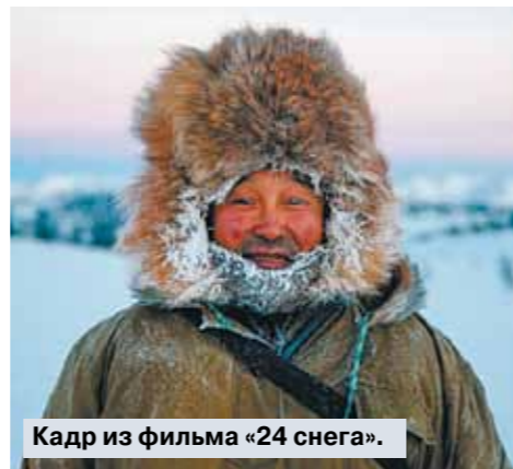
Кадр из фильма «24 снега».

Символами Якутии на протяжении многих лет были алмазы и мамонты. Теперь появился новый бренд — якутское кино, что и засвидетельствовал проходивший в Республике Саха IV Международный кинофестиваль.