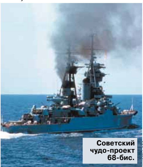
Советский чудо-проект 68-бис.

Проект советских конструкторов под кодовым обозначением «68-бис» оказался очень удачным. Первый артиллерийский крейсер этой серии, получивший название «Свердлов», уже вскоре после своего спуска на воду публично продемонстрировал уникальные возможности. Прибыв в апреле 1953-го на Спидхедский рейд для участия в морском параде по случаю коронации английской королевы Елизаветы II, советский корабль на глазах у изумленных британцев ошвартовался их фирменным способом фертионг — да как! Если по нормам королевского флота на такую швартовку отводился 1 час 20 минут, если прибывшие перед «Свердловом» американские и французские корабли потратили на фертионг более двух часов, а шведов не хватало даже четырех, то советские моряки управились за 12 минут!