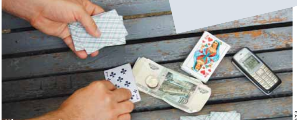
Уберет ли новый закон о лотереях махинаторов и обманщиков?

главной целью стало формирование списка легальных лотерей, при помощи которого контролеры и милиция смогли бы вычислить и наказать лохотронщиков.