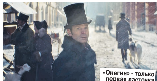
«Онегин» - только первая ласточка