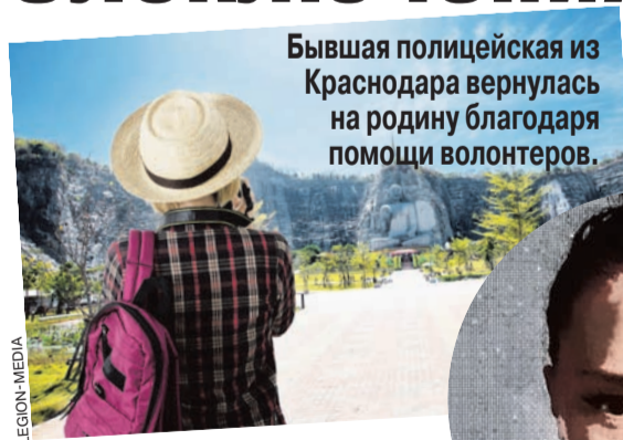
Бывшая полицейская из Краснодара вернулась на родину благодаря помощи волонтеров.