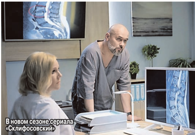
В новом сезоне сериала «Склифосовский»

- Мне этот вопрос кажется не совсем справедливым. Если это приносит творческое удовольствие, если команда, с которой я работаю, мне приятна и мне сюда хочется приходить и делать свою работу - почему бы мне это не делать, что может мне помешать или надоест? И потом это же, как известно, один из самых успешных фильмов в нашей стране. Если он зрителям не надоел, то я не понимаю, почему он должен у меня набить оскомину? Я также параллельно каждый вечер выхожу на сцену в театре - мне же это не надоест. Это моя профессия. Вам же, например, не надоест задавать вопросы? Моя профессия - приносить радость людям, и я стараюсь добросовестно и с удовольствием делать свое дело. Можно, наверное, просидеть какое-то время в ожидании каких-то других ролей, но я не такой человек - я не умею сидеть на месте. Скажем так, что мне это просто неинтересно. Когда мне говорят, например, почему ты берешься за эту работу: гастролы, театры, курс актерский и так далее, я отвечаю, что беру лишь то, что мне предлагает судьба. Она и так ко мне достаточно щедра, и я стараюсь придерживаться правила: не кусай ту ладонь, которая тебя