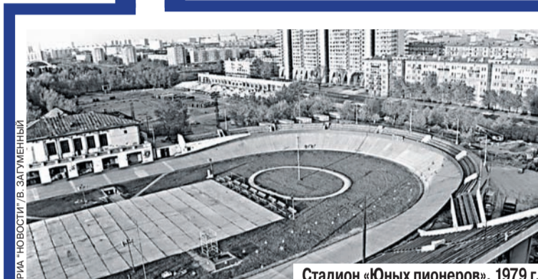
Стадион «Юных пионеров». 1979 г.

После революции, в 1926 году, стадион стал меккой детского спорта. Появились новая футбольная арена, легкоатлетические дорожки, специальные площадки для легкой атлетики, баскетбольные и волейбольные площадки, теннисные корты, тир, велодром. Под северной