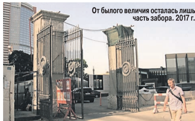
От былого величия осталась лишь часть забора. 2017 г.

Так незаметно знаменитый стадион исчез с карты Москвы. Об уничтожении спортивного центра гневно высказалась знаменитый тренер Татьяна Тарасова. Именно здесь она еще девочкой начала учиться фигурному катанию. А потом на этом льду вырастила немало высококлассных спортсменов. Неудивительно, что ее сообщение в «Фейсбуке» было более чем эмоционально. «Именно это место в Москве нужно было уничтожить? Твари, не имеющие памяти, не имеющие уважения к истории родного города, уважения к славному началу нашего советского и российского олимпийского движения! Почему не умеем беречь? Почему умеем разрушать? Мы жили там, это был наш дом! Эти городские