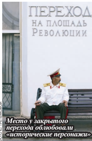
Место у закрытого перехода облюбовали «исторические персонажи»

Все приведенные в статье ссылки на историю возникновения так называемого грота легко могут быть опровергнуты существующими документами - поста-