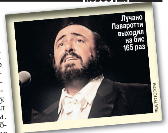
Лучано Паваротти выходил на бис 165 раз

Поразительный рекорд установила Валентина Загорецкая, она попала в Книгу рекордов Гиннеса трижды - в 1976, 1987 и 1998 годах - как женщина с наибольшим количеством прыжков с парашютом в мире. На ее счету более 11 500 прыжков с парашютом!