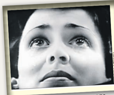
Ирина Роднина не проиграла ни одного состязания

Чукотки до Арктики. Тем самым они установили мировой рекорд по дальности заплыва в ледяной воде и получили право пронести факел с олимпийским огнем в 2014 году.