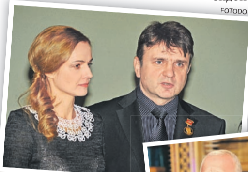
Малахов, Меньшова, Кизяков... А кто следующий? Неужели Якубович?

- Слухи идут и будут идти. Потому что нет официального релиза - о закрытии тех или иных передач зрители узнают буквально в последний момент, и информация, как правило, неполная. Первый канал не в диалоге с аудиторией, это однозначно. Так, на-