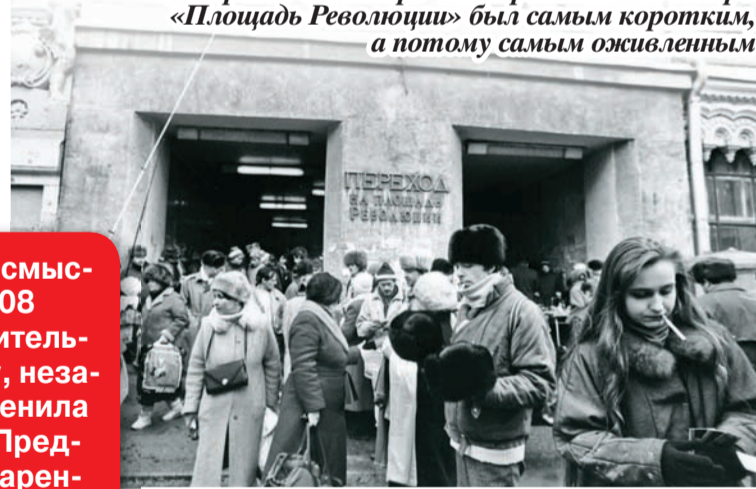
Переход от метро «Театральная» до метро «Площадь Революции» был самым коротким, а потому самым оживленным

В результате натуральных охранных археологических работ, связанных с реконструкцией крытого пешеходного перехода от стан-