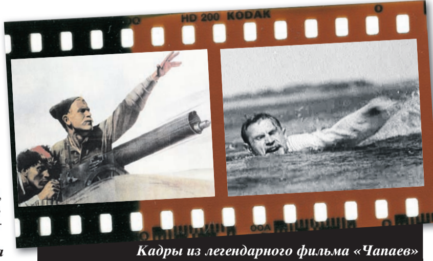
Кадры из легендарного фильма «Чапаев»

скрытно приближалась к городу. Самое удивительное, что войска Чапаева обладали даже собственной авиационной разведкой, большой редкостью для тех лет. Вот только летчики вели себя несколько странно. Вернувшись из воздушной разведки, они докладывали, что белых поблизости нет. Но они просто не могли не за-