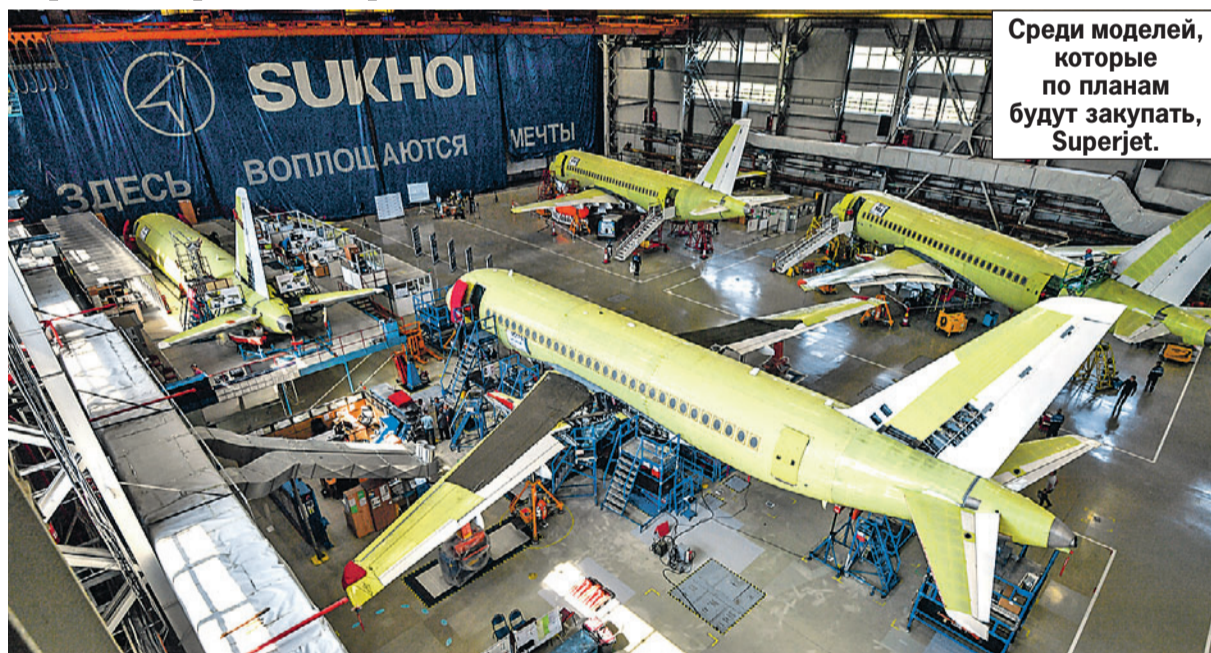
Среди моделей, которые по плану будут закупать, Superjet.