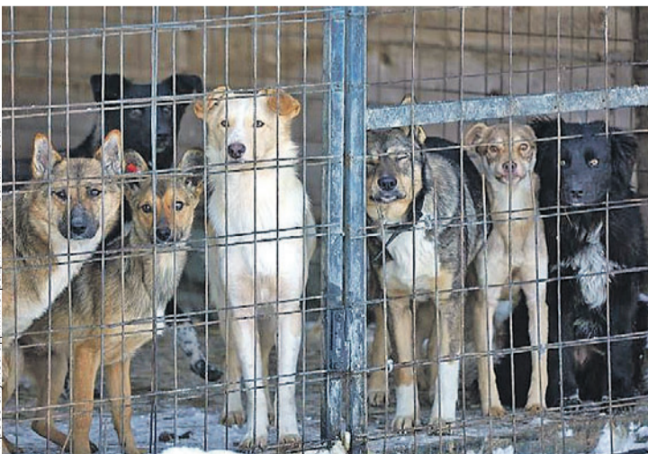
Ошейник не спасет гуляющую саму по себе собаку от вылова.