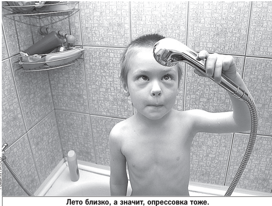
Лето близко, а значит, опрессовка тоже.

в Тюмени снижается уровень повреждаемости сетей. По сравнению с осенне-зимним периодом 2016 - 2017 годов количество инцидентов на трубопроводах, тепловых пунктах и котельных сократилось на 15%.