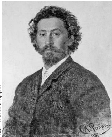
Илья Репин «Автопортрет»