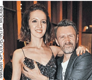
Михаил ФРОЛОВ/«КТ» - Москва