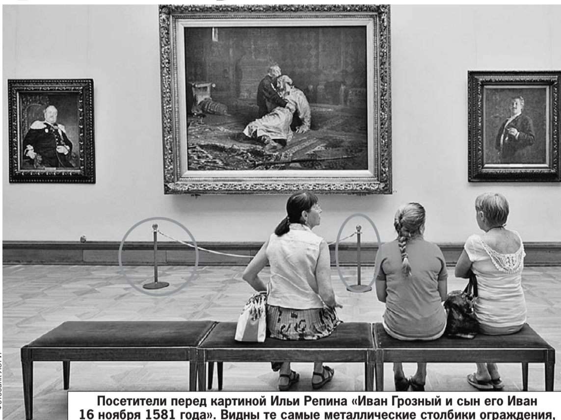
Посетители перед картиной Ильи Репина «Иван Грозный и сын его Иван 16 ноября 1581 года». Видны те самые металлические столбики ограждения, одним из которых вандал и разбил защитное стекло.

- Может быть. Но оно на порядок дороже и очень тяжелое. И это-то нелегкое. Его, кстати, в прошлом году снимали, почистили и проверили крепления - все в порядке было. Такое стекло - новая и современная защита. В Третьяковской галерее постоянно идет замена и установка таких музейных стекол. Далеко не все картины ими защищены. Нужны колоссальные средства. В галерее до сих пор кое-где остались еще довоенные стекла. Они такие как бы пузырчатые.