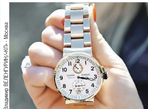
Владимир БЕЛЕНГУРИН/«КТ» - Москва

Подробности читайте на > страницах 4 - 5.