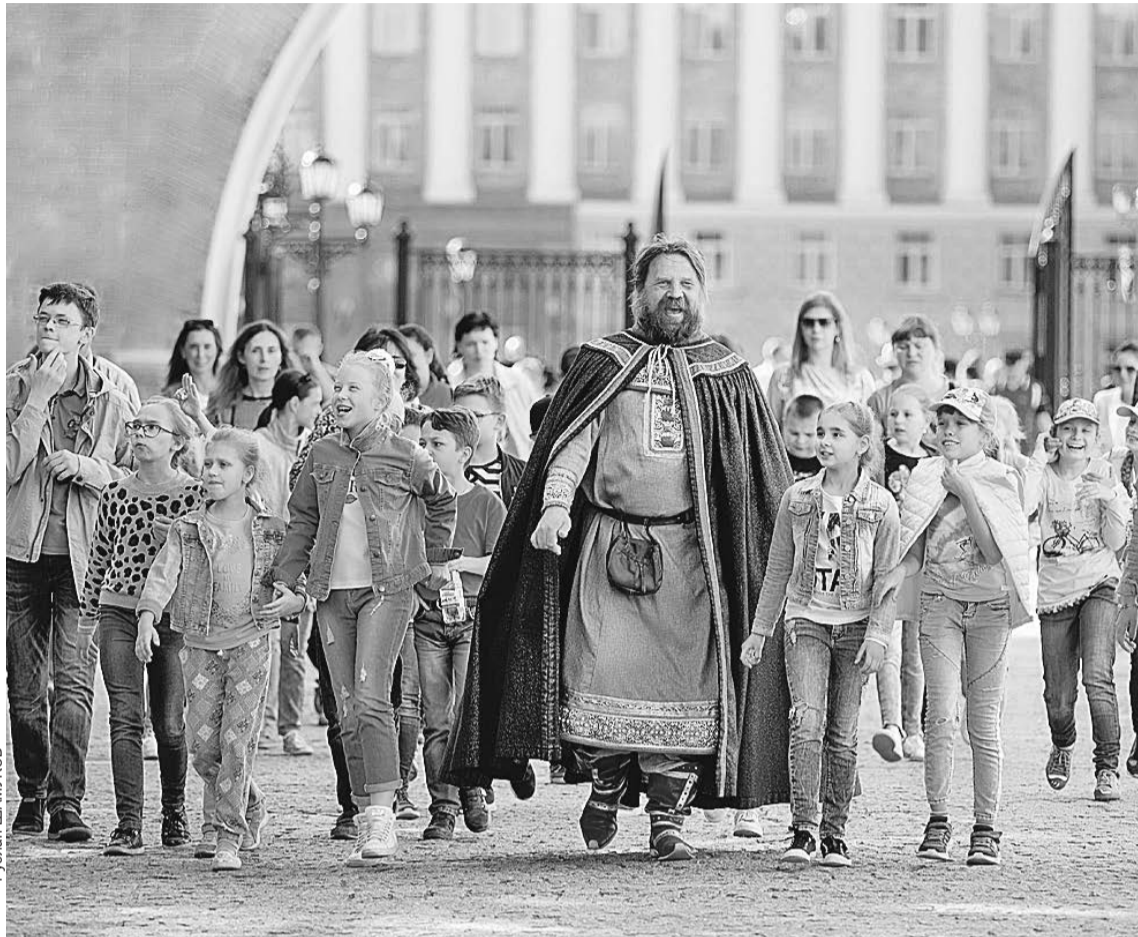
Российско-американская конференция прошла в городе, в котором гармонично сочетаются история и современность, сохраняются культурные традиции.

вательные связи, которые помогают нам в период политического противостояния, - подчеркнул Томас Лири.