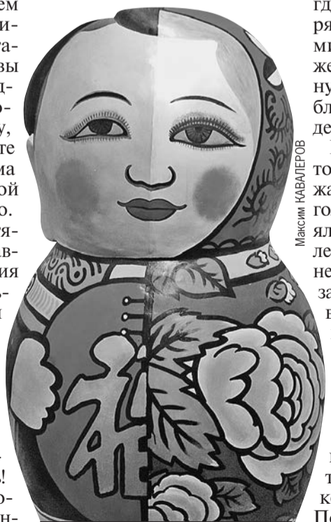
Даже матрешки на Дальнем Востоке двуликие - русско-китайские...