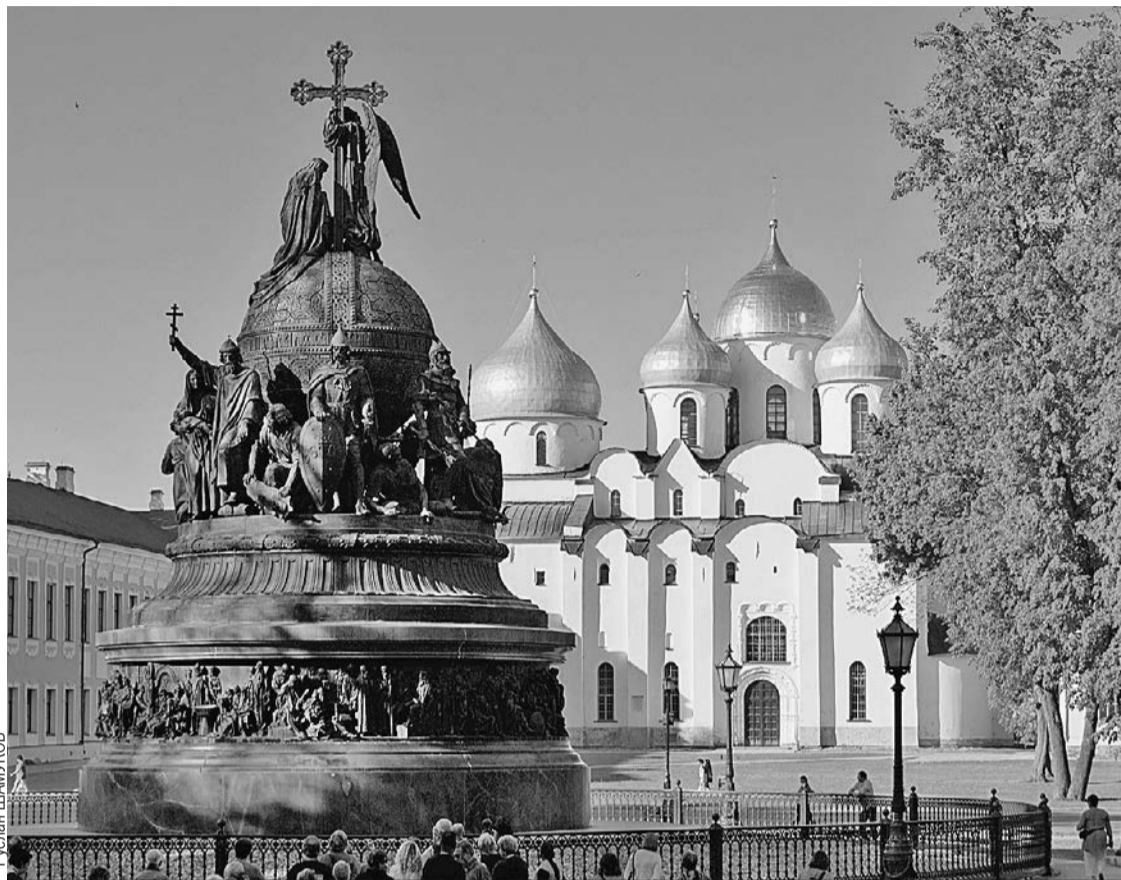
В монументе «Тысячелетие России», установленном в Новгороде в XIX веке, отражены история становления государства и ее творцы.

На повестке второго дня конференции «Диалог Форт-Росс» были вопросы кибербезопасности. Участники обсудили перспективы развития информационной