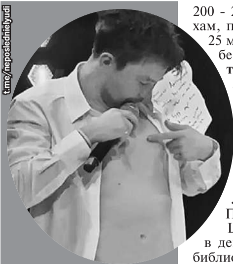
«Вот тут будет татуировка с именами наших детей!» В руках актера текст супружеской клятвы.