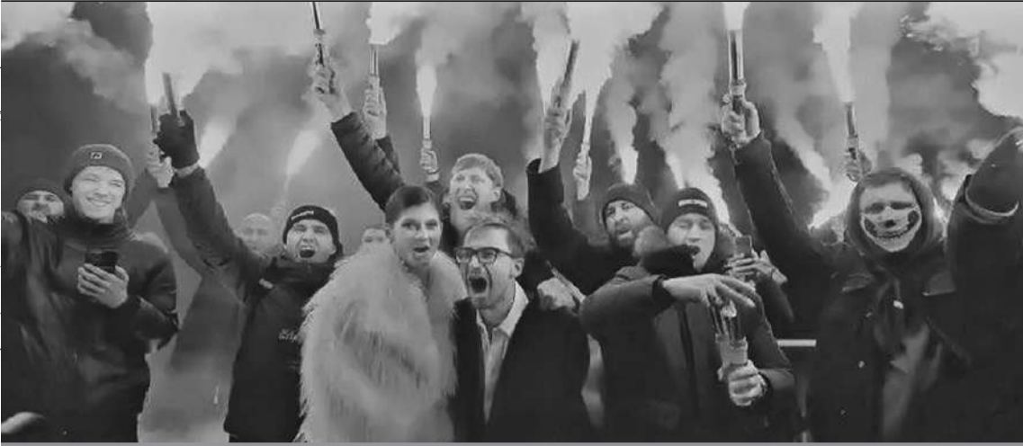
Фанаты «Спартак» высыпали из автобуса и зажгли фейеры, что сделало праздник еще больше похожим на кино.