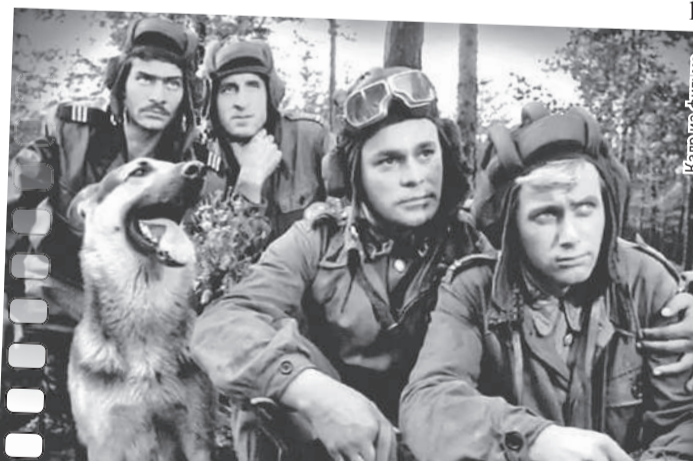
Герои сериала «Четыре танкиста и собака» - Гжегорж, Густлик, Ярош и Янек (слева направо) - были культовыми для всех соцстран. В честь этого Янека из кино и назвали собеседника нашего корреспондента.

ста и собака»? Так вот меня в честь одного из героев фильма так и назвали. Моя мама преподавала русский язык, сейчас она уже на пенсии, но к русскому языку и культуре питает