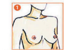
1 С опущенными руками осмотрите перед зеркалом груди.