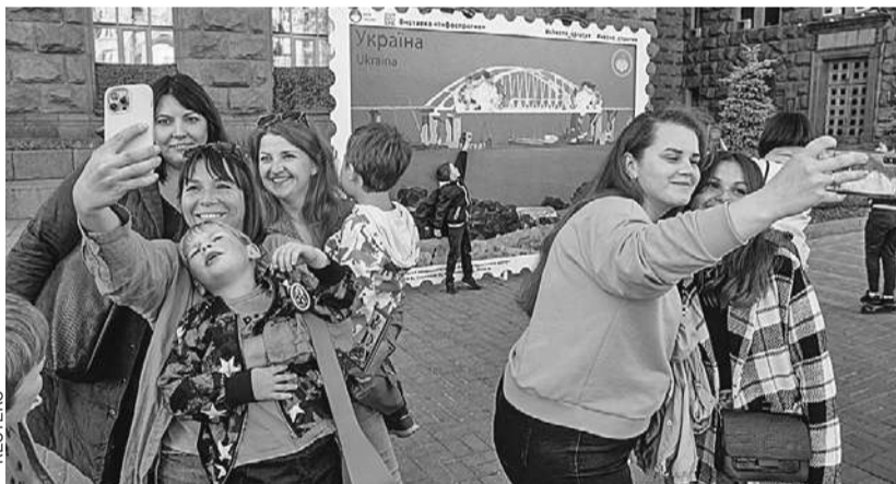
В центре Киева после субботнего взрыва на Крымском мосту жители столицы Украины с улыбками делали селфи на фоне трагической «картинки». Еще не догадываясь, что скоро будет не до смеха... (О том, как отреагировала Россия < стр. 2.)

Водитель первой фуры уже дает показания. Скорее всего, как и шофер второй фуры, он был использован вслепую и не знал о том, что везет.