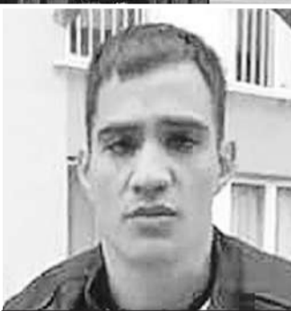
А это владелец красной фуры.