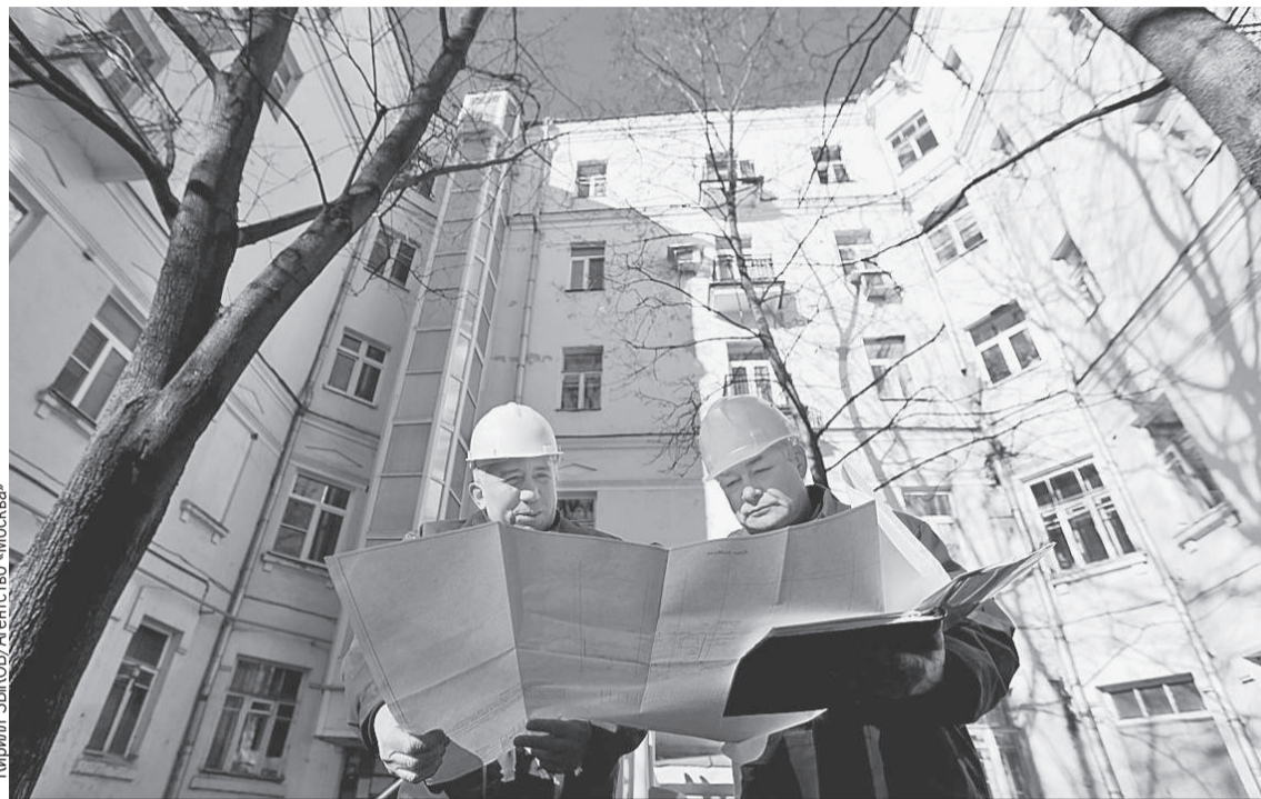
Специалисты жилищной инспекции будут тщательнее следить за качеством ремонта домов. Будем надеяться, что крыши и трубы станут протекать реже.

А теперь подробности (будет сложно, но мы разберемся). Правила расчета пени в этом году меняют уже не первый раз. Предыстория такая. По общему правилу, которое действовало до февраля