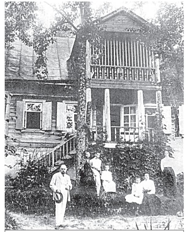
Семья Цветаевых на даче «Песочное», близ Тарусы.

хотели купить, они все оттягивали... Что им профессор? Земский начальник важнее».