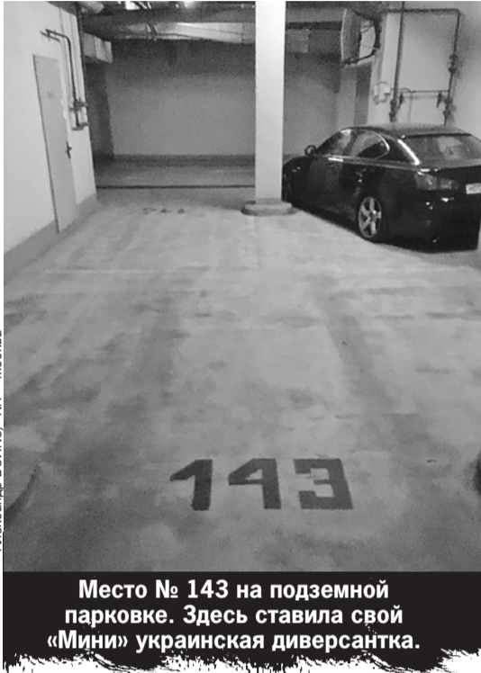
Александр БОЙКО/«КП» - Москва