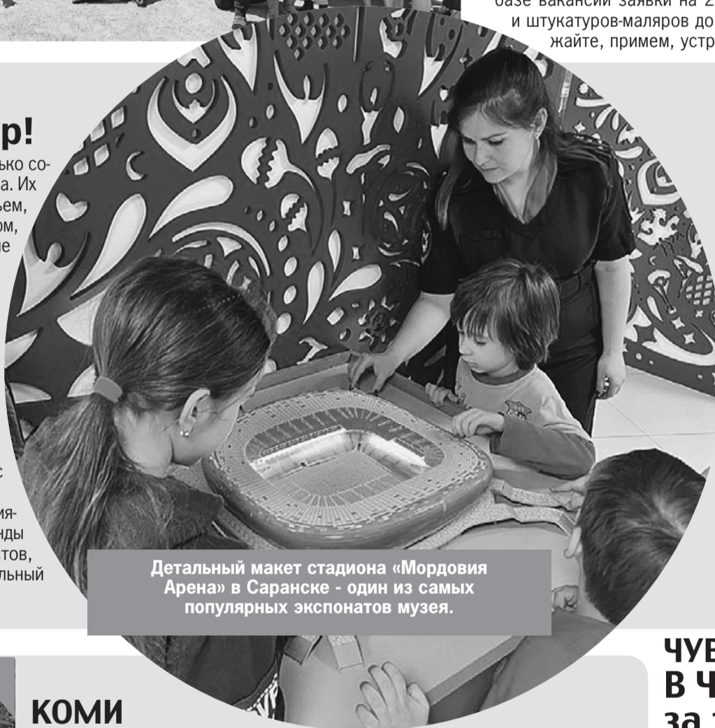
Детальный макет стадиона «Мордовия Арена» в Саранске - один из самых популярных экспонатов музея.

- А еще, - делятся ребята впечатлениями, - музей спорта - здесь есть стенды с футболками известных футболистов, исписанными автографами, и детальный макет самого стадиона.