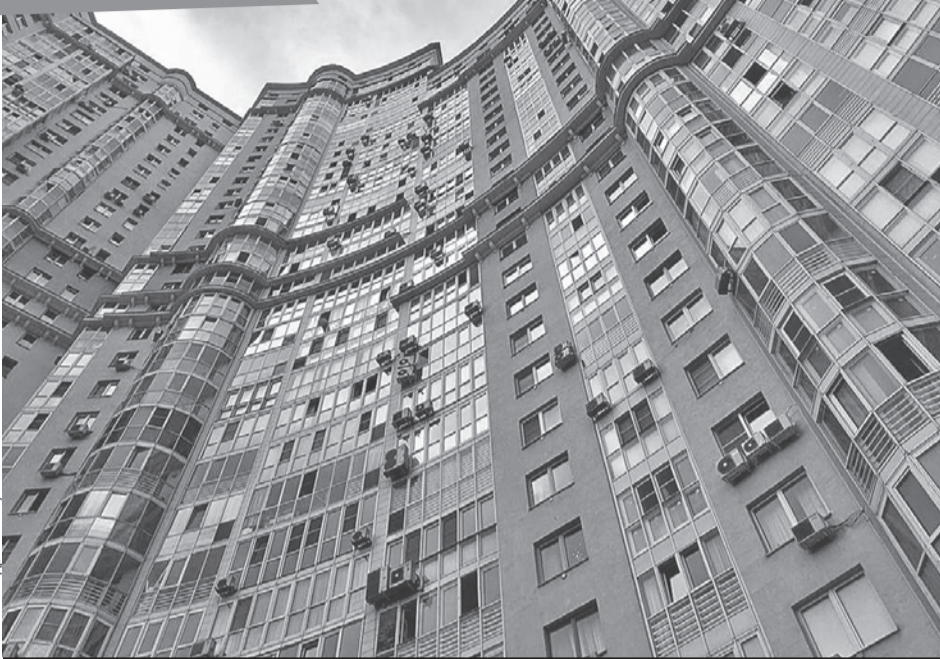
Убийца поселилась в том же доме, где жила Дарья Дугина.