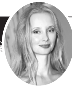
Экспресс - газета Москва