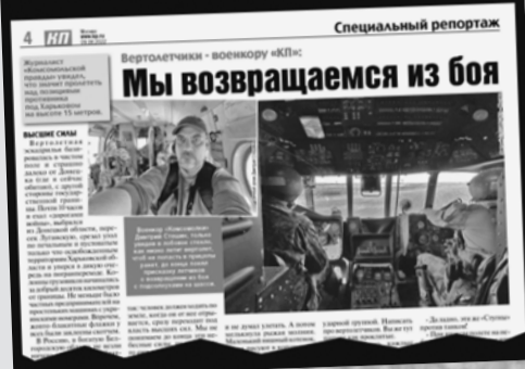
Дмитрий СТЕШИН/«КП» - Москва

Российские вертолетчики рассказали спецкору «КП», как навести бабушку, живущую у самой границы, которая их провожала и встречала с каждого боевого вылета.