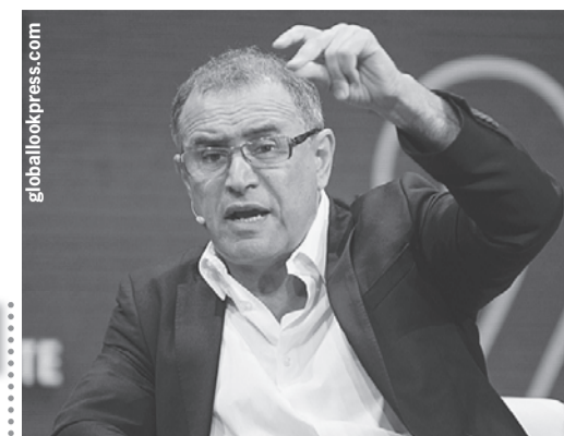
Бьющий по карману

еще его время. А если случилось, то пророк приписывает его своим способностям. Беспроигрышный вариант. Наконец, все предсказатели очень чутко улавливают состояние общества и конкретного человека. В кризисные времена люди склонны больше верить негативным прогнозам, в хорошие времена - наоборот, положительным. То есть, по сути, прорицатели говорят то, что человек хочет услышать.