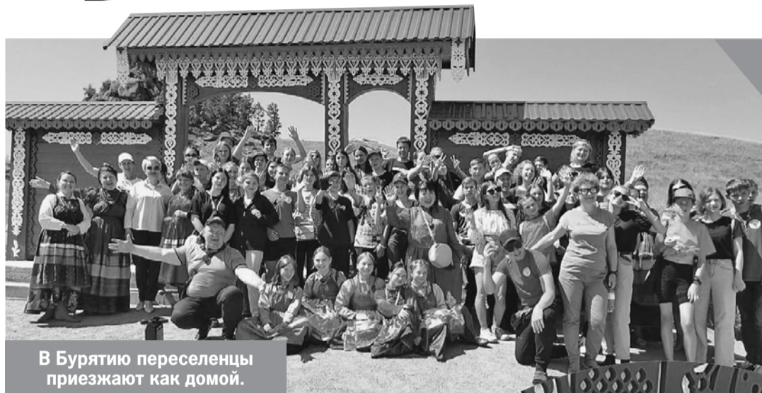
В Бурятию переселенцы приезжают как домой.